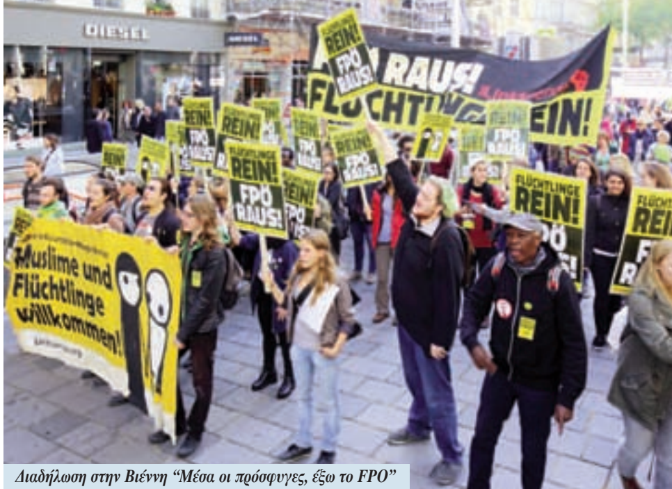
Διαδήλωση στην Βιέννη "Μέσα οι πρόσφυγες, έξω το FPO"

Η ηγεσία του FPO ήξερε από την αρχή ότι έπρεπε να κρύψει τις πραγματικές προθέσεις της και να τις καλύψει πίσω από μια φιλελεύθερη-δημοκρατική μάσκα. Ο Reinthaller είπε ότι «ο νεοναζισμός είναι μια απειλή για την πατρίδα μας και ένας θανάσιμος κίνδυνος για