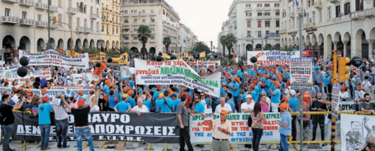
Θεσσαλονίκη, 10 Σεπτέμβρη 2016 - Εργαζόμενοι στα Λιπάσματα, οδηγοί Λεωφορείων και τεχνικοί τηλεόρασης ενωμένοι

εργαζόμενοι στο Δημόσιο, οι εργαζόμενοι στις μεγάλες ιδιωτικές εταιρείες με σχετικά σταθερές σχέσεις εργασίας είναι "μεσοστρώματα" σύμφωνα με τον συντάκτη του κειμένου αυτού. Η θέση τους βρίσκεται ανάμεσα στο κεφάλαιο και τους άνεργους, τους εργαζόμενους σε επισφαλείς θέσεις εργασίας κλπ, το "πρεκαριάτο" δηλαδή (την πραγματική εργατική τάξη, σύμφωνα με το κείμενο). Η συμβιβαστική πολιτική του "επίσημου συνδικαλισμού" (της ΓΣΕΕ, της ΑΔΕΔΥ κλπ) δεν οφείλεται στον έλεγχο της συνδικαλιστικής γραφειοκρατίας αλλά είναι έκφραση των ίδιων των ταξικών συμφερόντων αυτού του "βολεμένου" μεσοστρώματος.