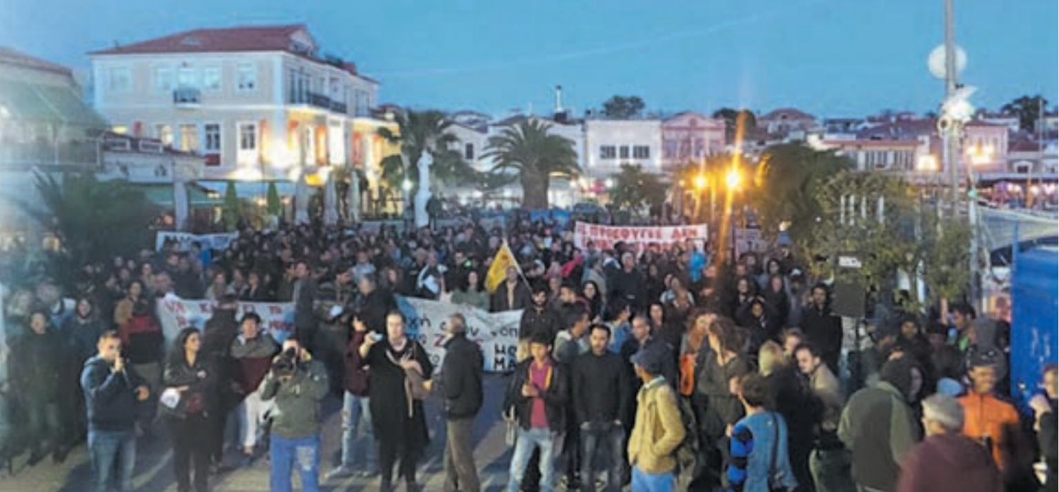
Μυτιλήνη 18 Οκτώβρη 2016. Μεγάλο συλλαλητήριο αλληλεγγύης στους πρόσφυγες.

χει μαζί με τις ΗΠΑ στο οικονομικό εμπόργκο ενάντια στη Ρωσία και στηρίζει με στρατό την ανάπτυξη δυνάμεων του ΝΑΤΟ στις χώρες της Ανατολικής Ευρώπης σε όλα τα σύνορα με τη Ρωσία.