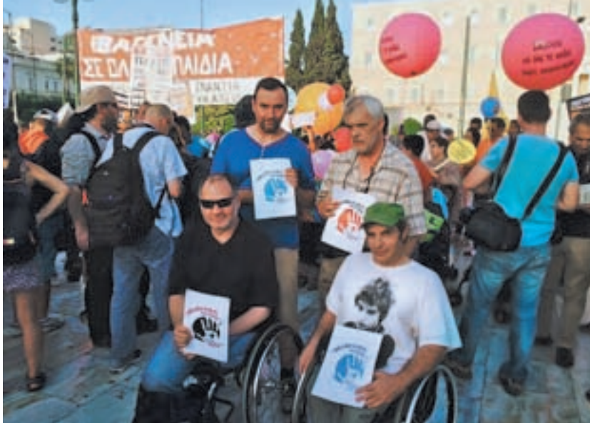
16 Ιούνη 2015. Διαδήλωση στη Βουλή για Ιθαγένεια για όλα τα παιδιά

Δεν είναι να απορεί κανείς, που η ακραία απόληξη της Ευγονικής θεωρίας βρήκε αξία εφαρμογή στη ναζιστική Γερμανία του Χίτλερ. Εκεί, η εξόντωση των