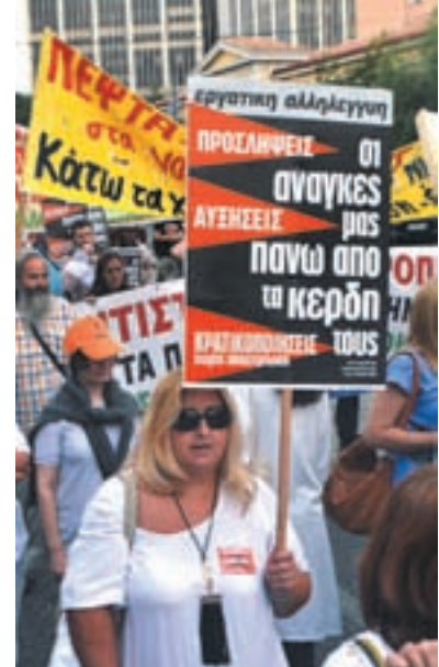
6 Οκτώβρη 2016. Τεράστιο το απεργιακό συλλαλητήριο για τη σωτηρία του ΕΣΥ.

κόμμα όπως ο ΣΥΡΙΖΑ σήμερα να έχει επιρροή μέσα στην εργατική τάξη και να αναγκάζεται να οργανώνει συνδεδυμένα για να κρατήσει την επιρροή του, χρειάζεται να πάρουμε τη βοήθεια του Ένγκελς. Έγραφε: «οι συνθήκες της εργατικής τάξης είναι η πραγματική βάση και το σημείο εκκίνησης για όλα τα κοινωνικά κινήματα σήμερα... Η γνώση των συνθηκών (που ζει) το προλεταριάτο είναι τελείως απαραίτητες για τους σοσιαλιστές». 3 Ακόμα και όταν οι οικονομικές ριζές του ρεφορμισμού εξαφανίζονται, ο ρεφορμισμός δεν θα εξαφανιστεί από μόνος του. Πολλές από τις ιδέες συνεχίζουν για μεγάλο χρονικό διάστημα, έστω και εάν έχουν εξαφανιστεί οι υλικές συνθήκες που του εξασφάλισαν την ύπαρξη. Η ανατροπή του ρεφορμισμού μπορεί να έρθει μόνο από τη συνειδητή επαναστατική δράση, από τις πρωτοβουλίες και τις ενέργειες των επαναστατών. Οι ρεφορμιστικές ηγεσίες έχουν επίγνωση της βαρύτητας που έχει η σχέση τους με την τάξη και έχουν ανάγκη να συσπειρώσουν το κόμμα τους, ακόμα και στις μεγαλύτερες δεξιές προσαρμογές τους – ιδιαίτερα τότε.