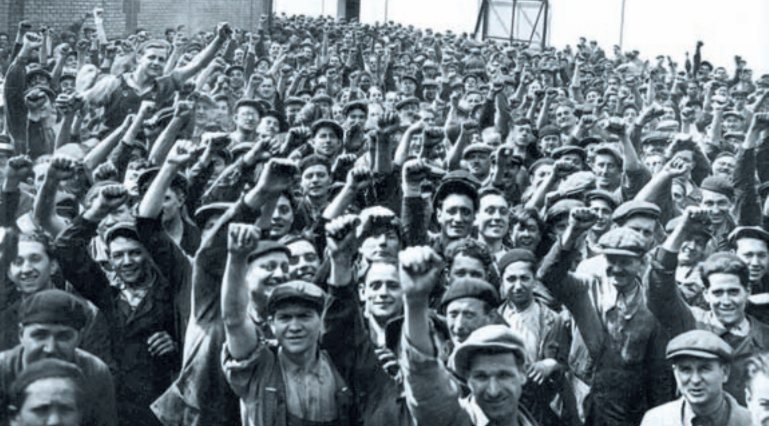
Εργάτες της Γαλλίας επέβαλαν ξανά την ενότητα το 1934 σπάζοντας την “Τρίτη Περίοδο”