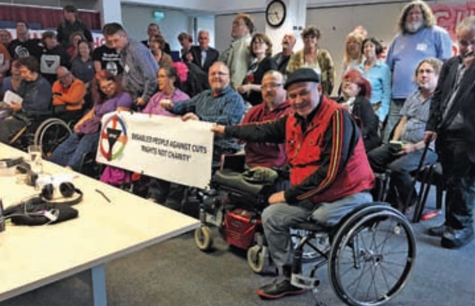
Αντιπροσωπεία της Κίνησης “Μηδενική Ανοχή” συμμετέχει σε συνέδριο στο Λονδίνο ενάντια στις περικοπές.