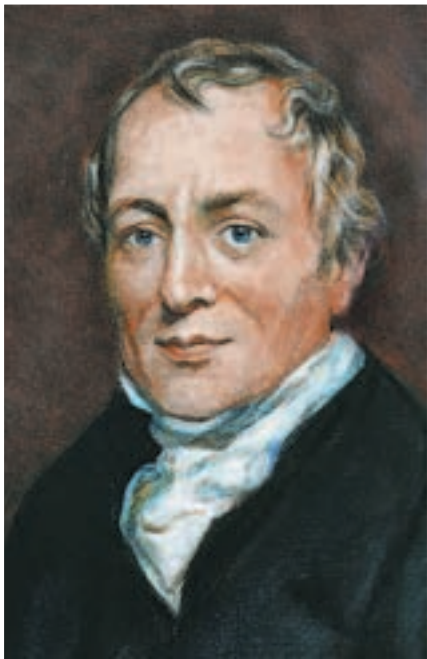
Ο Ρικάρντο προσπάθησε να αντιμετωπίσει τα προβλήματα της οικονομίας μετά τους Ναπολεόντιους πολέμους