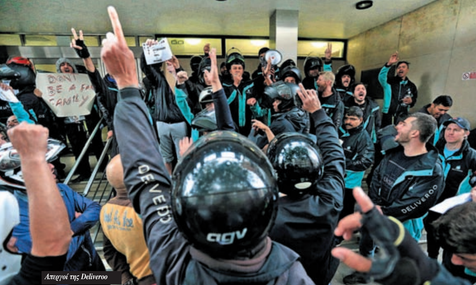
Απεργοί της Deliveroo