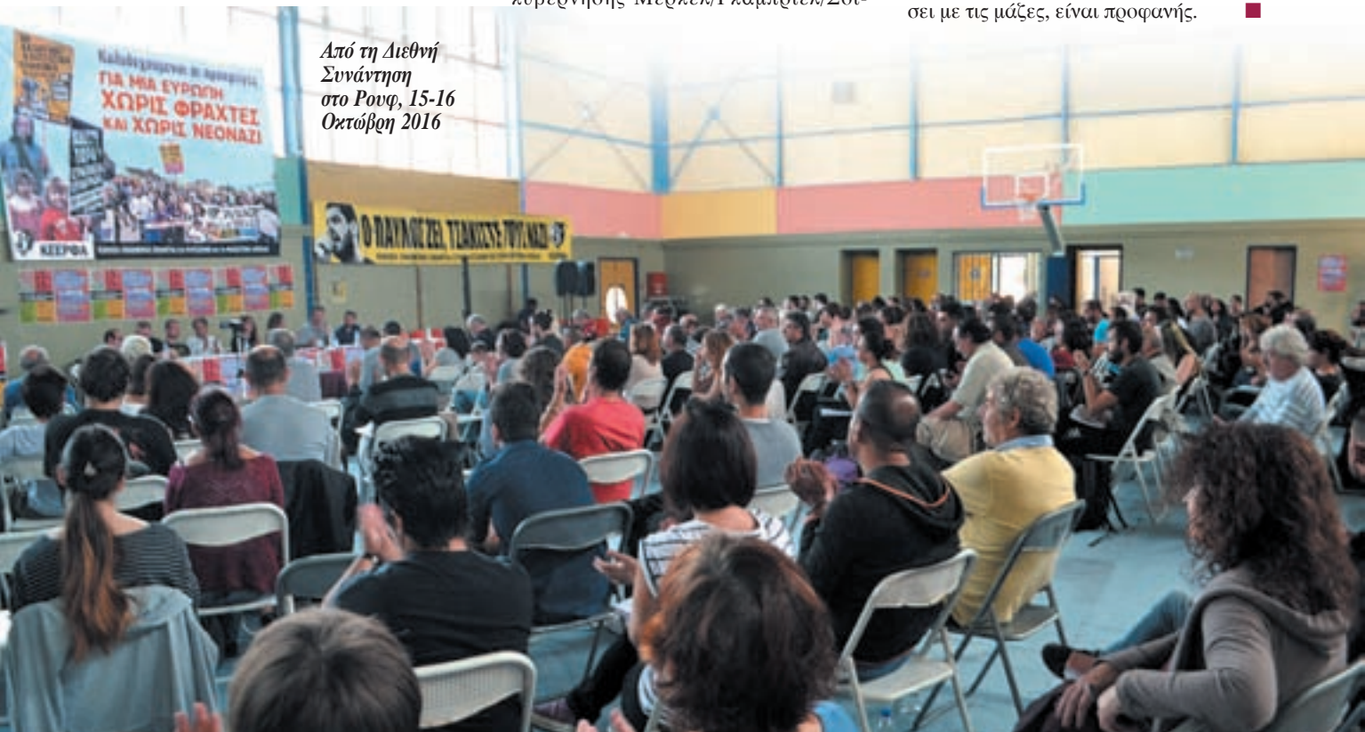
Από τη Διεθνή Συνάντηση στο Ρουφ, 15-16 Οκτώβρη 2016

Υποστηρίζουμε, στη θεωρία και στην πράξη, ότι το Die Linke πρέπει να χτίσει ένα καθαρό αντικαπιταλιστικό και αντιρατσιστικό προφίλ. Πρέπει να είμαστε κομμάτι των κοινωνικών αγώνων και να κοντράρουμε τον ρατσισμό όπου εμφανίζεται. Για να το πετύχουμε αυτό, κάνουμε συζητήσεις σχετικά με τον χαρακτήρα του κράτους, τον ρόλο της θρησκείας, την ισλαμοφοβία, κλπ. Βλέποντας την πλόωση στη Γερμανία, η ανάγκη για έναν μαρξιστικό και επαναστατικό πόλο, που θα είναι σε θέση να μιλήσει με τις μάζες, είναι προφανής. ■