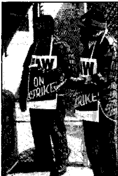
Απεργοί της Τζένεραλ Μότορς στις ΗΠΑ

συσχετισμός δύναμης ανάμεσα στο -πολυεθνικό πια- κεφάλαιο και τους εργάτες, υποστηρίζουν, έχει ανεπανόρθωτα γείρει σε βάρος των εργατών.