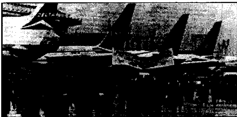
Οι εργάτες της Αιρ Φρονς καταλαμβάνουν την πίστα του αεροδρόμιου. Σε λίγο το παράδειγμά τους θα το μιμηθούν και άλλοι.

θα γίνει σαν την Λευκορωσία" - μια χώρα χωρίς επενδύσεις, με την παραγωγή ακινητοποιημένη, μια έρημος τρομαχτικής φτώχειας και ανεργίας.