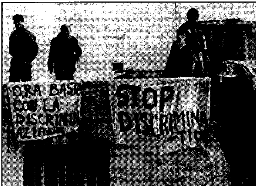
Από τις πρόσφατες εξεγέρσεις. Τα δύο πανό γράφουν "Ωρα να σταματήσουν οι διακρίσεις"

Τ ην στιγμή που οι φυλακές γεμίζουν με εργάτες, οι πραγματικοί εγκληματίες βρίσκονται έξω. Είναι οι διάφοροι Αργυροί που πήραν δώρο από τη ΝΔ "προβληματικά" εργοστάσια, τα καταληστεύσαν γεμίζοντας τους προσωπικούς τους λογαριασμούς στις τράπεζες και ύστερα τα κλείσαν πετώντας χιλιά-