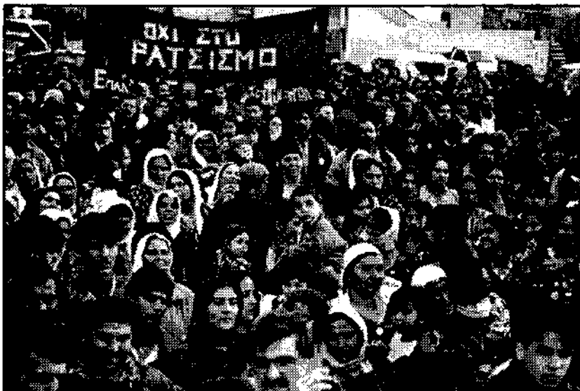
Από τη συναυλία ενάντια στο ρατσισμό στα Λιόσια

την αυγή του εργατικού κινήματος στην Ελλάδα, μέχρι σήμερα.