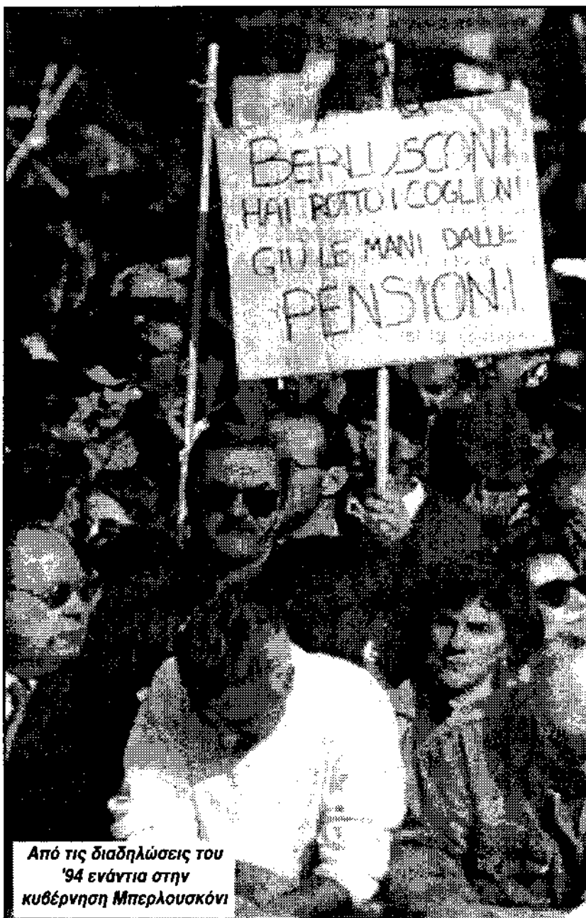
Από τις διαδηλώσεις του '94 ενάντια στην κυβέρνηση Μπερλουσκόνι

Όμως ούτε το ΔΚΑ, ούτε και η Επανίδρυση πίστευαν ότι ο Μπερλουσκόνι έπεσε από τους εργατικούς αγώνες. Αυτό το υποστηρίζαμε εμείς και άλλες πολύ μειοψηφικές φωνές στην Αριστερά.