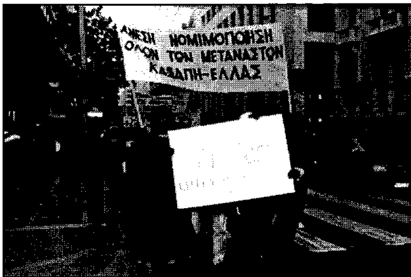
Διαδήλωση μεταναστών στις 8 Μάρτη

Υπάρχουν πάρα πολλά παραδείγματα που δείχνουν αυτή τη δυνατότητα, απ'