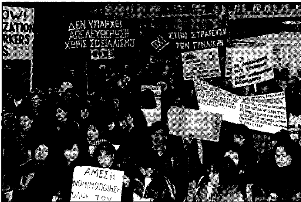
Πρώτο πλάνο, οι εργάτριες από τις Φιλιππίνες συμμετέχουν στη Διεθνή Μέρα Γυναικών