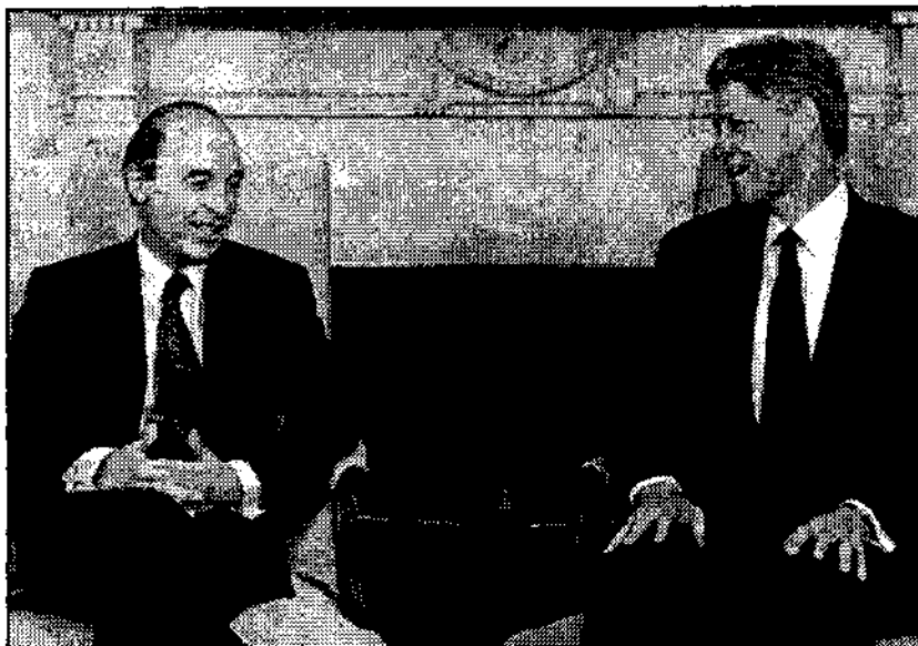
Συνάντηση Κλίντον - Σημίτη στο Λευκό Οίκο

που τόσο φρικαλέα έδειξαν το ρόλο τους στην περίπτωση της Βοσνίας.