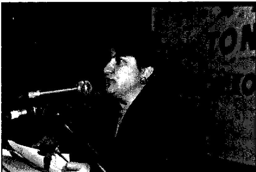
Ομιλήτρια από το Μαντούδι στη φετεινή συγκέντρωση της ΓΣΕΕ, στις 8 Μάρτη

Για πρώτη φορά αναγνωρίζεται και επιστημονικά η αυτόνομη ύπαρξη της γυναικείας σεξουαλικότητας και γίνεται αποδεκτή η δυνατότητα διαχωρισμού της από την αναπαραγωγή, ενώ η εύκολη αντιούλληψη (χάπι κλπ) και η έκτρωση νομιμοποιούν το δικαίωμα των γυναικών να επιλέ-