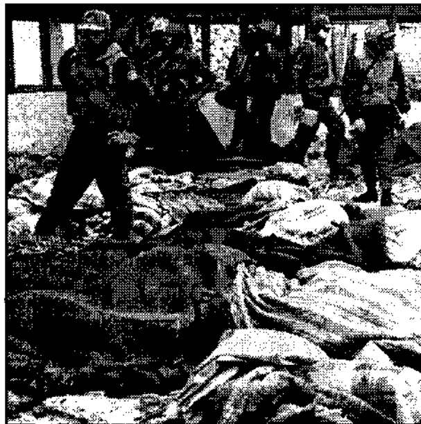
Από την σφαγή στο Λίβανο

Όμως, αυτά από μόνα τους δεν φτάνουν για το επίπεδο του στρατού και των εξοπλισμών που συντηρεί. "Για να μην αντιμετωπίσει οικονομική κατάρρευση συνεχίζουν οι ΗΠΑ να