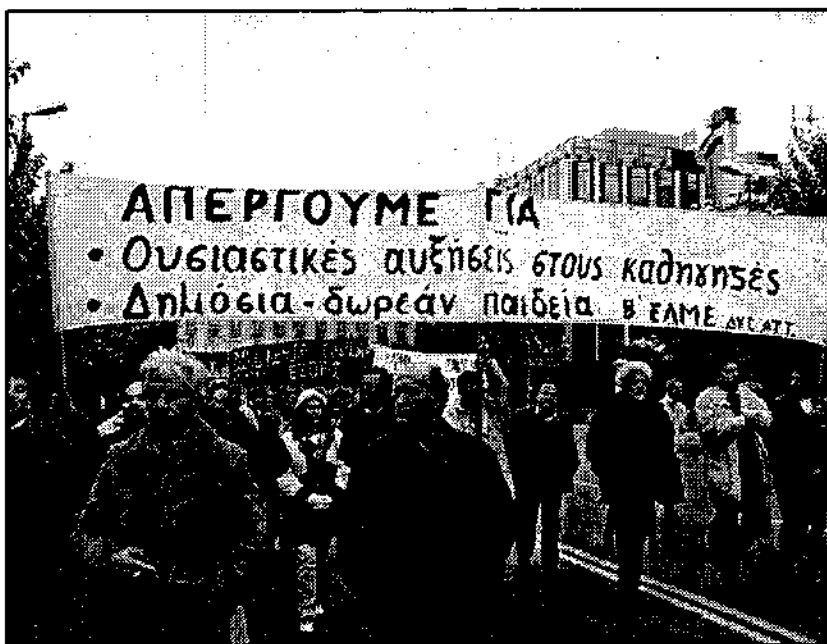
Οι εκπαιδευτικοί δείχνουν τον δρόμο. Από τη 48ωρη απεργία στις 20-21/11

στο "φθηνό χρήμα", τώρα προκαλεί ανησυχίες για απότομη αύξηση της ρευστότητας που μπορεί να πυροδοτήσει ξανά τον πληθωρισμό. Κεφάλαια που ήταν δεσμευμένα σε καταθέσεις και ομόλογα με ψηλό επιτόκιο τώρα αναζητούν άλλες μορφές τοποθέτησης και τίποτε δεν εγγυάται ότι θα στραφούν σε παραγωγικές επενδύσεις".