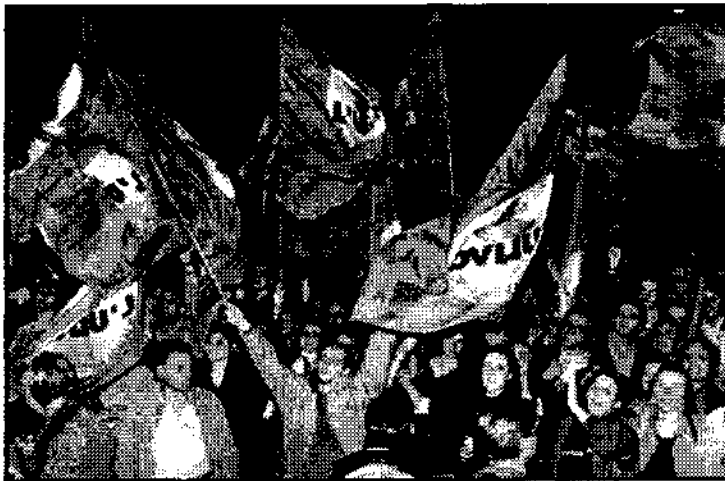
Διαδηλωτές μετά τη νίκη της "Ελιάς"

Οι αντιφάσεις ενός ρεφορμιστικού κόμματος που από τη μια το κέντρο της πολιτικής του είναι οι εκλογικές συμμαχίες ενώ από την άλλη του είναι απαραίτητη μια μαχητική βάση είναι ιδιαίτερα εμφανείς στην Επανίδρυση. Στις 24 Φλεβάρη οργάνωσε μια πολύ ζωντανή διαδήλωση 200.000 ατόμων ενάντια στις περικοπές που προέβλεπε ο προϋπολογισμός, που αποτέλεσε και την έναρξη της προεκλογικής της εκστρατείας. Με αυτή την κίνηση ήθελε να δείξει στους πιθανούς συμμάχους και στους αντιπάλους ότι είναι μια σημαντική δύναμη, που δεν μπορούν να αγνοούν. Όμως δεν έκανε τίποτα για να οργανώσει μια διαδήλωση που είχε καλέσει τον Μάρτη σε συνεργασία με άλλες οργανώσεις ενάντια στο ρατσιστικό νόμο για τους μετανάστες, επειδή ερχόταν σε