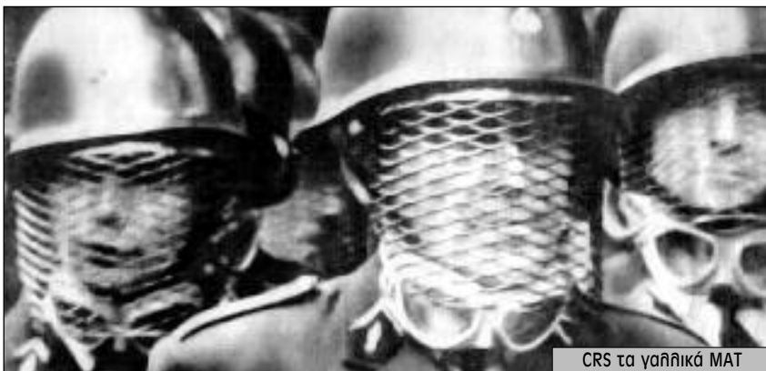
CRS τα γαλλικά MAT

Υιοθέτησαν μορφές οργάνωσης και δράσης, τελείως διαφορετικές από τις ως τότε συννησιμένες. Οι γενικές συνελεύσεις όλων των εργατών αντικατέστησαν τις συνελεύσεις δια αντιπροσώπων. Η απεργιακή δράση δεν αναβλήθηκαν πια όταν ξεκινούσαν οι διαπραγματεύσεις με την εργοδοσία, όπως συννηθίζονταν. Η φαντασία κυριάρχησε και στις μορφές πάλης,