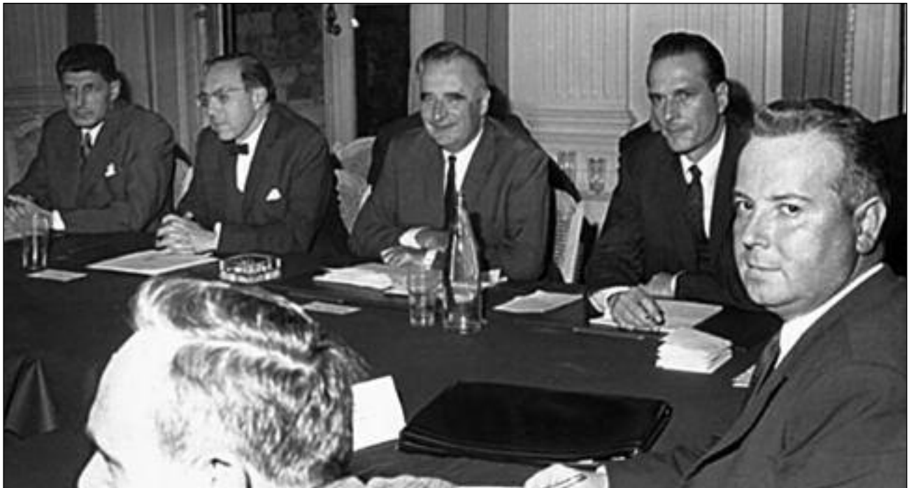
Ο πρωθυπουργός Ζ.Πομπιντού και ο γραμματέας της CGT Ζ.Σεγκί υπογράφουν τη "Συμφωνία της Γκρενέλ" για να σταματήσουν τις απεργίες

εποχή ότι είναι πιο αριστερά από την επίσημη σοσιαλδημοκρατία της Β. Διεθνούς.