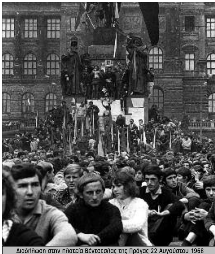
Διαδήλωση στην πλάτεια Βέντσελίας της Πράγας 22 Αυγούστου 1968

Χαρακτηριστικά για την «ομαλοποίηση» αλλά και για την πορεία της είναι όσα δηλώνει ένας από τους ηγέτες των φοιτητών το Νοέμβριο: «...οθόκληρη η πόλη νοιώθει άρρωστη. Ήταν ο τρίτος μήνας από την εισβολή. Οι παλιοί ηγέτες ήταν οι ίδιοι αλλά η τυφή εμπιστοσύνη που τους είχε ο κόσμος αρχίζει να ξεφτίζει. Η «συμφωνία της Μόσχας για την «προσωρινή» παραμονή των ξένων στρατευμάτων» δημιούργησε τις πρώτες αμφιβολίες. Ύστερα η ελευθερία του τύπου περιορίστηκε και άλλο. Οι πιο δημοφιλείς εφημε-