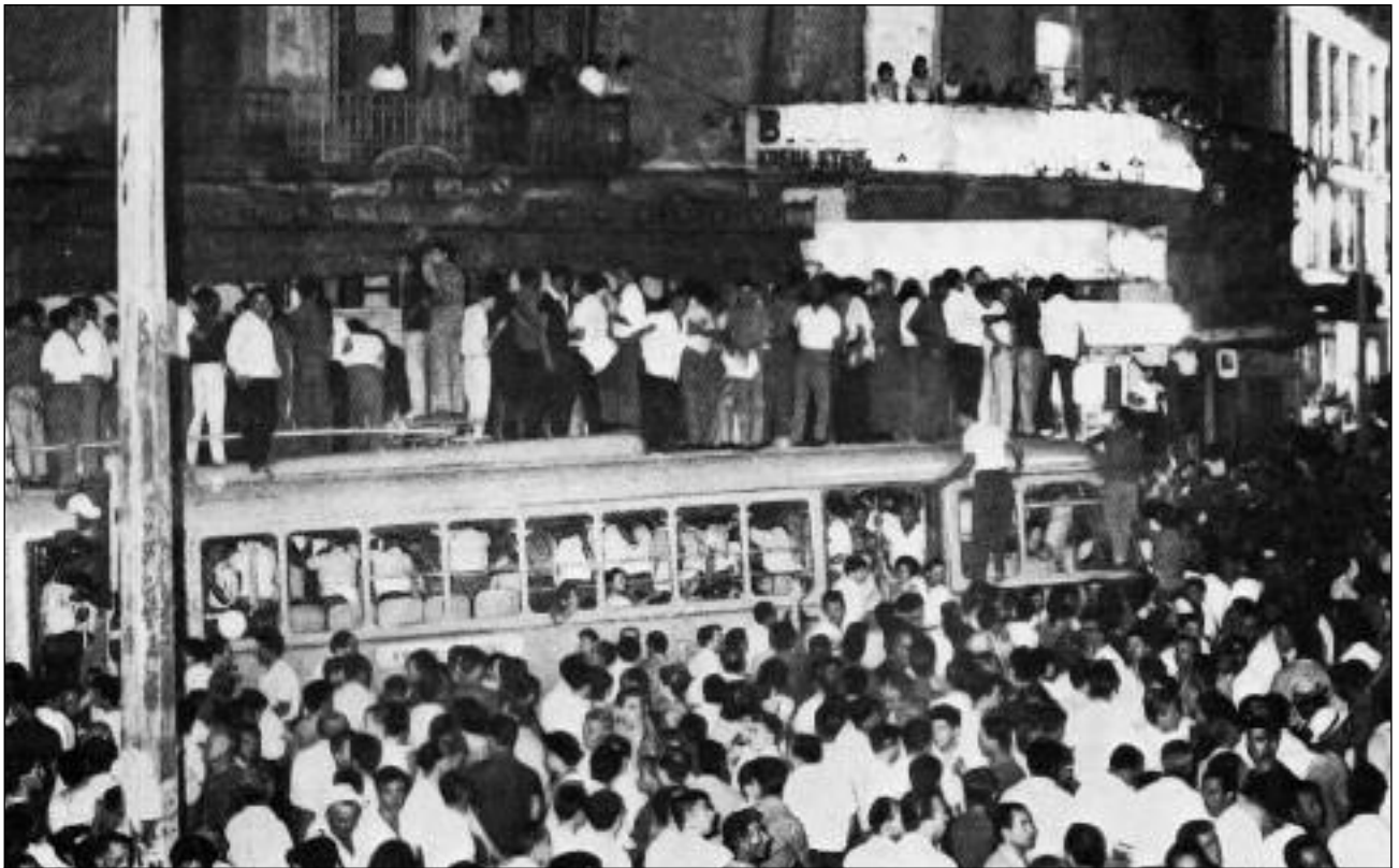
Διαδήλωση στα "Ιουλιανά" του 1965

ρεφορμισμό. Ακόμα και οργανώσεις που στηρίχτηκαν στον επαναστατικό μαρξισμό ήταν πολύ αδύνατες για να αντιμετωπίσουν την καινούργια κατάσταση.