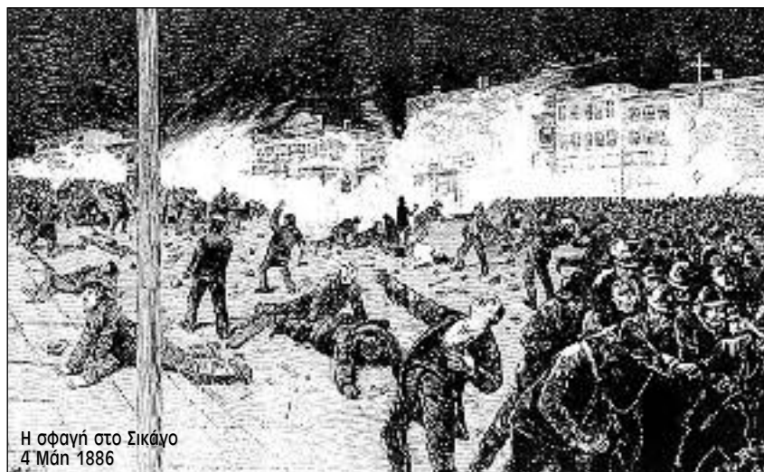
Η σφαγή στο Σικάγο 4 Μάη 1886

Αλλά, όπως τονίζει ο Γκριν, δεν ήλθαζε μόνο η μαχητικότητα των εργατών. Ήλθαζαν και οι ιδέες. Όλο και περισσότεροι ήταν εκείνοι που κατανοούσαν ότι για να αλληλάξουν τα πράγματα χρειαζόταν μια επαναστατική ανατροπή. Οι περισσότεροι εργατικοί ηγέτες στο Σικάγο υιοθετούσαν τις ιδέες του Καρλ Μαρξ, έστω κι αν πολλοί από αυτούς αυτοχαρακτηρίζονταν σαν αναρχικοί. Στην πραγματικότητα, ο «αναρχισμός» του γερμανού μετανάστη Αύγουστου Σπιάς ή του Αλμπερτ Πάρσονς, ενός πρώην στρατιώτη των Νοτίων από το Τέξας, ή της αφροαμερικάνας γυναίκας του Λούσι Πάρσονς και των συντρόφων τους δεν είχαν και πολλή κοινά σημεία με τον αναρχισμό του Μπακούιν, του αντίπαλου του Μαρξ στην Πρώτη Διεθνή. Αυτό που είχαν στο μυαλό τους ήταν, όπως παρατηρεί σε μια συνέντευξή του ο Γκριν, «το μοντέλο της Παρισινής Κομμούννας. Δεν νομίζω ότι πίστευαν ότι οι μεμονωμένες πράξεις βίας θα έφερναν την κοινωνική επανάσταση. Πίστευαν ότι αυτό θα το κάνει η οργανωμένη εργατική τάξη. Και