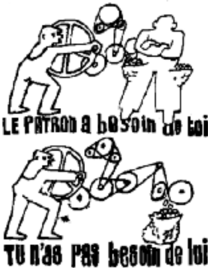
Αφίσα του 68 «Αυτός σε χρειάζεται, εσύ δεν τον έχεις ανάγκη»

Η περιγραφή του Μαρξ για τον κόσμο του Παρισιού του 1871, δεν συναντάει μόνο την επικαιρότητα 100 χρόνια μετά,