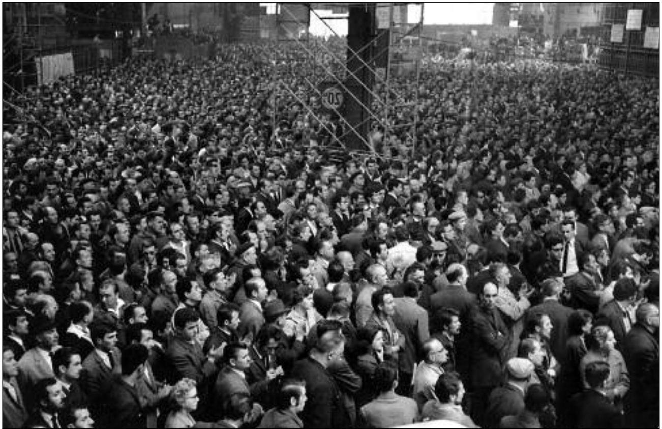
Συνέλευση εργατών στην κατάληψη της Ρενό

τώποι με τον ρατσισμό εις βάρος τους ενώ δεν απολάμβαναν καμία διευκόλυνση από το εκπαιδευτικό και το υγειονομικό σύστημα.