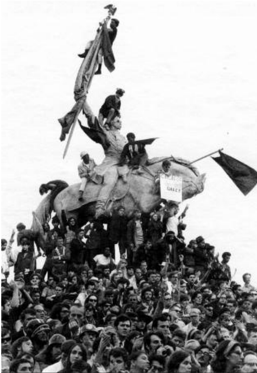
Σικάγο 1968. Αντιπολεμική διαδήλωση έξω από το συνέδριο του Δημοκρατικού κόμματος

νία συνοδικότερα; Ποιος έπρεπε να είναι ο ρόλος των φοιτητών μέσα στο κίνημα;