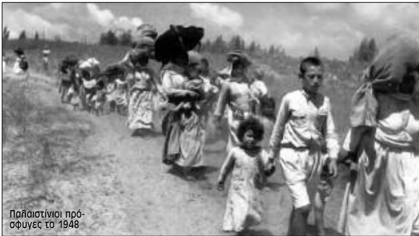
Παιδιστίνιοι πρό-σφυγες το 1948

κνύονται για άλλη μια φορά ανίκανες να υπερασπιστούν τους Παλαιστίνιους. Το παλαιστινιακό ζήτημα παύει να απασχολεί τη διεθνή πολιτική. Το 1987 ξεσπάει η πρώτη Ιντιφάντα. «Η εξέγερση είχε όλα τα χαρακτηριστικά του αντι-αποικιακού κινήματος. Η έρπουσα προσάρτηση είχε οδηγήσει στην ενσωμάτωση της τοπικής οικονομίας στην ισραηλινή... Σύμφωνα με μια εκτίμηση, αυτό συνεπαγόταν ότι ένα πλεόνασμα κερδών της τάξης των 2 δεσκατομμυρίων δολλαρίων που παραγόταν στα κατεχόμενα εδάφη απορροφούνταν από την ισραηλινή οικονομία.» Πρωταγωνιστικό ρόλο στην εξέγερση παίζουν οι γυναίκες και τα παιδιά. Οι εικόνες της ισραηλινής θηριωδίας κάνουν το γύρο του κόσμου και η αλληλεγγύη στον παλαιστινιακό αγώνα αναβιώνει.