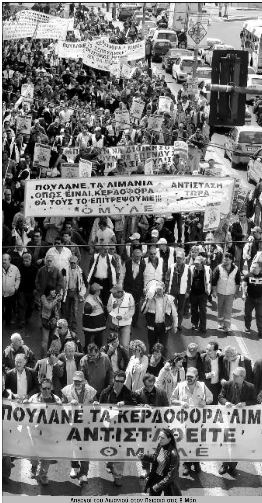
Απεργοί του Λιμανιού στον Πειραιά στις 8 Μάη

Όλα αυτά είναι μάχες πολιτικές που απαιτούν μια Αριστερά Ξεκάθαρη, επίμονη, που δεν χάνει από τα μάτια της την ευρύτερη προοπτική. Μέσα απ' αυτούς τους αγώνες και την έκβασή τους δεν κρίνονται μόνο τα ποσοστά στις επόμενες δημοσκοπήσεις ή έστω στις Ευρωεκλογές που ακολουθούν, αν η κυβέρνηση του Καραμανλή αντέξει άληθον ένα χρόνο. Κρίνονται οι ταξικοί και πολιτικοί συσχετισμοί με τους οποίους μπορούμε να μπούμε στον επόμενο «Μάη», στην επόμενη Μεταπολίτευση. Το «έπαθλο» δεν είναι με πόσους βουλευτές ή υπουργούς θα βγει η Αριστερά αυτή τη φορά. Είναι η προοπτική να ξεφορτωθούμε το σύστημα που φέρνει ξανά και ξανά κρίση, φτώχεια και πόλεμο. Σ' αυτή την κατεύθυνση θέλει να βοηθήσει αυτό το τεύχος του «Σοσιαλισμός από τα κάτω» με το αφιέρωμα στον Μάη του '68 και στις επαναστατικές ιδέες του.