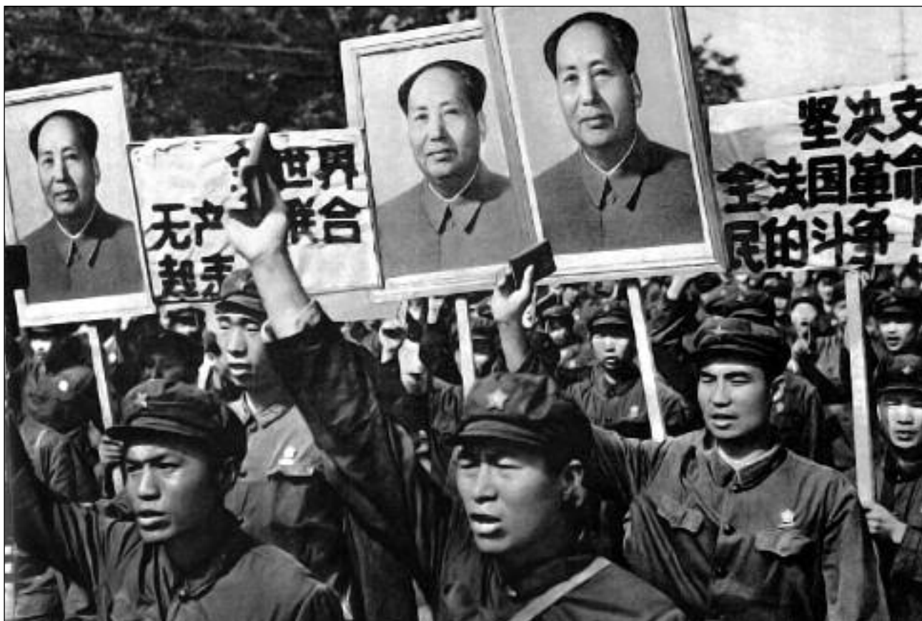
Στρατιώτες με τα πορτραίτα του Μάο

στήριξη των χωρικών υποσχόμενοι καλύτερες συνθήκες στις περιοχές που έλεγχαν. Ήθελαν όμως και την ανοχή των γαιοκτημόνων χάρη στο πλεόνασμα των οποίων επιβίωναν. Ο Εθνικός Απελευθερωτικός Στρατός δεν έκανε λόγο ότι για σοσιαλισμό, αλλά ούτε καν για αναδοσμό. Όμως, η ζωή στις περιοχές που έλεγχε ήταν σίγουρα καλύτερη σε σχέση με τις περιοχές του Κουομιντάνγκ. Στη διάρκεια του πολέμου κατάφερε να υλοποιήσει με ακόμη μεγαλύτερη επιτυχία αυτή την ισορροπία ανάμεσα στις τάξεις, αναγνωρίζοντας ως "πατριώτες" τους γαιοκτήμονες που τάσσονταν ενάντια στους ιάπωνες εισβολείς. Μετά τον πόλεμο ακολούθησε εμφύλιος ανάμεσα στο στρατό του Μάο και το Κουομιντάνγκ. Το ΚΚΚ ήταν ένα κόμμα του 1,2 εκατομμυρίων μελών συσπειρώνοντας τους χωρικούς που έβλεπαν ένα μέλλον όχι μόνο χωρίς ιμπεριαλιστές αλλά και χωρίς την εκμετάλλευση των γαιοκτημόνων. Οι χωρικοί δεν άκουγαν τις συμβουλές της ηγεσίας του κόμματος για προστασία των "πατριωτών" γαιοκτημόνων. Εκατομμύρια απλοί άνθρωποι πήραν την κατάσταση στα χέρια τους και έφεραν τα πάνω κάτω στην Κίνα για να μπορέσει τον Οκτώβριο του 1949 ο Μάο να ανακηρύξει τη Λαϊκή Δημοκρατία στο Πεκίνο. Τα απομεινάρια των Εθνικιστών