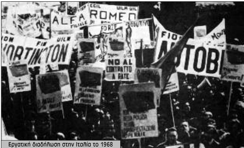
Εργατική διαδήλωση στην Ιταλία το 1968

Παρίσι με αριθμούς που ξεπέρασαν το εκατομμύριο, σχηματίζοντας τη μεγαλύτερη συγκέντρωση που έγινε στη χώρα από τον καιρό της απελευθέρωσης το '44. Στην πρώτη γραμμή βάζουν οι ηγέτες των συνδικάτων μαζί με τα «γκρουπούσκουλα», τους ηγέτες των φοιτητών.