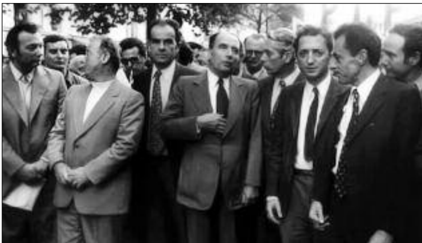
Ο Ζ.Μαρσέ (ΚΚΓ) και ο Μιτερράν (ΣΚ) οι αρχιτέκτονες του "Κοινού Προγράμματος της Αριστεράς"

πνκε το 1977. Όμως, το 1981 μετά την νίκη του Μιτερράν στις εκλογές το ΓΚΚ έδωσε τέσσερις υπουργούς του στην κυβέρνηση. Όταν αποχώρησαν το 1984, η κυβέρνηση Μιτερράν είχε εγκαταλείψει τις φιλεργατικές υποσχέσεις και είχε μπει ήδη στο δρόμο των νεοφιλελεύθερων επιθέσεων στην εργατική τάξη. Ήταν η πρώτη δυσάρεστη εμπειρία του φαινομένου που αργότερα ονομάστηκε «κεντροαριστερά»