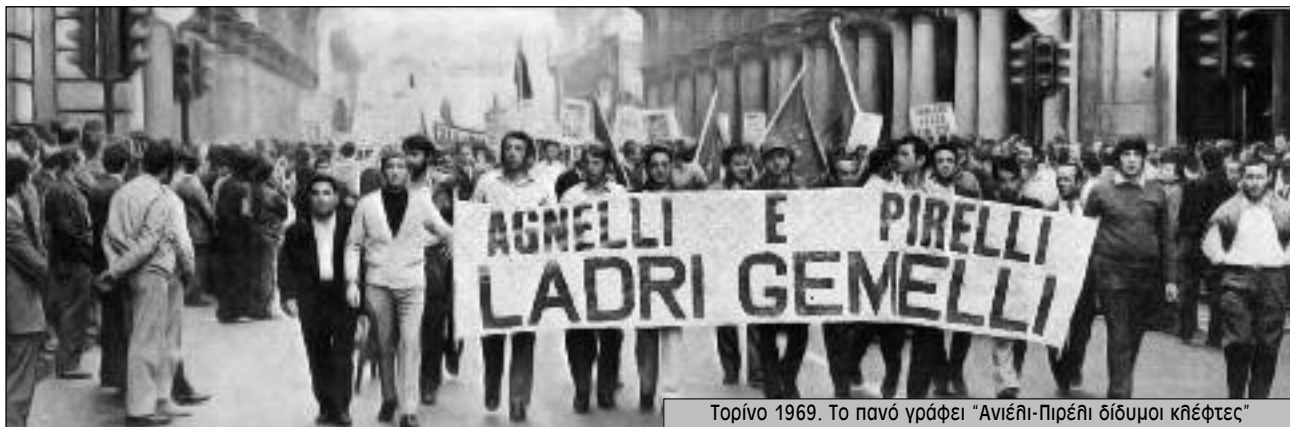
Τορίνο 1969. Το πανό γράφει «Ανιέλι-Πιρέλι δίδυμοι κλέφτες»

Εφευρέθηκαν νέου τύπου απεργίες. Οι απεργίες της «σκακίερας» και του «λήξυγκα» στις οποίες απεργούσε κάθε τόσο και διαφορετικό τμήμα του εργοστασίου ή σε διαφορετικό χρόνο. Εσωτερικές πορείες που γίνονταν από τμήμα σε τμήμα του εργοστασίου όπως στη ΦΙΑΤ του Τορίνο, κυριαρχούσαν συνθήματα όπως: «Ανιέλι, η Ινδοκίνα είναι στο εργοστάσιο σου».