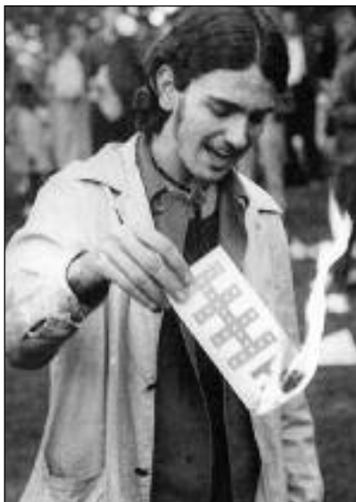
Αντιπολεμικός διαδηλωτής καιεί το "φύλλο πορείας" του στρατολογικού γραφείου

Η αμερικάνικη εκδοχή του '68 ήταν εξίσου συγκλονιστική με το Μάο. Υπήρχε όμως μια σημαντική διαφορά. Το τσάκισμα της αριστεράς και των συνδικάτων πριν από την άνοδο του κινήματος έπαιξε καθοριστικό ρόλο. Ο Μάο του 68 θα είχε παραμείνει μια φοιτητική εξέγερση χωρίς τη γενική απεργία των δέκα εκατομμυρίων εργατών και τις καταλήψεις των εργοστα-