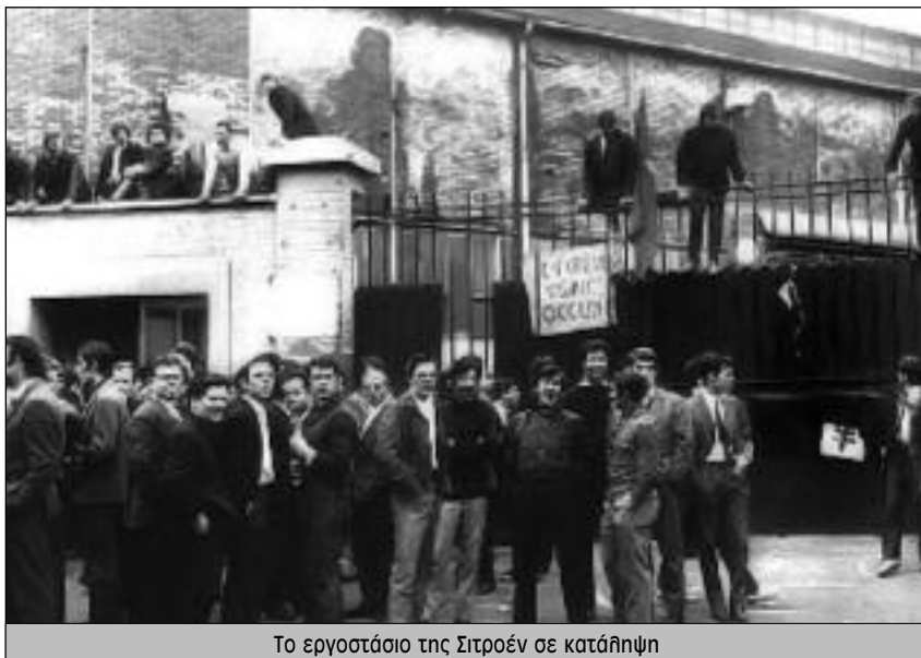
Το εργοστάσιο της Σιτροέν σε κατάληψη

Όταν πια έχουμε περπατήσει πέντε μίλια φτάνοντας στο Ισί ντε Μολιιέ, έχει πια πέσει το σούρουπο. Είναι πολύ πίσω μας τα φώτα του Καρτιέ Λατέν και του τουριστικού Παρισιού. Διασχίζουμε μικρούς, σκοτεινούς δρόμους, με τα σκουλίδια σε διάφορα σημεία να κάνουν σωρούς. Δεκάδες νέα παιδιά ενώνονται με τη πορεία, τους προσελκύουν τα επαναστατικά τραγούδια όπως «Νέα Φρουρά», «Τσίμερβαϊντ» το τραγούδι των Παρτιζάνων. «Στη Ρενό! Στη Ρενό!» είναι το σύνθημα που κυριαρχεί. Ο κόσμος μαζεύεται στις εξώπορτες, έξω από τα μπιστρό ή κοιτάει από τα παράθυρα. Κάποιοι είναι έκπληκτοι, αλλοί πολλοί, πιθανόν η πλειοψηφία, χειροκροτάει και μας γνέφει ενθαρρυντικά. Σε πολλή πεζοδρομία στέκονται Αλγερινοί και κάποιοι φωνάζουν μαζί μας «CRS SS» «Κάτω το αστυνομικό κράτος». Δεν έχουμε ξεχάσει. Πολλοί χαμογελάνε. Πολλοί λήγιο μπαίνουν στη πορεία.