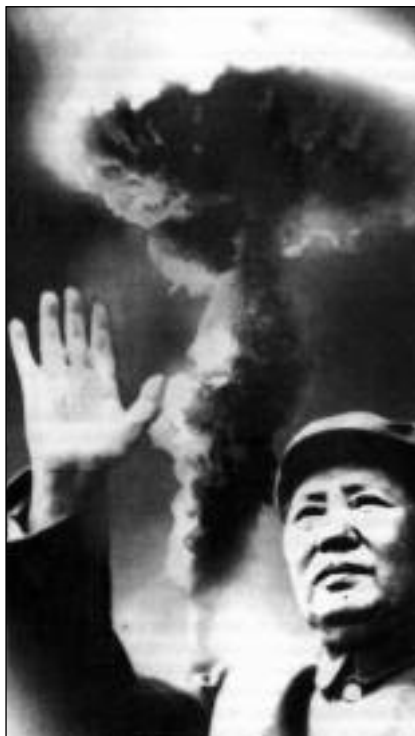
Ο Μάο και η πυρηνική βόμβα της Κίνας. Από προπαγανδιστική αφίσα του καθεστώτος

Στο εσωτερικό της Κίνας, οι διαδοχικές αποτυχίες είχαν περιθωριοποιήσει τον Μάο. Κυριαρχούσαν πλέον απόψεις υπέρ μιας σχετικής φιλελευθεροποίησης της οικονομίας. Το 1965 ανακάλυψε πως τα κομματικά έντυπα στο Πεκίνο δεν του επέτρεπαν να δημοσιεύσει ούτε καν κάποια κείμενα για ζητήματα πολιτισμού. Ο Μάο αποφάσισε πως θα έδινε τη μάχη για να ξαναπάρει το πάνω χέρι. Ωστόσο δεν έλεγχε ούτε τον μηχανισμό του κόμματος, ούτε του στρατού. Ο δρόμος που επέλεξε ήταν η "Πολιτιστική Επανάσταση". Κάλυψε τη φοιτητική νεολαία σε κινητοποίηση για να αντιμετωπίσει όσους ακολουθούν τον "καπιταλιστικό δρόμο". Ομάδες "ερυθροφρουρών" δηλαδή φοιτητών και μαθητών οπαδών του Μάο άρχισαν να συγκρούονται με καθηγητές και τη γραφειοκρατία της εκπαίδευσης. Με σύμβολο το "κόκκινο βιβλίο" του Μάο, ξέσπασε ένα