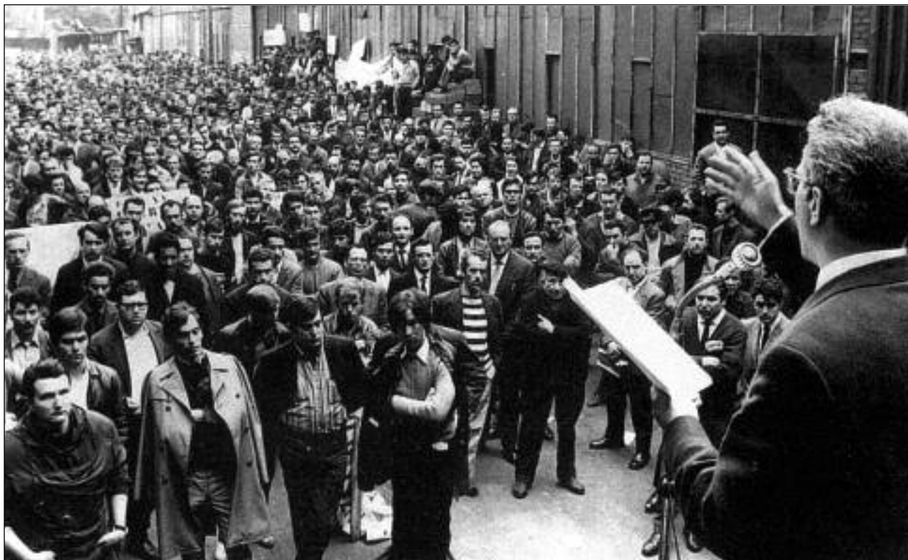
Συνδικαλιστής της CGT ζητάει από τους απεργούς της Σιτροέν να σταματήσουν την απεργία

Και εκεί το ΚΚ κράτησε εχθρική στάση. Ο Τζόρτζιο Αμέντολα, ένας από τους ηγέτες του κόμματος και εκπρόσωπος της πιο ανοιχτά σοσιαλδημοκρατικής πτέρυγας του, καθούσε σε άρθρο του στην Unità σε «επαναστατική επαγρύπνηση» και «διμέτωπο αγώνα» τόσο ενάντια στην δεξιά όσο και ενάντια σε «αναρχικές και εξτρεμιστικές θέσεις που αναπτύσσονται στο φοιτητικό κίνημα». 41