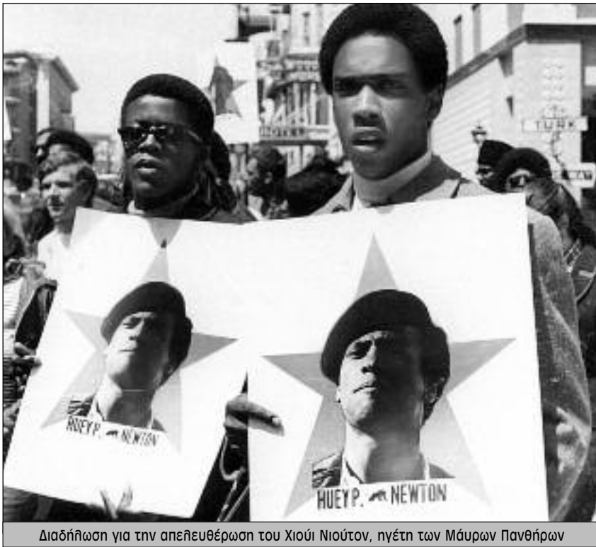
Διαδήλωση για την απελευθέρωση του Χιούι Νιούτον, ηγέτη των Μάυρων Πανθήρων

στην αντισύλληψη και την έκτρωση. Το σύνθημα «το προσωπικό είναι και πολιτικό» γεννήθηκε μέσα από τους αγώνες αυτής της δεκαετίας. Χιλιάδες γυναίκες συμμετείχαν σε εκδηλώσεις, καταλήψεις και κινητοποιήσεις για τα δικαιώματά τους, ενώ οι οργανώσεις ξεπηδούσαν σαν μανιτάρια. Το κίνημα πέτυχε μια ιστορική νίκη με την κατοχύρωση του δικαιώματος στην έκτρωση το 1973.