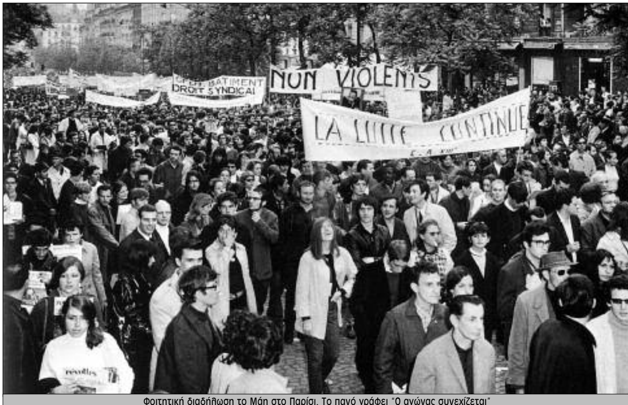
Φοιτητική διαδήλωση το Μάη στο Παρίσι. Το πανό γράφει "Ο αγώνας συνεχίζεται"

προσωπικής ζωής, το «προσωπικό» έγινε και «πολιτικό», οι γυναίκες συγκρούστηκαν με τον σεξισμό και τις απόψεις που κυκλοφορούσαν και οι ομοφυλόφιλοι βγήκαν ανοιχτά να διεκδικήσουν το δικαίωμα στην σεξουαλική διαφορετικότητα.