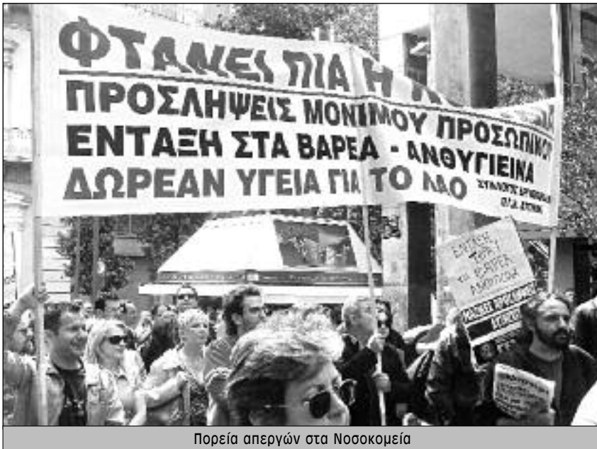
Πορεία απεργών στα Νοσοκομεία

ση στο συνδικαλισμό μέσα στους εργατικούς χώρους.