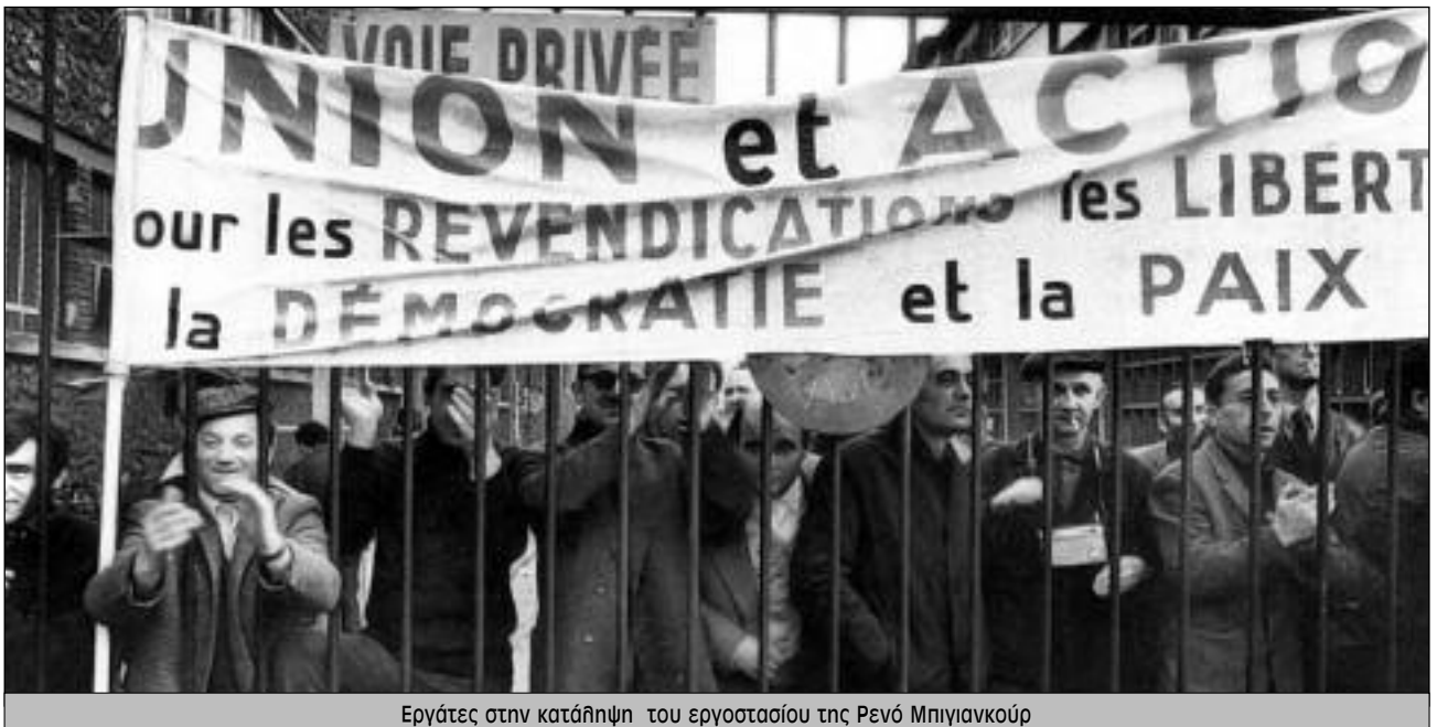
Εργάτες στην κατάληψη του εργοστασίου της Ρενό Μπιγιανκούρ