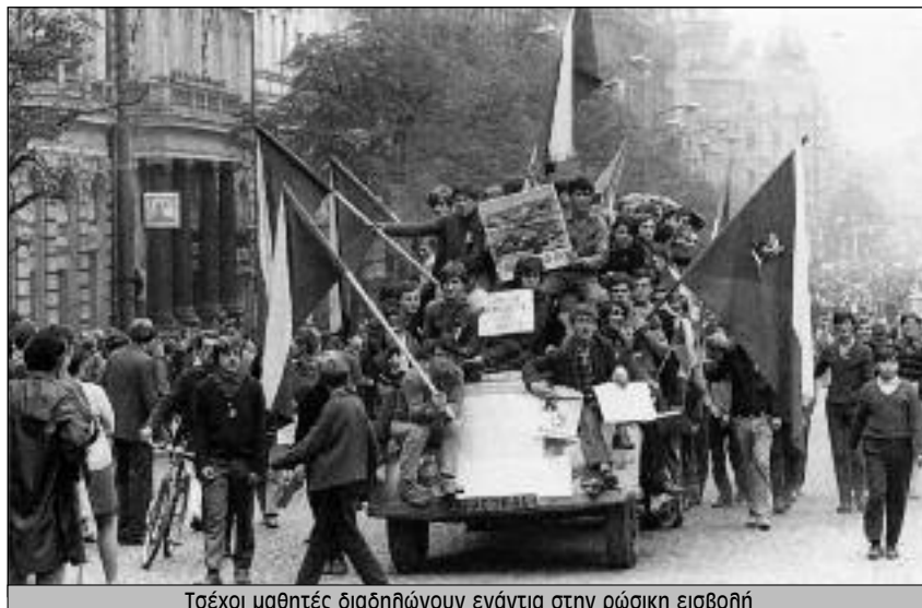
Τσέχοι μαθητές διαδηλώνουν ενάντια στην ρώσικη εισβολή

Την Κυριακή 2 Ιούνη, περίπου 1000 φοιτητές συγκρούστηκαν με την αστυνομία όταν βρήκαν τις πόρτες που θα γίνονταν μια συναυλία κλειστές. Αυτό που ακολούθησε ήταν μια πορεία 4000 φοιτητών την επόμενη μέρα από τις φοιτητικές εστίες προς το κέντρο της πόλης την οποία σταμάτησαν οι δυνάμεις της τάξης πέντε χιλιόμετρα έξω από την πόλη. Την στιγμή μάλιστα που δύο στελέχη τους καθεστώτος διαπραγματεύονταν με τους φοιτητές, η αστυνομία επιτέθηκε και τραυμάτισε δεκάδες. Το απόγευμα της ίδιας μέρας (3 Ιούνη) οι φοιτητές εξέλεξαν μια «επιτροπή δράσης», η ΦΛΣ και η Κοινωνιολογία καταλή-