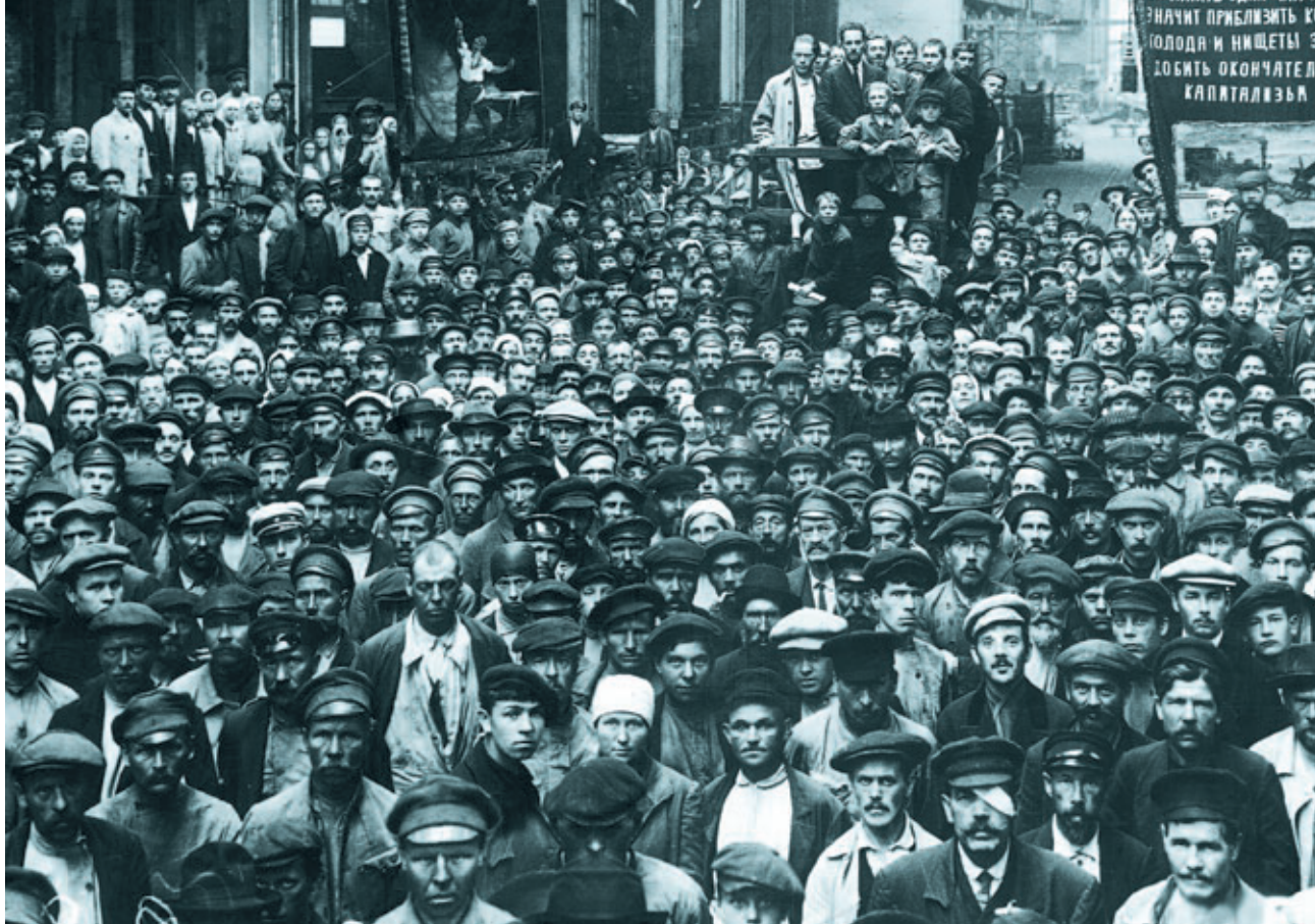
Συνέλευση των εργατών στο θρυλικό εργοστάσιο Πουτίλοφ, Ιούνης 1920.

βασίζεται στο γεγονός ότι οι «πολλοί και αδύνατοι» είναι στην πραγματικότητα πιο δυνατοί από τους «λίγους επιτήδειους».