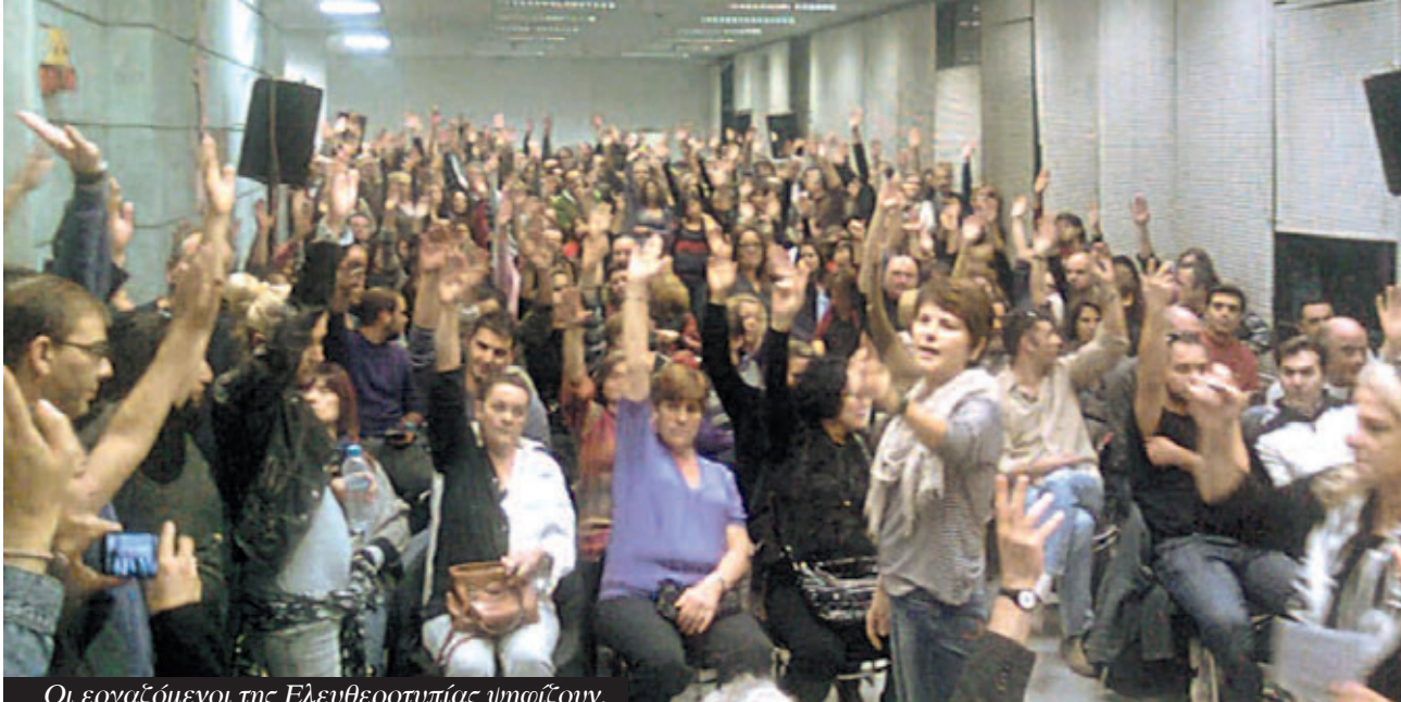
Οι εργαζόμενοι της Ελευθεροτυπίας ψηφίζουν.

σίας και λένε ότι θα υποστήριζαν τον εργατικό έλεγχο αν είχε να κάνει με «καλλιεργημένους» εργάτες όπως της Γερμανίας. Γράφει: «(ένας τέτοιος διανοούμενος) είναι πρόθυμος να αναγνωρίσει την κοινωνική επανάσταση αν η ιστορία οδηγούσε σε αυτήν τόσο ειρηνικά, ήσυχα, ομαλά και κανονικά όπως φτάνει στον σταθμό η γερμανική ταχεία αμαξοστοιχία. Ένας εντυπωσιακός οδηγός ανοίγει την πόρτα του βαγονιού και αναγγέλλει: «Στάση κοινωνική επανάσταση». Alle aussteigen (όλοι να κατέβουν)» (σελ. 321-22).