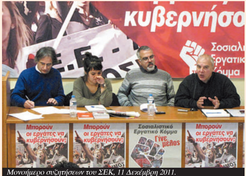
Μονοήμερο συζητήσεων του ΣΕΚ, 11 Δεκέμβρη 2011.

Το εγχείρημα της ευρωπαϊκής ιμπεριαλιστικής ενοποίησης πέρασε από αρκετές φάσεις και καμπές. Φαίνεται όμως ότι η σημερινή κρίση φέρνει στο προσκήνιο τις εγγενείς αντιφάσεις της ευρωπαϊκής ιμπεριαλιστικής ενοποίησης με τρόπο που καμία φυγή προς τα εμπρός δεν μπορεί πλέον να αντιμετωπίσει.