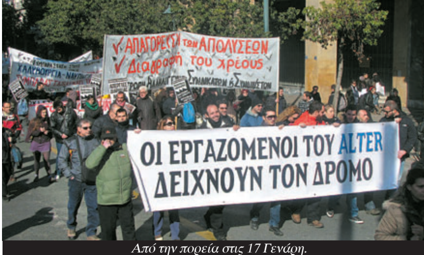
Από την πορεία στις 17 Γενάρη.

Η πιο μεγάλη ανησυχία τους είναι η κρίση στο ΠΑΣΟΚ που παίρνει τις μεγαλύτερες διαστάσεις και γι' αυτό κινούνται όλα τα συγκροτήματα να εξασφαλίσουν μια ομαλή διαδοχή. Αν οι δελφίνοι του ΓΑΠ και τα διαπλεκόμενα συμφέροντα που τους στηρίζουν έλπιζαν ότι μια απομάκρυνσή του θα έφευγε ηρεμία στις τάξεις του ΠΑΣΟΚ, έπεσαν τελείως έξω. Στα Νέα, ένας από τους δημοσιο-