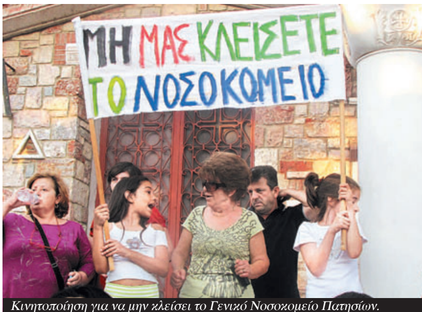
Κινητοποίηση για να μην κλείσει το Γενικό Νοσοκομείο Πατησίων.

Προφανώς και αυτοί οι αγώνες είναι κομμάτι του συνολικού εργατικού κινήματος. Κατ' αρχάς η επίθεση αυτή των εργοδοτών του ιδιωτικού τομέα (και άρα η αγωνιστική απάντηση που δίνουν οι εργαζόμενοι) είναι ακριβώς η ίδια με την επίθεση της κυβέρνησης και της τρoίκας δύο χρόνια τώρα στον δημόσιο τομέα. Η προσπάθεια να χτυπήσουν τους μισθούς και τον συνδικαλισμό στον δημόσιο τομέα συνοδεύτηκε με τα ψέματα για «τους τεμπέληδες δημόσιους υπάλληλους με τους παχυλούς μισθούς». Τώρα λένε τα ίδια με διαφορετικά λόγια για την ανάγκη «μείωσης του κόστους εργασίας». Όμως η επίθεση είναι κοινή.