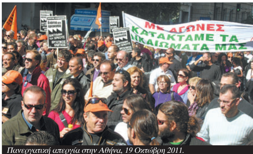
Πανεργατική απεργία στην Αθήνα, 19 Οκτώβρη 2011.

Το δεύτερο στοιχείο είναι η δυνατότητα να απλωθεί αυτό το κίνημα σε όλη την Ελλάδα. Η εκδήλωση της ΕΠΑΣΣ στη Ξάνθη έδειξε ότι υπάρχει η δυνατότητα να απλωθεί αυτό το κίνημα παντού. Αντίστοιχα ζητήματα και μάχες υπάρχουν σε κάθε γωνιά της Ελλάδας και άρα αντίστοιχα υπάρχει η δυνατότητα να γίνουν παντού τα βήματα συντονι-