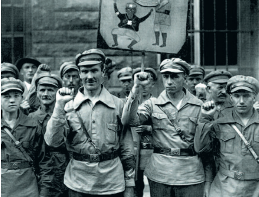
Μέλη του Κομμουνιστικού Κόμματος Γερμανίας (KPD) συγκρούστηκαν με τους ναζί στους δρόμους.

Όταν έξι μήνες μετά, στις 30 Γενάρη 1933, ο Χίντεμπουργκ θα διόριζε τελικά τον Χίτλερ καγκελάριο, η κοινοβουλευτική ομάδα του SPD αποφάσιζε ότι «αν ο Χίτλερ ακολουθήσει την συνταγματική οδό...», τότε «θα ήταν λάθος να του δώσουμε εμείς την αφορμή να παραβιάσει το Σύνταγμα».