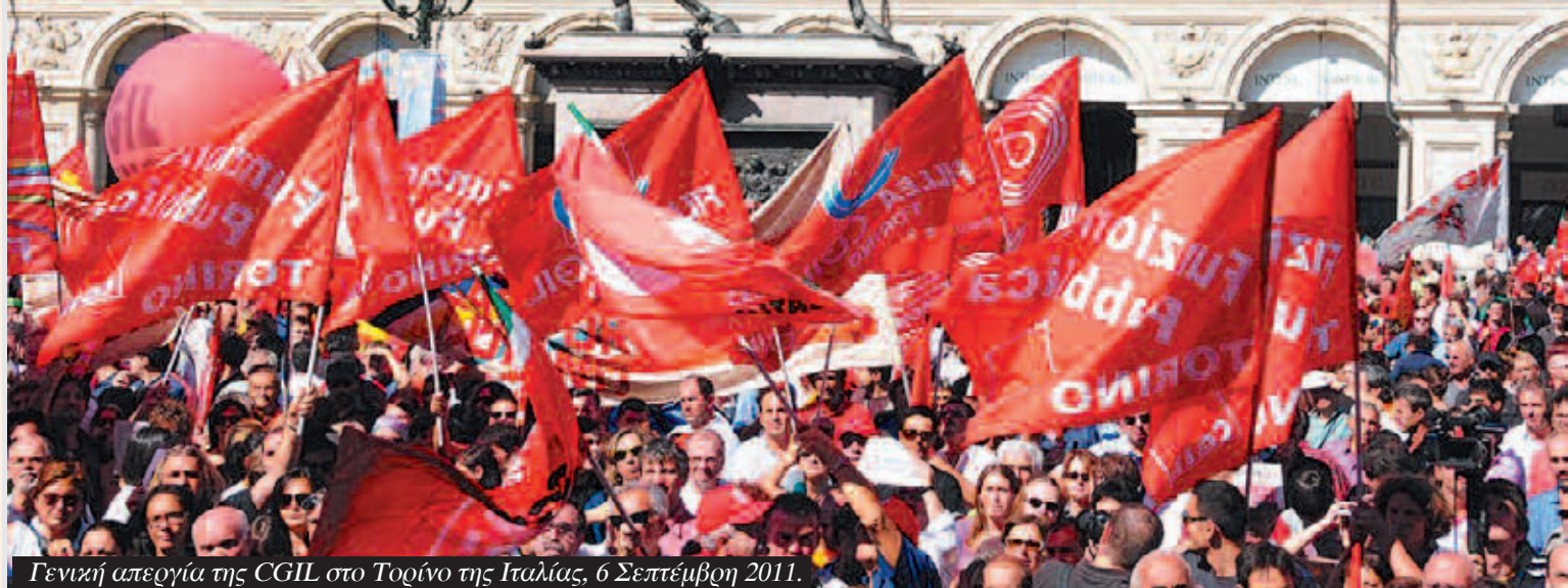
Γενική απεργία της CGIL στο Τορίνο της Ιταλίας, 6 Σεπτέμβρη 2011.

σπούν οι εργαζόμενοι, λέει με άλλα λόγια το «Bloomberg», «εκλαϊκεύοντας» τα όσα διαδραματίζονται τις τελευταίες ημέρες στη χώρα μας με τη νέα εντολή της τρόικας για νέο κόψιμο στους μισθούς του ιδιωτικού τομέα.