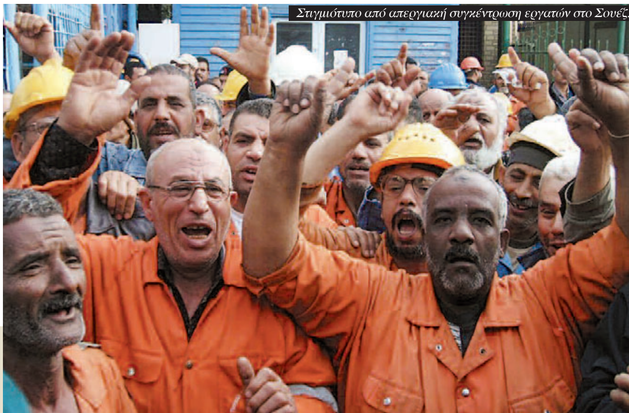
Στιγμιότυπο από απεργιακή συγκέντρωση εργατών στο Σουέζ.

Ίσως τα γεγονότα της 18ης Νοέμβρη παρέχουν την πιο καθαρή ένδειξη για τις αντιφάσεις της παρούσας στιγμής. Παρά τις συμφωνίες μεταξύ των δυνάμεων της ρεφορμιστικής αντιπολίτευσης με επικεφαλής τη Μουσουλμανική Αδελφότητα και του στρατιωτικού συμβουλίου, υπάρχουν κρίσεις που βράζουν σχετικά με τη μοιρασιά της εξουσίας. Μοιρασιά ανάμεσα στην Αδελφότητα που θα σαρώσει στις κάλπες και στη συνέχιση των εκτάκτων εξουσιών και οικονομικών προνομίων του στρατού και της κυρίαρχης ομάδας επιχειρηματιών που ήταν και παραμένουν κομμάτι του παλιού καθεστώτος, ή καλύτερα η καρδιά του. Αυτό φάνηκε ξεκάθαρα στο έγγραφο που παρουσίασε ο Αλί Σελμί, το οποίο εγγυάται πως αυτές οι έκτακτες