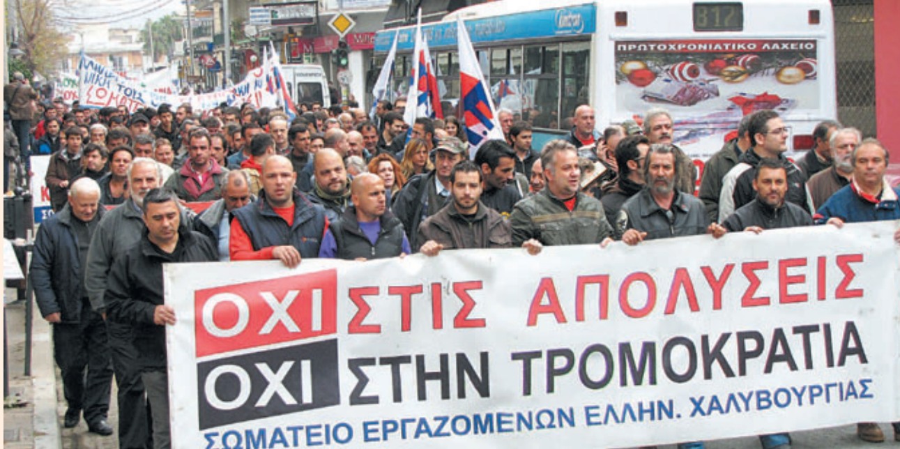
Οι απεργοί χαλυβουργοί διαδηλώνουν στους δρόμους της Ελευσίνας, 13 Δεκέμβρη 2011.

χωρίζει την αστική από την προλεταριακή στρατηγική. Η ελληνική αστική τάξη, παρόλα τα εξόφθαλμα πλέον αδιέξοδα της, είναι δεσμευμένη στην ΕΕ και, παρά και τις δικές της ζημιές, δεν τολμά να αντιπαρατεθεί στους ηγεμόνες της ΕΕ θεωρώντας ότι το κόστος θα είναι ακόμη μεγαλύτερο.