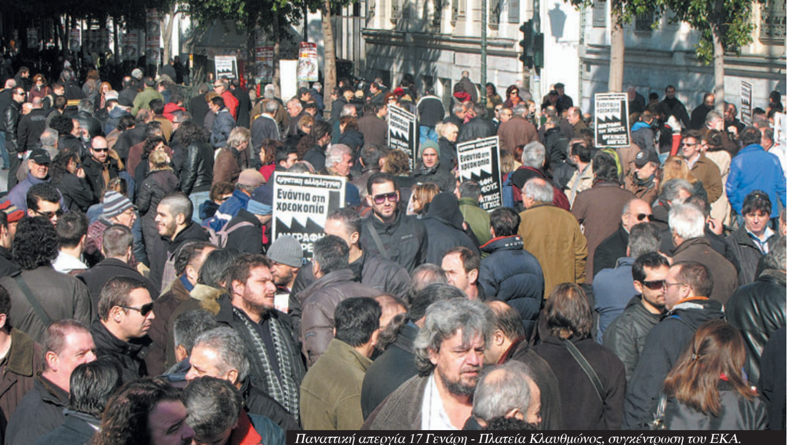
Παναθηναϊκή απεργία 17 Γενάρη - Πλατεία Κλαυθμώνος, συγκέντρωση του ΕΚΑ.