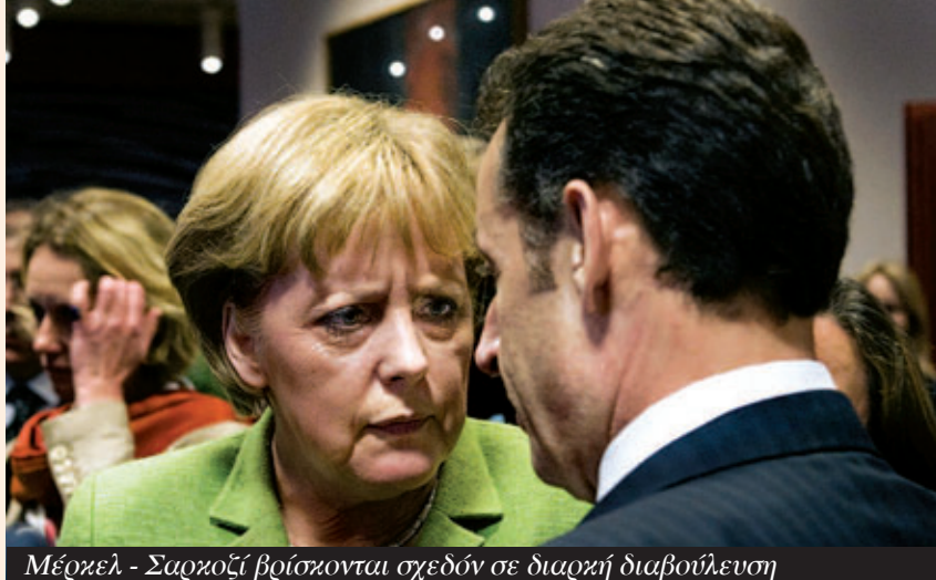
Μέγκελ - Σαρκοζί βρίσκονται σχεδόν σε διαρκή διαβούλευση

Η τρέχουσα οικονομική κρίση αποτελεί συνεπακόλουθο της δομικής κρίσης του 1973 – που απαιτούσε μία ριζική αναδιάρθρωση της «εσωτερικής αρχιτεκτονικής» του καπιταλιστικού συστήματος – και της αποτυχίας των διαδοχικών κυμάτων καπιταλιστικών αναδιαρθρώσεων που ακολούθησαν να δημιουργήσουν μία νέα και λειτουργική τέτοια αρχιτεκτονική. Αυτά τα κύματα καπιταλιστικών αναδιαρθρώσεων κατόρθωσαν μόνο μερικά να αναστρέψουν την πτωτική τάση του ποσοστού κέρδους και να απαλύνουν την υπερσυσσώρευση του κεφαλαίου. Ιδιαίτερα το τελευταίο κύμα, δηλαδή ο νεοφιλελευθερισμός, οδήγησε σε μία αλματώδη αύξηση της διεθνοποίησης του κεφαλαίου (τη λεγόμενη «παγκοσμιοποίηση») που όταν έφθασε στα όρια της κατέφυγε σε μία ανεξέλεγκτη φυγή προς τα εμπρός με την εκπε-