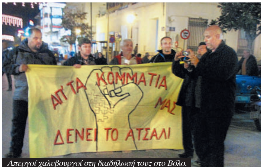
Απεργοί χαλυβουργοί στη διαδήλωσή τους στο Βόλο.

Κατ' αρχάς να ξεκαθαρίσουμε ότι ο συντονισμός είναι καθοριστικής σημασίας σε αυτούς τους αγώνες. Δίνει οξυγόνο σε κάθε χώρο που παλεύει και δύναμη να συνεχίσει. Γεμίζει με αυτοπε-