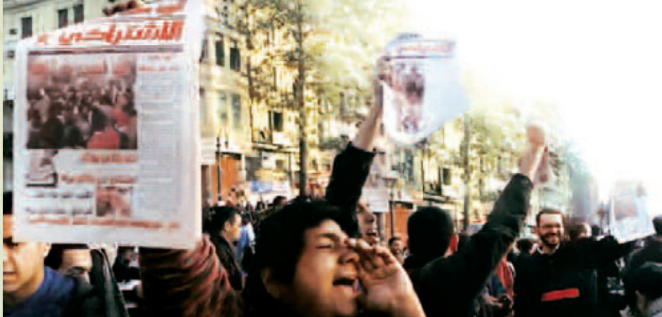
Οι Επαναστάτες Σοσιαλιστές πουλάνε την εφημερίδα τους στην πλατεία Ταχρίρ.

Το τρίτο ζήτημα είναι πως η πορεία των επαναστάσεων δεν καθορίζεται μόνο από τους εσωτερικούς της νόμους, αλλά εξελίσσεται μέσα σε ένα διεθνές περιβάλλον οικονομικής κρίσης το οποίο αντί να επι-