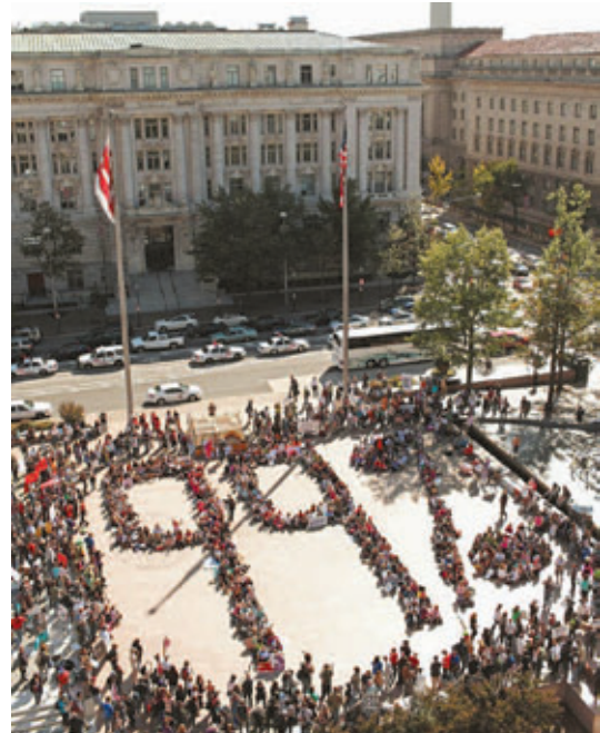
Το κίνημα «καταλάβετε την Γουόλ Στριτ» με ευρηματικό τρόπο προβάλλει το σύνθημα είμαστε το 99%

Μπροστά μας είναι η προοπτική αυτά τα καλά σημάδια να γενικευτούν. Σίγουρα το ΣΕΚ και η ΑΝΤΑΡΣΥΑ έχουν να παίξουν θετικό ρόλο προς αυτή την κατεύθυνση μαζί με όλο τον κόσμο της Αριστεράς που κατανοεί ότι η κατάκτηση της κοινής δράσης μπορεί να ανατρέψει όχι μόνο την συγκυβέρνηση αλλά και όλα τα σχέδια της ντόπιας και διεθνούς τρoίκας. Να ανοίξει το δρόμο για