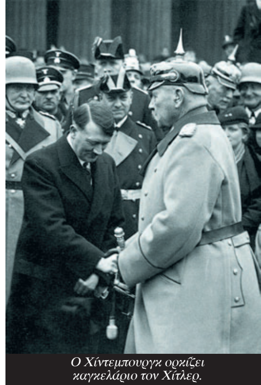
Ο Χίντεμπουργκ ορκίζει καγκελάριο τον Χίτλερ.

αγνοεί επιδεικτικά την επαναστατική πολιτική για την οποία πάλευε ο Τρότσκι: το ενιαίο εργατικό μέτωπο, την κοινή δράση ενάντια στο φασισμό. Μια ενεργητική πολιτική που θα κινητοποιούσε την οργανωμένη εργατική τάξη ενάντια στους ναζί, ενάντια στις επιπτώσεις της κρίσης, θα μπορούσε να αντιστρέψει την πορεία προς τον γκερέμο.