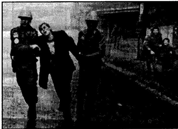
Οι δόμνες του NATO δεν θα σταματήσουν τη φρίκη

Γι' αυτό, αυτοί οι πόλεμοι είναι αντιδραστικοί απ' όλες τις μεριές. Κανένας απ' όλους αυτούς δεν έχει το δικό με το μέρος του, ώστε να τον υποστηρίξουμε γιατί κανενός η νίκη δεν θα σημαίνει μια δίκαιη ειρήνη. Ο,τι κι αν λένε στην προπαγάνδα τους κανένας δεν πολεμάει για την απελευθέρωση κάποιων καταπιεσμένων ή "για τα σπίτια μας". Ειδικά στη Βοσνία είναι τόσο φανερό ότι κάθε μία από τις τρεις πλευρές με κάθε νίκη της ξεσπύτωνα χιλιάδες πρόσφυγες για να πετύχει την εθνική εκκαθάριση των εδαφών που κέρδιζε, ώστε ο ισχυρισμός "πολεμάμε όλοι για τα