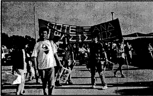
Από τη διαδήλωση ενάντια στο Λεπέν στην Κέρκυρα. Ιούνιος '93

κομμάτων - του Φιλελεύθερου Κόμματος, στην Ιταλία και του Εθνικού Λαϊκού Κόμματος και του Κόμματος του Κέντρου. Επιπλέον στηρίχτηκαν στη συνεργασία της αστυνομίας και του στρατού με τις συμμορίες των κομμάτων τους προκειμένου να συντρίψουν κάθε αντιπολίτευση.