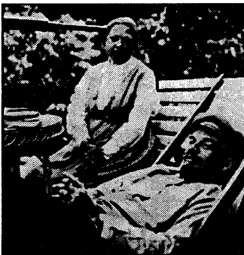
Ο Λένιν μαζί με την Κρούτσκαγια

Στο “Ιμπεριαλισμός το ανώτατο στάδιο του καπιταλισμού” ο Λένιν εξηγεί την υλική βάση των πολέμων και του εθνικισμού την περίοδο του Α’ Παγκόσμιου Πολέμου. Αντίθετα με την πλατιά διαδεδομένη αντί-