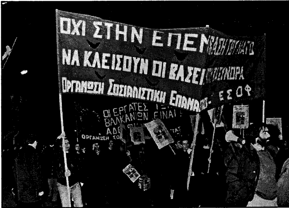
Από την αντιπολεμική διαδήλωση της ΕΦΕΕ στις 17 Φλεβάρη

κτῆρα επίδειξης δύναμης και γι' αυτό περιέχουν πάντα το στοιχείο των δικών τους αντιθέσεων για το ποια απ' όλες έχει το πάνω χέρι σ' αυτό το ρόλο.