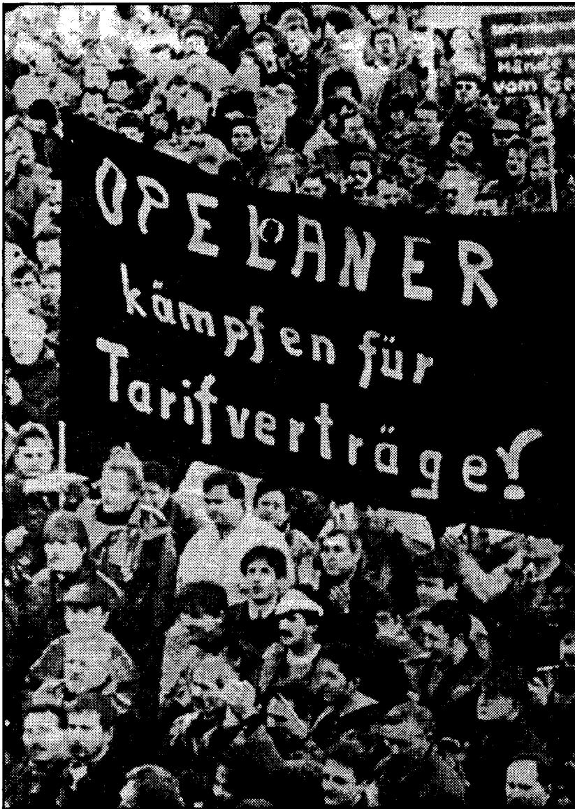
Απεργία στο εργοστάσιο της ΟΠΕΛ στη Γερμανία

Η απόφαση για την οικονομική και νομισματική Ενοποίηση της Ευρώπης ήταν από μόνη της γεμάτη αντιφάσεις. Η διεθνοποίηση των τραπεζών και των επιχειρήσεων πίεζε για ένα ενιαίο νόμισμα μέσα στην ΕΟΚ. Το κοινό νόμισμα είχε δύο βασικούς στόχους: από τη μια την κατάργηση του κόστους που συνεπάγεται η μετατροπή των νομισμάτων από το ένα στο άλλο, και από την άλλη τον έλεγχο της αβεβαιότητας. Οι καπιταλιστές ήθελαν να γνωρίζουν εκ των προτέρων σε τι τιμή θα αγόραζαν και θα πουλούσαν στη διεθνή αγορά. Μεταβατικά, το Ευρωπαϊκό Νομισματικό Σύστημα (ΕΝΣ) είχε τη δυνατότητα να επεμβαίνει και να εμποδίζει τυχόν υποτιμήσεις που μπορούσε να αποφασίσει το κάθε κράτος μέλος χωριστά.