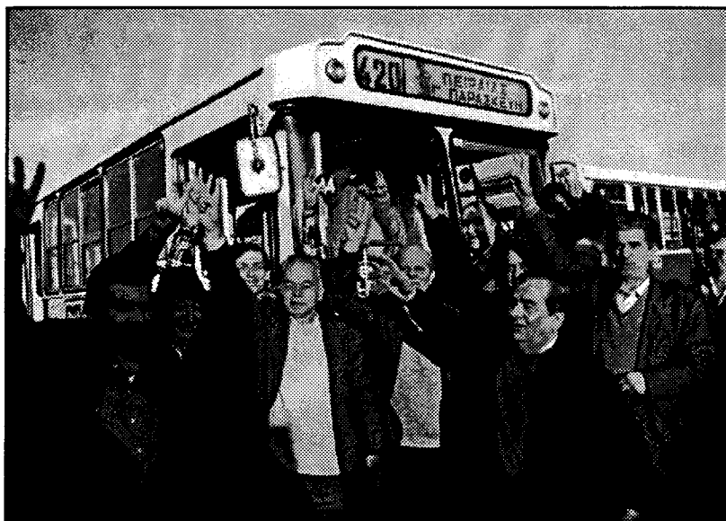
23 Δεκέμβρη. Το πρώτο λεωφορείο βγαίνει από το αμαξοστάσιο της Πέτρου Ράλλη

γωνιστές της Εργατικής Αλληλεγγύης δεν περιγράφεται με λόγια. Ήταν οι άνθρωποι που απαρνήθηκαν και τον ίδιο τους τον εαυτό για να μπορέσουν να δώσουν μια σωστή εικόνα στους εργαζόμενους και μια δύναμη περισσότερη απ' αυτή που είχαν για να μπορέσουν να παλέψουν. Είναι άνθρωποι που είχαν και αυτοί τη δουλειά τους, αλλά υπεράνω όλων έβαζαν τον αγώνα της εργατικής τάξης. Εδώσαν πολλά και το αναγνωρίζουν όλοι οι εργαζόμενοι της ΕΑΣ. Αυτό τον αγώνα που δώσανε αυτοί οι άνθρωποι τον αναγνωρίζουμε. Ξέρουμε ότι όσο υπάρχει αυτή η οργάνωση πάνω στη γη αποκλείεται να γυρίσει την πλάτη σε κανένα πρόβλημα της εργατικής τάξης. Εδινε και θα δίνει το παρών. Η ΟΣΕ ενδιαφέρεται για τις ανάγκες των εργαζομένων, για τις νίκες των αγώνων τους. Γι' αυτό πρέπει να πλαισιωθεί αυτή η οργάνωση.