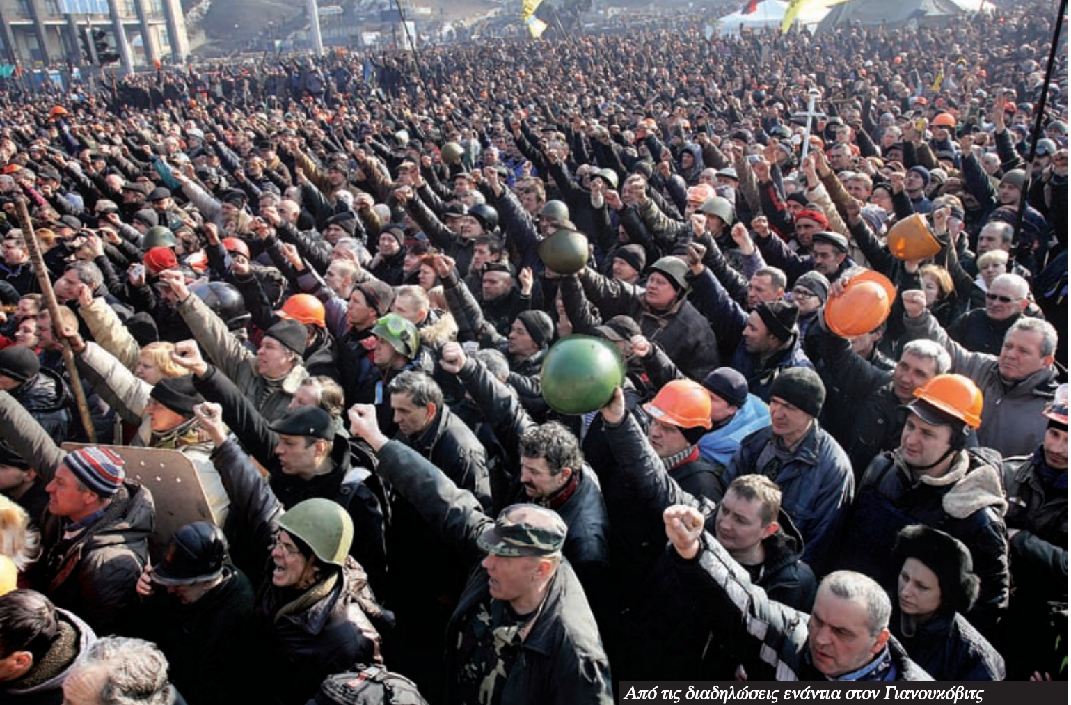
Από τις διαδηλώσεις ενάντια στον Γιανουκόβιτς