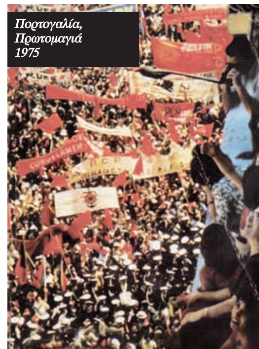
Πορτογαλία, Πραξικοπήμα 1975

Στις 11 Μάρτη του 1975 η απόπειρα πραξικοπήματος ήταν ακόμη πιο προετοιμασμένη. Δεξιοί αξιωματικοί κατέλαβαν στρατιωτικές βάσεις και βομβαρδίστηκαν θέσεις της αριστερής πτέρυγας του MFA. Η εργατική τάξη έδωσε ξανά την απάντηση: “Οι εργάτες του Ράδιο Ρενασέנסα (...) μετέδωσαν τα νέα. Στη Λισαβόνα οι εργάτες έκλεισαν τις τράπεζες και εμπόδισαν κάθε είσοδο. Τα μαγαζιά και τα γραφεία έκλεισαν το μεσημέρι και τα τηλέφωνα τέθηκαν εκτός λειτουργίας καθώς οι εργάτες έτρεξαν να συμμετάσχουν στις διαδηλώσεις και τα οδοφράγματα. Στο Μπαρέιρο, βιομηχανικό κέντρο νότια της Λισαβόνας, οι σειρήνες των εργοστασίων και της πυροσβεστικής δεν σταμάτησαν να ουρλιάζουν καθώς οι εργάτες έκαναν φρουρές και οδοφράγματα που σταματούσαν και