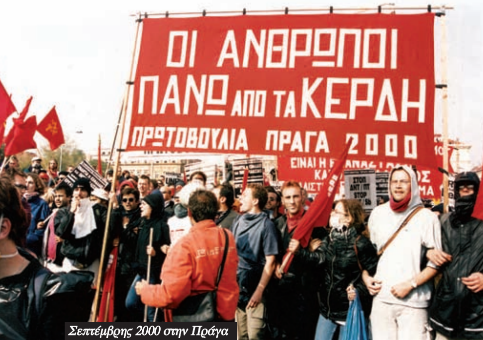
Σεπτέμβρης 2000 στην Πράγα

πρέπει να είναι αντινεοφιλελεύθερη ή αντικαπιταλιστική. Ο ΣΥΡΙΖΑ υποστήριξε από τότε ότι ο νεοφιλελευθερισμός ήταν η αιτία της κρίσης και ότι το κίνημα χρειαζόταν μια αντινεοφιλελεύθερη στρατηγική. Αυτές οι δυο μάχες – εάν η εργατική τάξη είναι το υποκείμενο και εάν η προοπτική πρέπει να είναι αντικαπιταλιστική – ήταν καθοριστικές για τη δημιουργία της ANΤΑΡΣΥΑ και το ρόλο που έπαιξε από το 2009 μέχρι σήμερα.