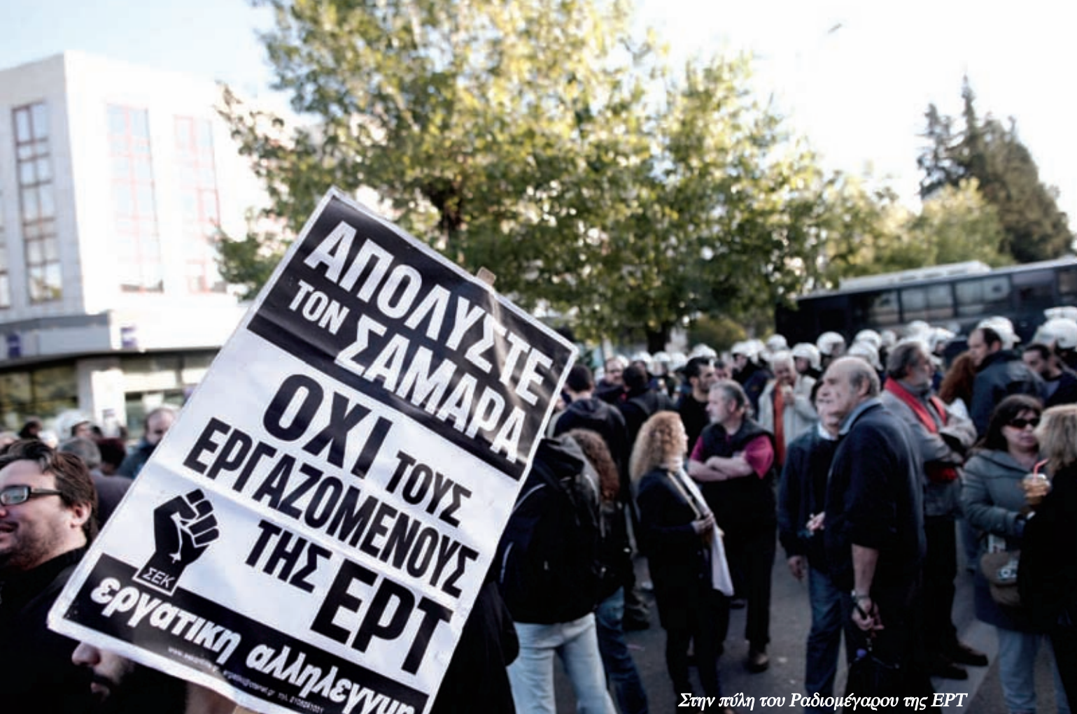
Στην πύλη του Ραδιομέγαρου της ΕΡΤ