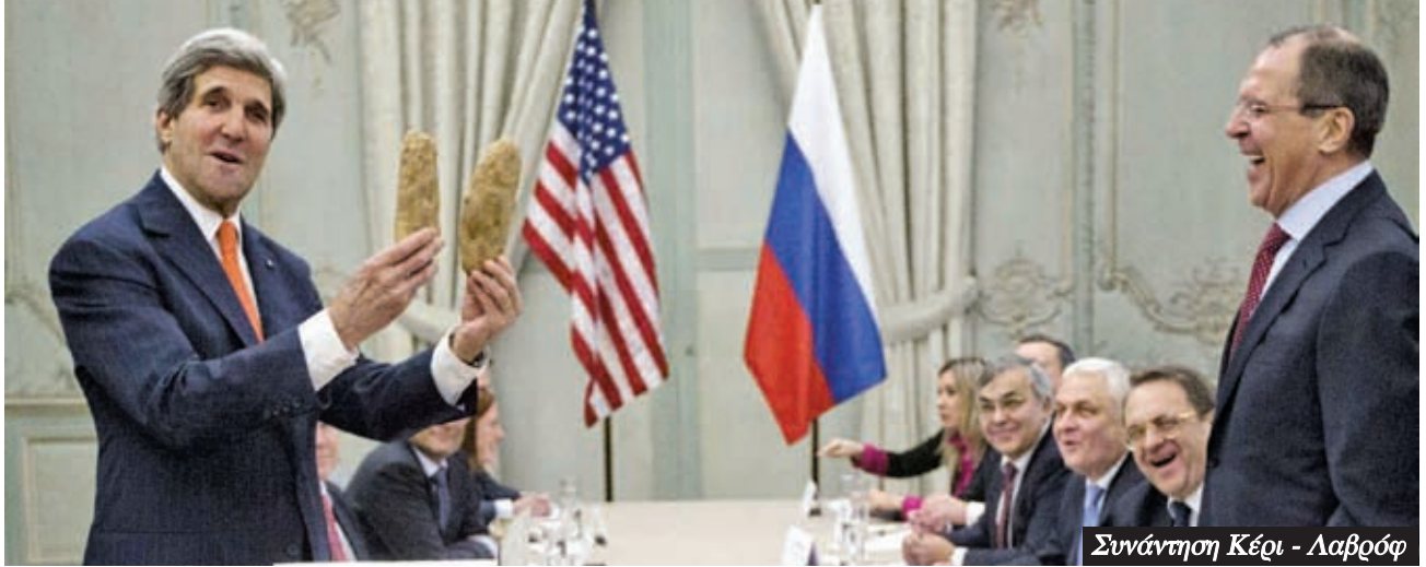
Συνάντηση Κέρι - Λαβρόφ

Σήμερα η Μόσχα είναι η «προτεύουσα» των δισεκατομμυριούχων παγκοσμίως, μπροστά κι από τη Νέα Υόρκη (84 με περιουσία 366 δις δολαρίων έναντι 62 με 280 δις δολάρια). 7 Αυτοί όμως δεν θα υπήρχαν χωρίς τους γίγαντες της βιομηχανίας που είχαν χτιστεί επί κρατικού καπιταλισμού και έμειναν στα χέρια των «σοβιετικών» διευθυντών και «τεχνοκρατών» που τις διαχειρίζονταν.