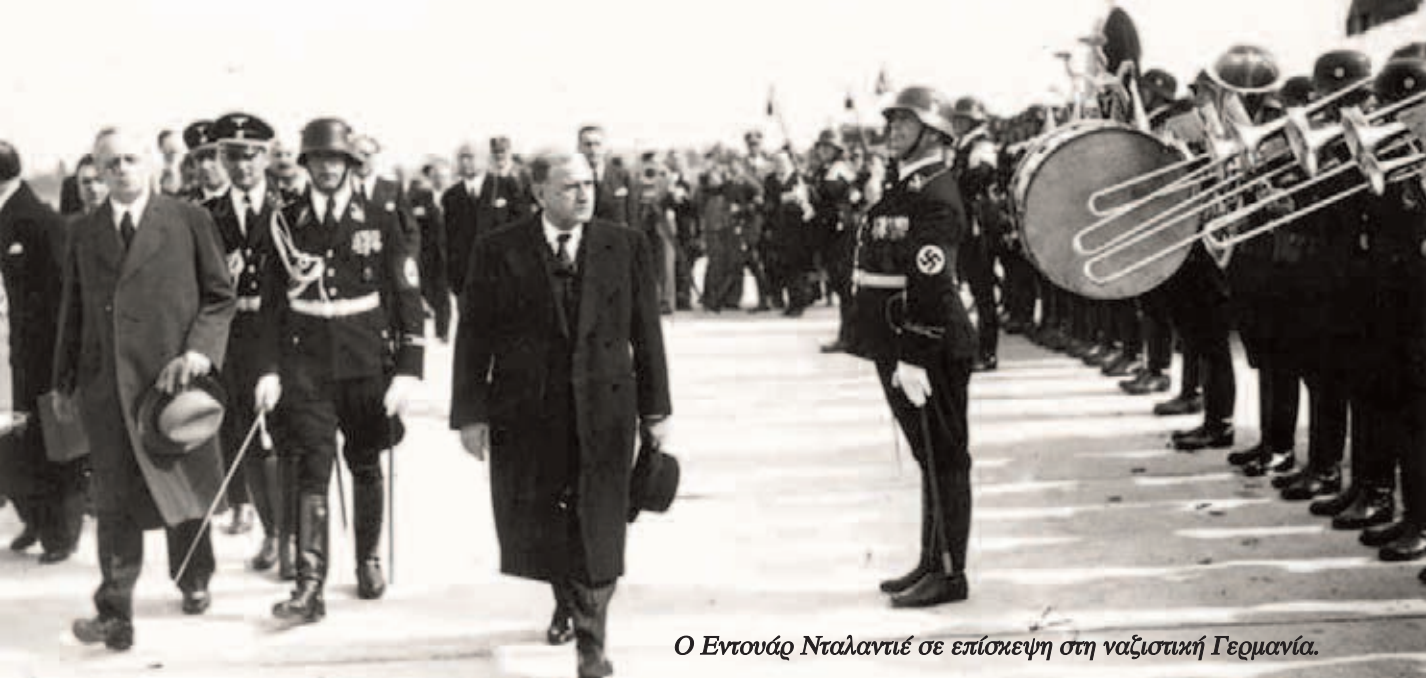
Ο Εντουάρ Νταλαντιέ σε επίσκεψη στη ναζιστική Γερμανία.

τας» της γαλλικής οικονομίας, προχώρησε σε υποτίμηση του φράγκου κατά 25% και ο πληθωρισμός ανέβηκε κατά 50% μέχρι τα τέλη του 1937.