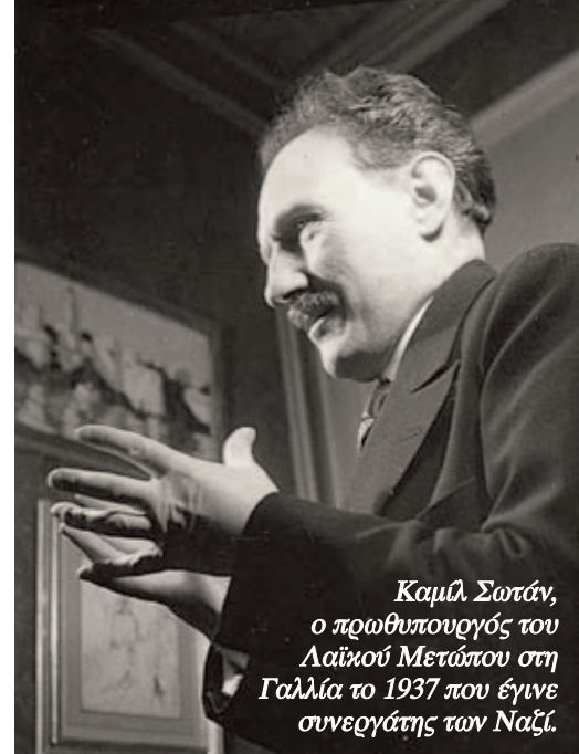
Καμίλ Σωτάν, ο πρωθυπουργός του Λαϊκού Μετώπου στη Γαλλία το 1937 που έγινε συνεργάτης των Ναζί.

Η στρατηγική της εξόδου από την κρίση μέσα από την κατάκτηση μιας κυβέρνησης της Αριστεράς δεν είναι νέα