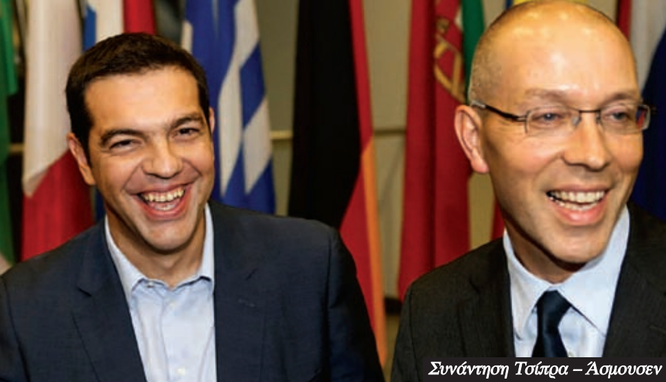
Συνάντηση Τσίπρα – Άσμουσεν

γοντα με ανοιχτά ρατσιστικές απόψεις. Η επιλογή ακυρώθηκε μετά τις αντιδράσεις και θα μπορούσε ίσως να πει κανείς ότι ήταν ένα απομονωμένο περιστατικό.