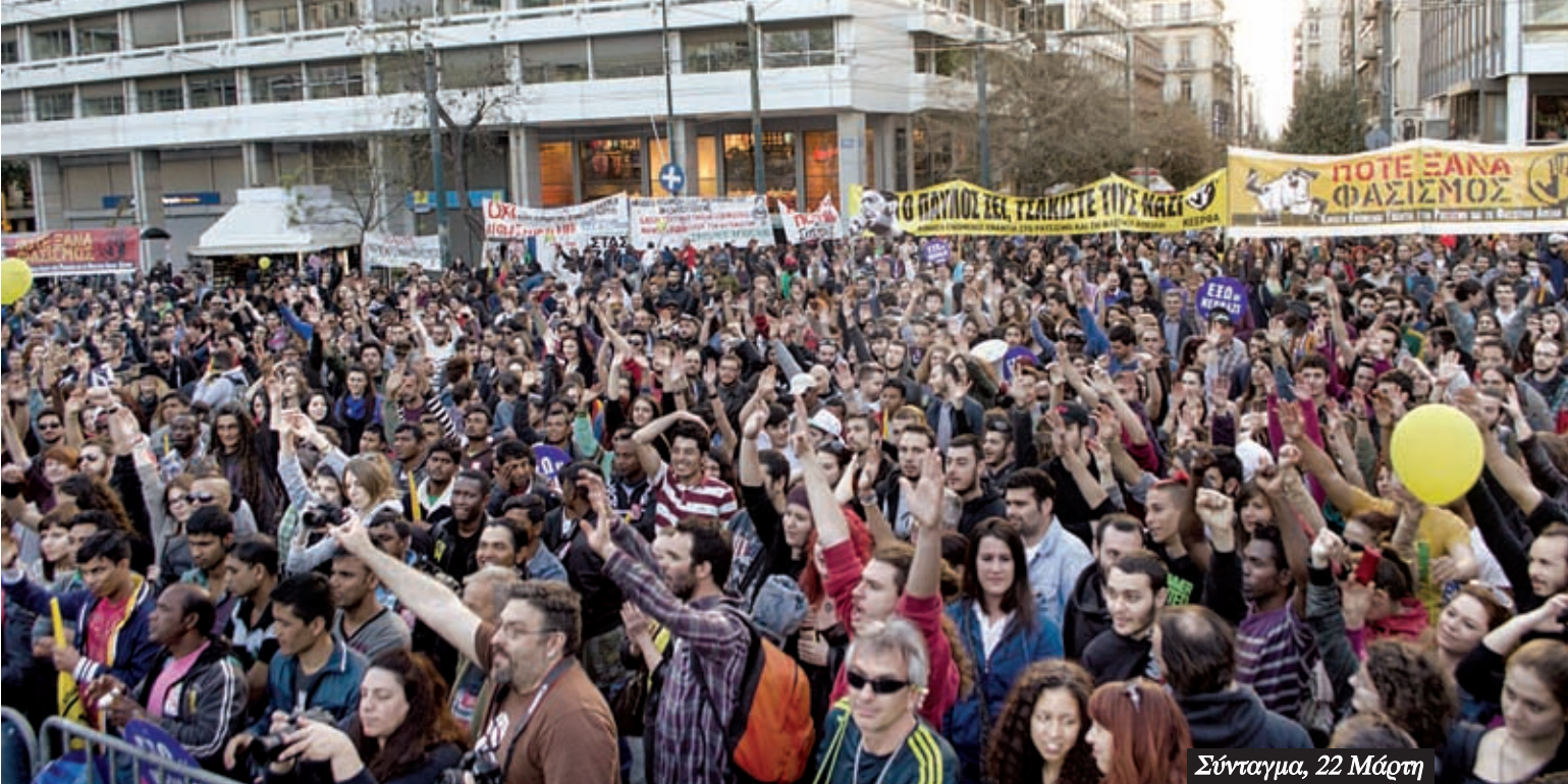
Σύνταγμα, 22 Μάρτη