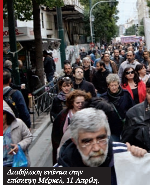
Διαδήλωση ενάντια στην επίσκεψη Μέρκελ, 11 Απριλίου.

Κατ' αρχάς είναι τεράστιο ψέμα ότι πρόκειται για άχρηστες υπηρεσίες. Ο ΕΟΠΥΥ που έκλεισε, είναι η βασική πρωτοβάθμια περίθαλψη για εκατομμύρια εργαζόμενους και συνταξιούχους. Η επαγγελματική εκπαίδευση που ρημάχτηκε, είναι τα σχολεία των παιδιών από τις φτωχότερες οικογένειες. Ο ΟΑΕΔ και οι υπηρεσίες του υπ. Εργασίας που υπολειπούνται, τυπικά είναι αυτές