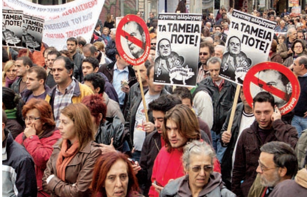
Πανεργατική ενάντια στο ασφαλιστικό νομοσχέδιο το χειμώνα 2007 - 2008.

Όποια κόμματα ή οργανώσεις της αριστεράς δεν κατάφεραν να καταλάβουν τη σημασία αυτού του κύματος, έμειναν έξω από ένα καινούριο κίνημα που έπαιξε σημαντικό ρόλο στη ριζοσπαστικοποίηση που βλέπουμε σήμερα. Το ότι το ΣΕΚ πήρε την πρωτοβουλία μαζί με άλλους αγωνιστές να δημιουργήσουν την κίνηση ENANTIA που στη συνέχεια έπαιξε ρόλο στη δημιουργία της ANΤΑΡΣΥΑ, έχει τις ρίζες του σε εκείνη την περίοδο, στα μεγάλα αντιπολεμικά συλλαλητήρια και στο σύνθημα «Οι άνθρωποι πάνω από τα κέρδη».