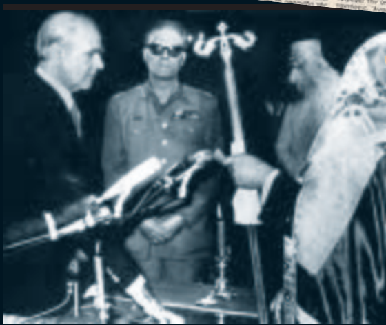
Γκιζίκης και Σεραφεΐμ, ορκίζουν τον Καραμανλή.