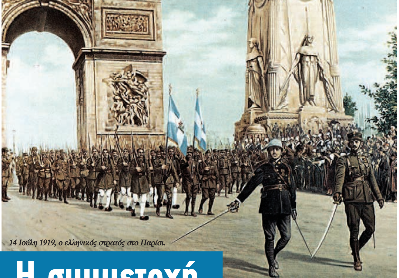
14 Ιούλη 1919, ο ελληνικός στρατός στο Παρίσι.