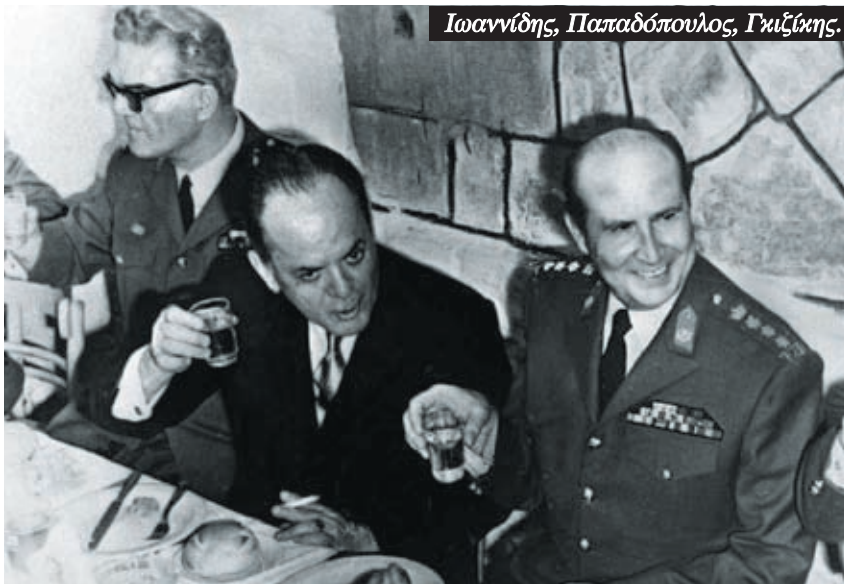
Ιωαννίδης, Παπαδόπουλος, Γκιζινης.

Κάτι τέτοιο νόμιζε η Χούντα του Ιωαννίδη ότι θα συμβεί και το 1974. Όμως η κατάσταση τής ξέφυγε από δύο πλευρές. Από τη μια μεριά οι Κύπριοι αντιστάθηκαν στο πραξικόπημα. Δεν ήταν διατεθειμένοι να αποδεχθούν ως δεδομένη μια Χούντα ακροδεξιών δολοφόνων απλώς επειδή έτσι ήθελε η Αθήνα. Ταυτόχρονα στην Ελλάδα, όταν κηρύχθηκε η επιστράτευση η οποία έμεινε στην ιστορία ως “επιστράτευση της σα-