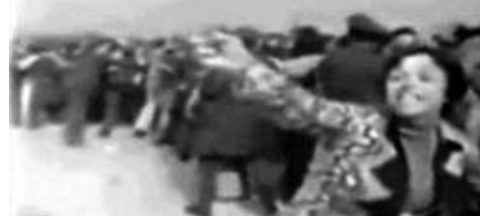
1975. Απεργία της ΙΤΤ Hellas.