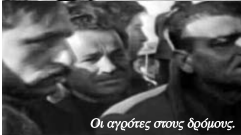
Οι αγρότες στους δρόμους.