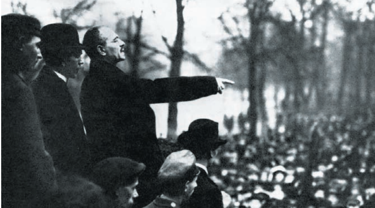
Ο Λήμπνεχτ μιλάει σε συγκέντρωση έξω από τη γερμανική Βουλή μετά την πτώση του Κάιζερ.

ήταν η εμφάνιση του αντιπολεμικού κινήματος στην εργατική τάξη. Την Πρωτομαγιά του 1916 έγιναν διαδηλώσεις σε πολλές πόλεις της Ευρώπης ενάντια στις αυξανόμενες στερήσεις και βάσανα που φόρτωνε η «εθνική πολεμική προσπάθεια» στις πλάτες των εργατών και των εργατριών. Δέκα χιλιάδες συμμετείχαν στο Βερολίνο. Ο επιστρατευμένος Λήμπνεχτ με τη στολή του φαντάρου μίλησε στην συγκέντρωση προβάλλοντας το σύνθημα «Κάτω ο Πόλεμος! Κάτω η Κυβέρνηση!». Διαδηλώσεις και μικρές απεργίες έγιναν σε πολλές πόλεις της Γερμανίας εκείνο το καλοκαίρι.