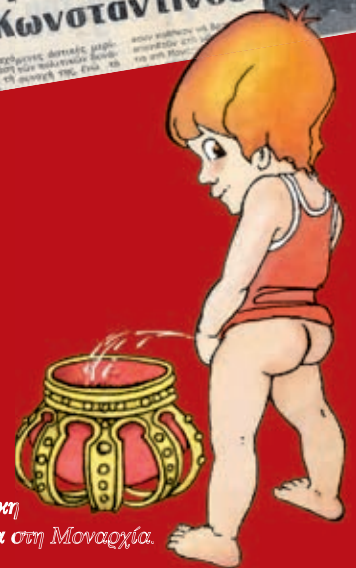
Σκίτσο του Σπύρου Οργερόνη για το δημοψήφισμα ενάντια στη Μοναρχία.