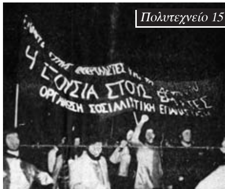
Πολυτεχνείο 15 Νοέμβρη 1974.