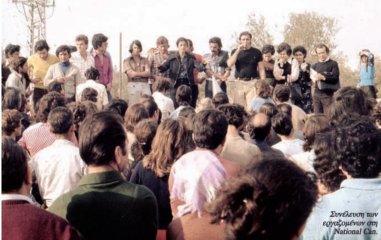
Συνέλευση των εργαζομένων στη National Cap.

τάξη. Τα μεγάλα εργοστάσια γίνονται τα κάστρα του απεργιακού αγώνα: Βιάμαξ, Βιοχάλκο, Ναυπηγεία, ορυχεία, Πίτσος, Εσκιμό, Τριαντέξ, Φούλγκορ, Βιοχρόμι, ΕΤΜΑ, Λαδόπουλος, ΜΕΛ, Ιζόλα, Τρικοπλί...». 3