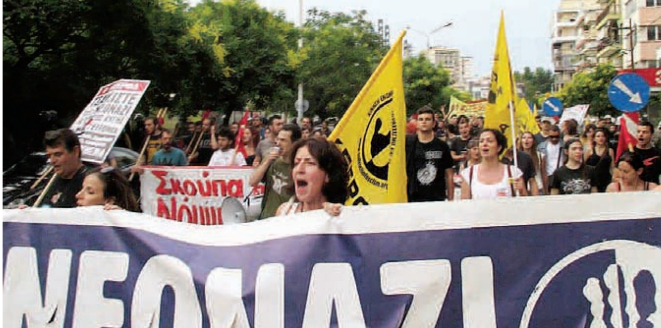
Αντιφασιστικό συλλαλητήριο στη Θεσσαλονίκη, 15 Ιούνη.

λολιάκου συνοδεύτηκε από πολεμικά κείμενα εσωκομματικής υποστήριξης του από τη “νεολαία” της οργάνωσης. 4