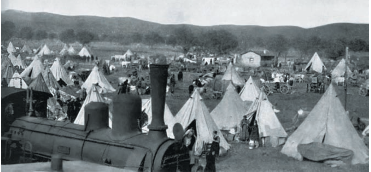
Πρόσφυγες από τη Μικρά Ασία στον Έβρο.

ψη της εξουσίας από τους βενιζελικούς τον Ιούνιο του 1917.