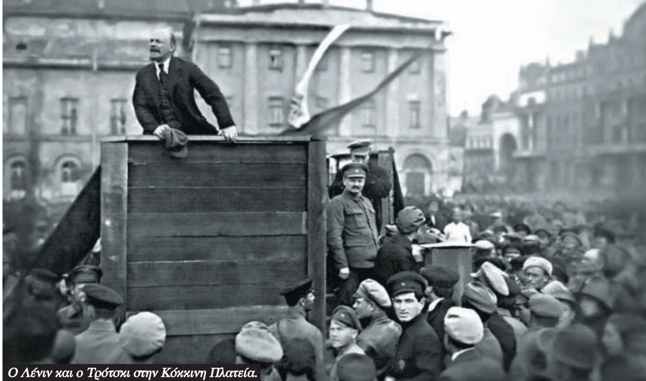
Ο Λένιν και ο Τρότσκι στην Κόκκινη Πλατεία.

για τη Μαζική Απεργία και είχε συγχρουστεί από το 1910 με τον Κάουτσκι για μια σειρά ζητήματα. 9 Σε όλες αυτές τις κόντρες ο Λένιν είχε πάρει το μέρος του Κάουτσκι.