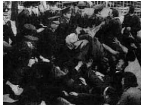
1975. Επίθεση στους απεργούς της Πίτσος.

Οι εκλογές για τον Καραμανλή θα έπαιζαν το ρόλο της κατοχύρωσης. Το σύνθημα «Καραμανλής ή τάνκς» έπρεπε να κατοχυρωθεί με ένα μεγάλο ποσοστό στις εκλογές κι αυτές έπρεπε να γίνουν γρήγορα. Όσο αργούσαν, η κατάσταση γινόταν ανεξέλεγκτη. Διάλεξε να κάνει εκλογές στις 17 Νοέμβρη του 1974, ένα χρόνο μετά την εξέγερση του Πολυτεχνείου. Ήταν μια απόφαση πρόκληση, που τα κόμματα της Αριστεράς, το ΚΚΕ και το ΚΚΕ εσωτ. την αποδέχθηκαν και έτσι έμεινε η επαναστατική αριστερά να την κοντράρει. Δημιουργήθηκαν επιτροπές αγώνα για τον εορτασμό του Πολυτεχνείου στις 17 Νοέμβρη, την ημέρα που ο Καραμανλής είχε προκηρύξει τις εκλογές, και είχε αναβάλει τον εορτασμό για μια βδομάδα αργότερα, στις 22-24 Νοέμβρη.