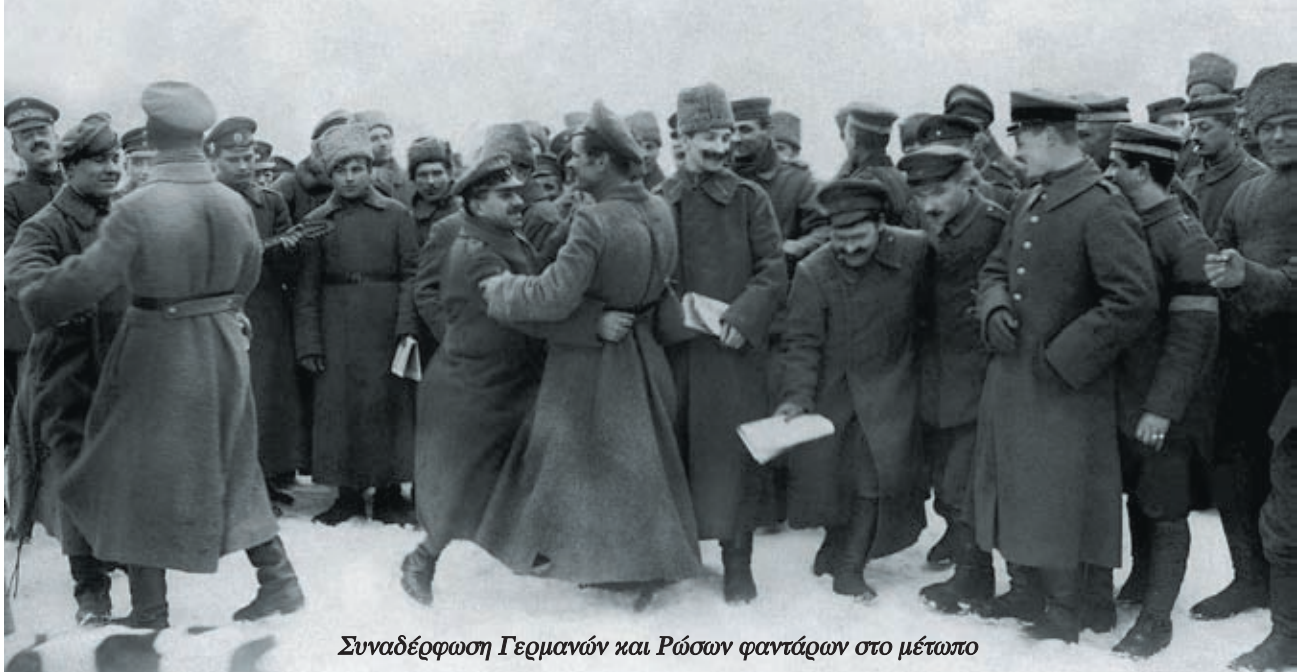
Συναδέρφωση Γερμανών και Ρώσων φαντάρων στο μέτωπο

προπαγάνδα για τα ίδια τα αίτια του πολέμου: για όλα τα εμπόλεμα έθνη ο δικός τους πόλεμος ήταν και δίκαιος και αμυντικός. Οι Γερμανοί πολεμούσαν ενάντια στον Ρώσικο απολυταρχισμό. Οι Άγγλοι για να στηρίξουν το "κακόμοιρο το Βέλγιο". Οι Γάλλοι ενάντια στον γερμανικό μιλιταρισμό.