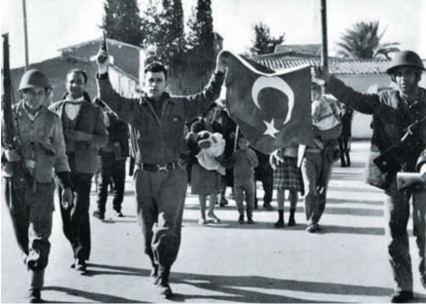
1964, ο Σαμψών οργανώνει το πογκρόμ στην Ομορφίτα. Πίσω του, Τούρκοι αιχμάλωτοι.

γιονάρας” αποκαλύφθηκε ότι ο έλεγχος που είχε η Χούντα πάνω στον κόσμο ήταν μηδαμινός. Η εξέγερση του Πολυτεχνείου είχε κατασταλεί οχτώ μήνες νωρίτερα και οι “σκληροί” του Ιωαννίδη είχαν πάρει την εξουσία κάνοντας πραξικόπημα κατά του Παπαδόπουλου. Αντίθετα όμως με την εικόνα του “δεν κουνιέται φύλλο”, ο νέος άνθρωποι που καλούνταν στα κέντρα κατάταξης και τα Φρουραρχεία δεν ήταν διατεθειμένοι να σκοτωθούν για τους δολοφόνους τους. Η επιστράτευση κατέληξε σε φιάσκο. Η εικόνα χιλιάδων συγκεντρωμένων επιστρατευμένων φαντάρων δεν μοιάζει καθόλου με πατριωτικό κάλεσμα στα όπλα, αλλά με ένα μαζικό κράξιμο στη Χούντα, το μίσος για τους συνταγματάρχες ξεχειλίζει και οι δικτάτορες μυρίζονται απειλή.