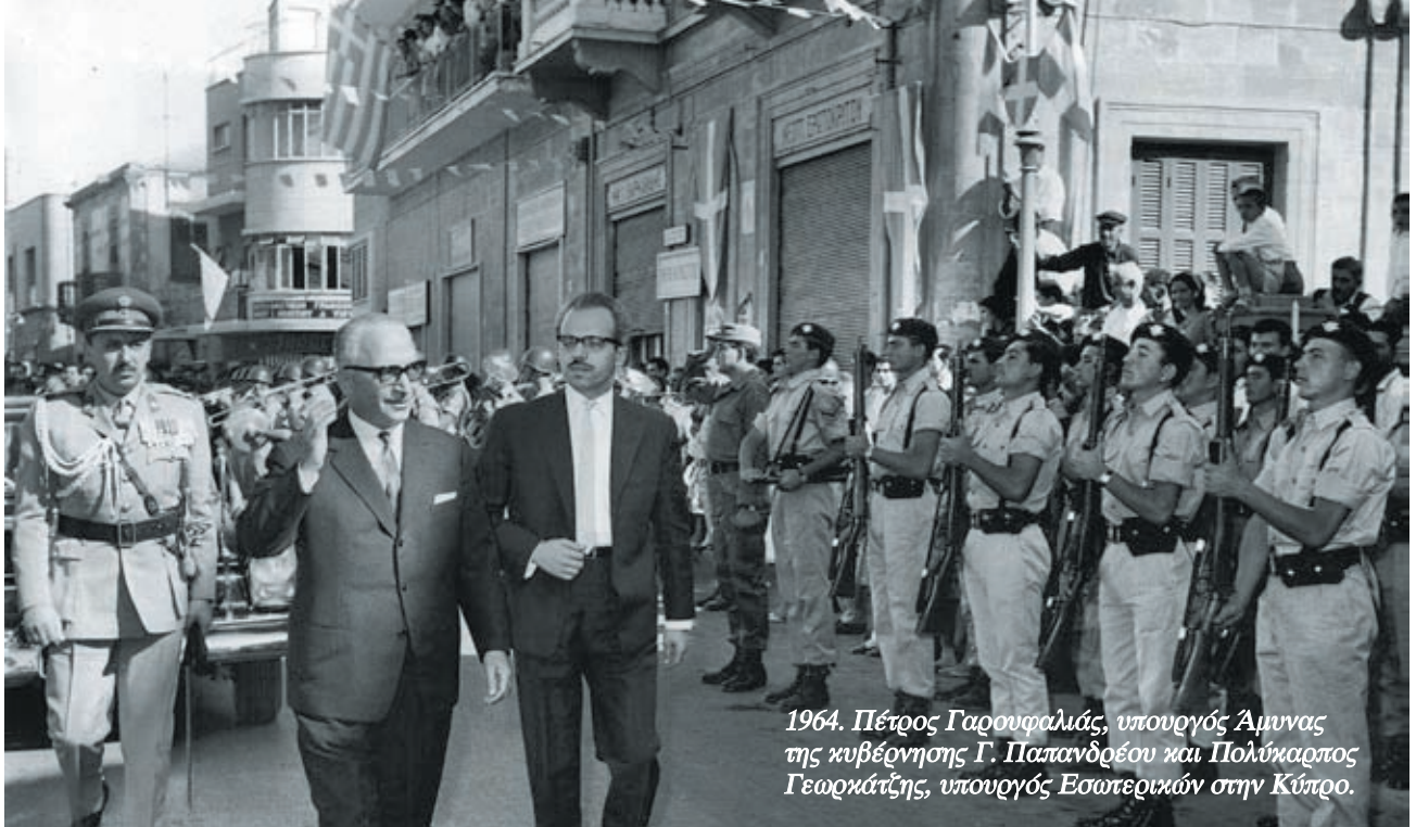
1964. Πέτρος Γαρουφαλιάς, υπουργός Άμυνας της κυβέρνησης Γ. Παπανδρέου και Πολύκαρπος Γεωργιάτζης, υπουργός Εσωτερικών στην Κύπρο.

του του βρόμιου κυκλώματος. Είχε βρεθεί να υπηρετεί στην Ελληνική Δύναμη Κύπρου (ΕΛΔΥΚ) το '63 και '64, αλλά δεν έμεινε μέχρι εκεί. Όπως γράφει ο Μακάριος Δρουσιώτης: “Μέχρι σήμερα επικρατεί σε πολλούς η εντύπωση ότι αποστολή της μεραρχίας ήταν η άμυνα της Κύπρου σε περίπτωση εισβολής. Η έρευνα απέδειξε ότι η μεραρχία έφτασε με την έγκριση των ΗΠΑ και την ανοχή της Τουρκίας για να ελέγξει την εσωτερική κατάσταση, σε σχέση με την ελληνοκυπριακή κοινότητα. Τόσο στην ΕΛΔΥΚ όσο και στη μεραρχία υπηρέτησε διαδοχικά όλη η αφρόκριμα της ελληνικής χούντας.