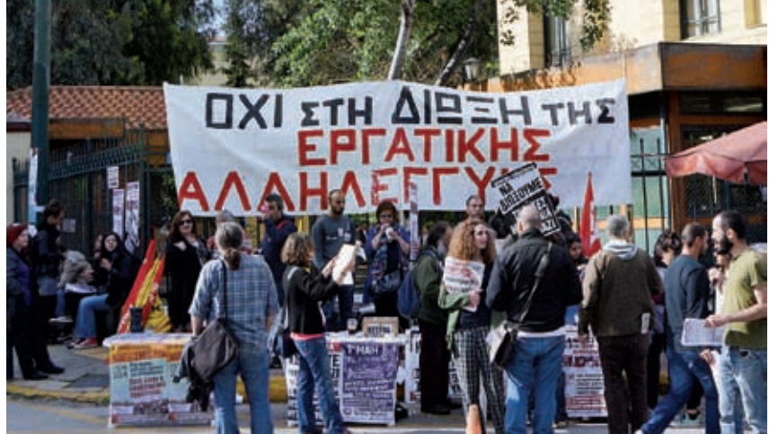
12 Ιούνη, Ευελπίδων. Το δικαστήριο έβγαλε αθωωτική απόφαση.

Η επιτυχία της Χρυσής Αυγής δεν θα κριθεί μόνο στη δυνατότητά της να μετατοπίζει προς τα δεξιά τον ιδεολογικό μέσο όρο των ψηφοφόρων της, μετατρέποντάς τους από “αγανακτισμένους” σε “φασίστες”. Αυτό βεβαίως χρειάζεται να το κάνει, και το γεγονός ότι διαθέτει πλέον ένα κομμάτι που τη στήριξε τον Μάη-Ιούνη του 2012 και την ξαναψήφισε εν γνώσει της δολοφονίας Φύσσα είναι ένα πλεονέκτημα σε σχέση με το παρελθόν. Το παιχνίδι ωστόσο θα κριθεί στο κατά πόσο θα κατορθώσει να μετατρέψει ένα τμήμα από τους παθητικούς ψηφοφόρους σε οργανωμένη δύναμη στις γειτονιές και τους δρόμους. Το αντιφασιστικό κίνημα έχει να παλέψει βήμα βήμα ενάντια στη συγκρότηση αυτής της αντιδραστικής δύναμης: σπάζοντας τα μειοψηφικά κομμάτια των εργαζόμενων και των ανέργων που μπορεί να ψήφισαν Χρυσή Αυγή, εξουδετερώνοντας τη διάθεση μικροαστικών στρωμάτων να χτίσουν τάγματα εφόδου με την αντιπαράθεση ενός μαζικού κινήματος που θα ελέγχει τους δρόμους και,