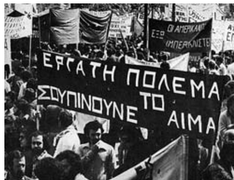
Εργατική διαδήλωση στη Μεταπολίτευση.

Στην πρώτη επέτειο, η γιορτή του Πολυτεχνείου κράτησε 13 μέρες, από τις 12 έως τις 25 Νοέμβρη. Η προκήρυξη που έβγαλαν οι επιτροπές αγώνα για τον εορτασμό του Πολυτεχνείου πριν τις