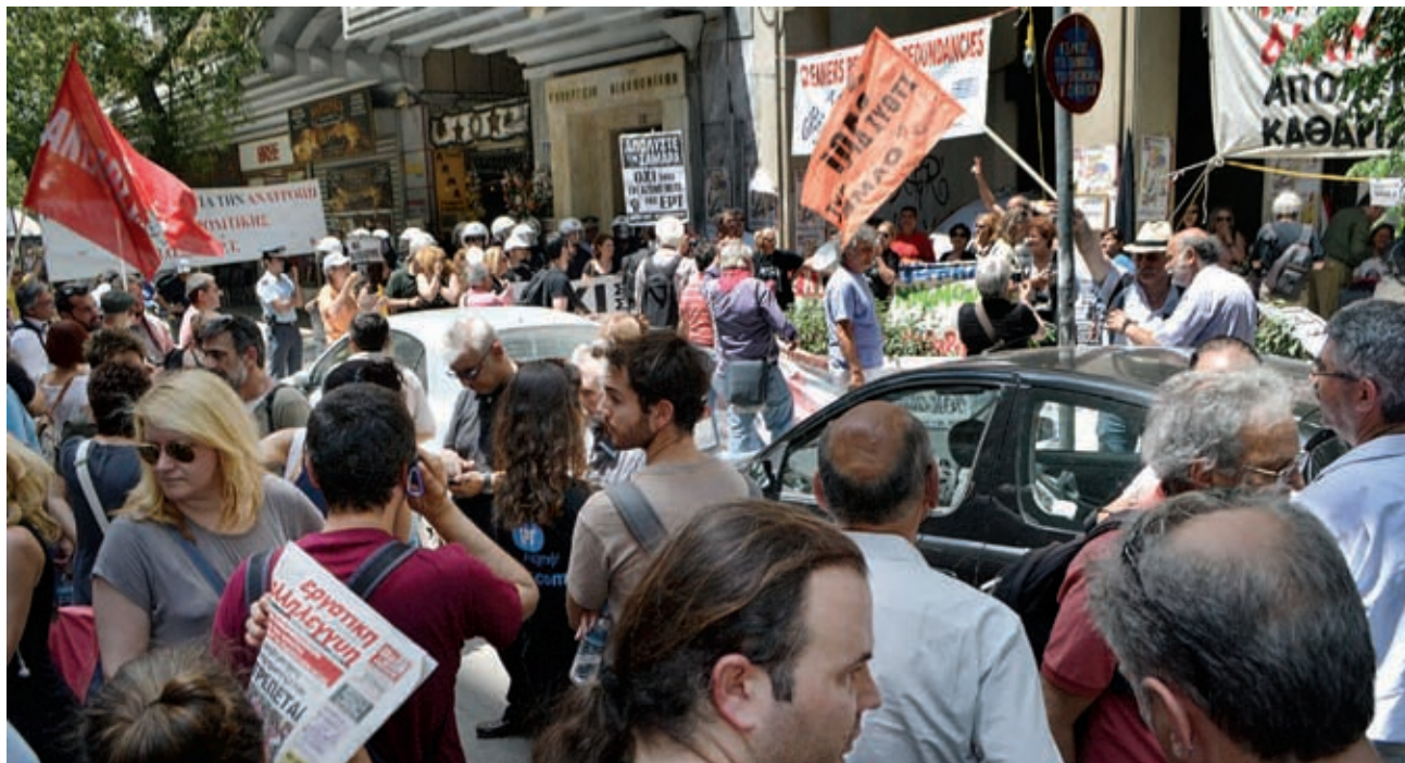
11 Ιούνη. Η πορεία καταλήγει μπροστά στην κατάληψη των καθαριστριών του υπ. Οικονομικών.

λιάδες συγκεντρώθηκαν έξω από το Ραδιομέγαρο και την ΕΡΤορεν. Αυτός ο συντονισμός προγραμματίζε να συνεδριάσει ξανά στις 16 Ιούνη, ενώ το Συντονιστικό των Νοσοκομείων ετοίμαζε την απεργία στις 18 Ιούνη.