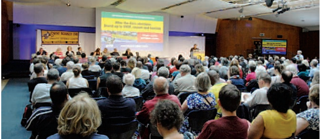
14 Ιούνη, Λονδίνο. Η εθνική Συνδιάσκεψη της Κίνησης “Ενωμένοι Ενάντια στο Φασισμό”.