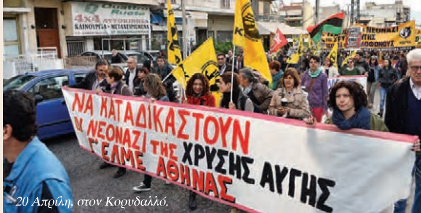
20 Απριλίου, στον Κορυδαλλό.

Μήπως στη δίκη για τη δολοφονία του Γρηγόρη Λαμπράκη είχαμε άλλη εξέλιξη; Συνήθως κάποιου τονίζουν την θαυραλέα στάση του τότε ανακριτή Χρήστου Σαρτζετάκη, ο οποίος δεν δίστασε