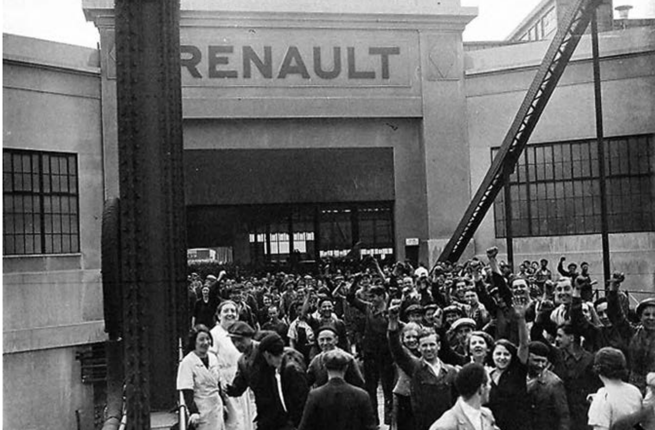
Γαλλία 1936, απεργιακή φρουρά στη Ρενό.

αναφορά σε «μεταβατικά αιτήματα» και «προγράμματα». Κι αυτή η προσπάθεια ήταν αξεχώριστη με την πολιτική του ενιαίου μετώπου που διαμορφωνόταν το ίδιο διάστημα. Τα νεαρά κομμουνιστικά κόμματα βρίσκονταν μπροστά στην πρόκληση της χάραξης μιας ενεργητικής πολιτικής που θα κέρδιζε, μέσα από τη δράση κι όχι τις εκκλήσεις, στο επαναστατικό στρατόπεδο τα κομμάτια της εργατικής τάξης που ακολουθούσαν τα ρεφορμιστικά κόμματα.