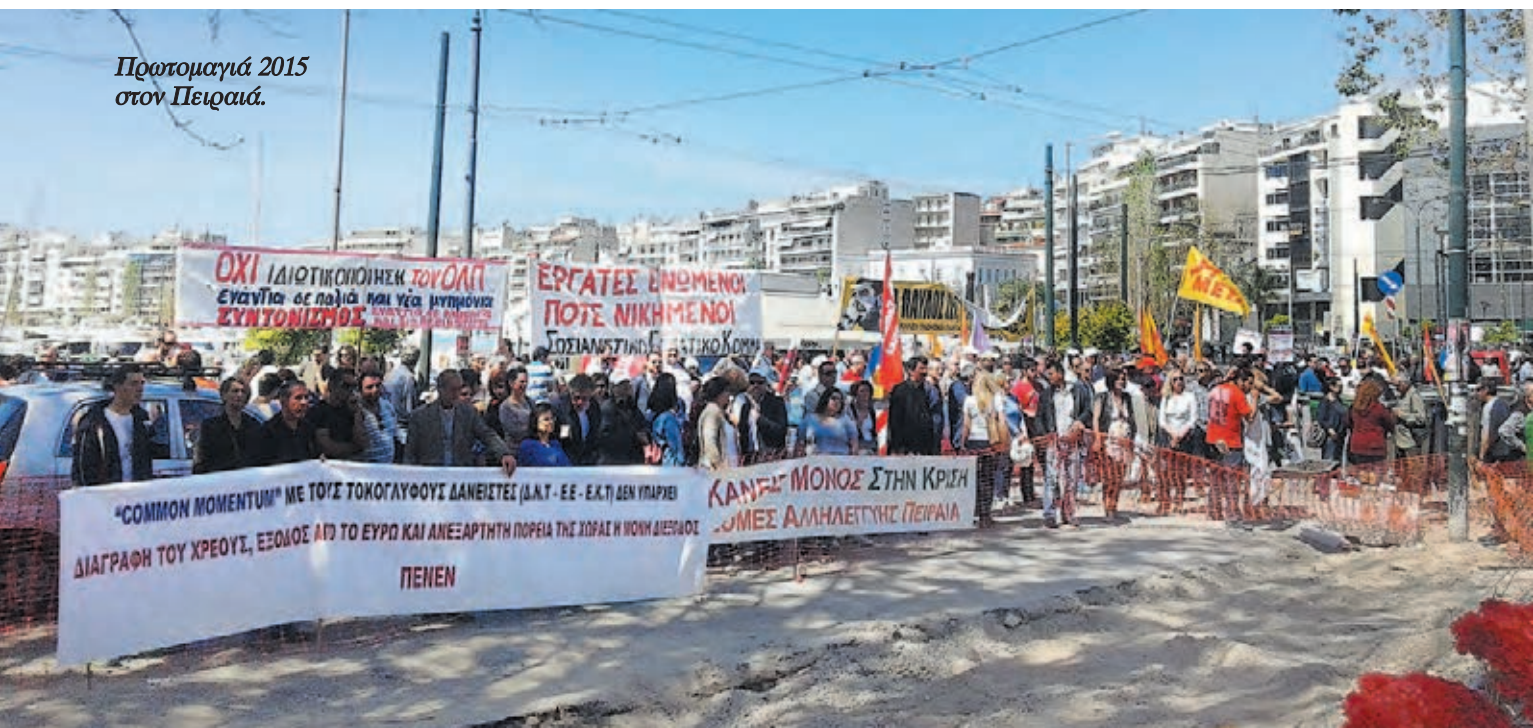
Πρωτομαγιά 2015 στον Πειραιά.

Οι συνέπειες της ρεφορμιστικής αποδοχής της «συνέχειας του κράτους» φαίνονται καθοριστικά στο εσωτερικό. Η νίκη της Αριστεράς στις εκλογές εξασφαλίζει μόνο μια πλειοψηφία στη Βουλή και την είσοδο στελεχών της στην κορυφή κάποιων υπουργείων. Όλα τα μη εκλεγμένα όργανα του κράτους και της οικονομίας παραμένουν έξω από τον έλεγχό της. Αυτά είναι πολύ περισσότερα και πιο σημαντικά από τα εκλεγμέ-