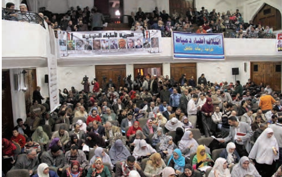
11 Φλεβάρη 2014. Συνέλευση απεργών γιατρών στο Κάιρο.

Μια άλλη ιστορία είναι η Καμπάνια για ένα Δίκαιο Εργασιακό Νόμο. Το καθεστώς θέλει να προωθήσει ένα νέο νόμο για να επιβάλει τον έλεγχο του πάνω στο εργατικό κίνημα. Ενάντια σ' αυτό έχει συσταθεί μια πρωτοβουλία στην οποία συμμετέχουν πολλοί συνδικαλι-