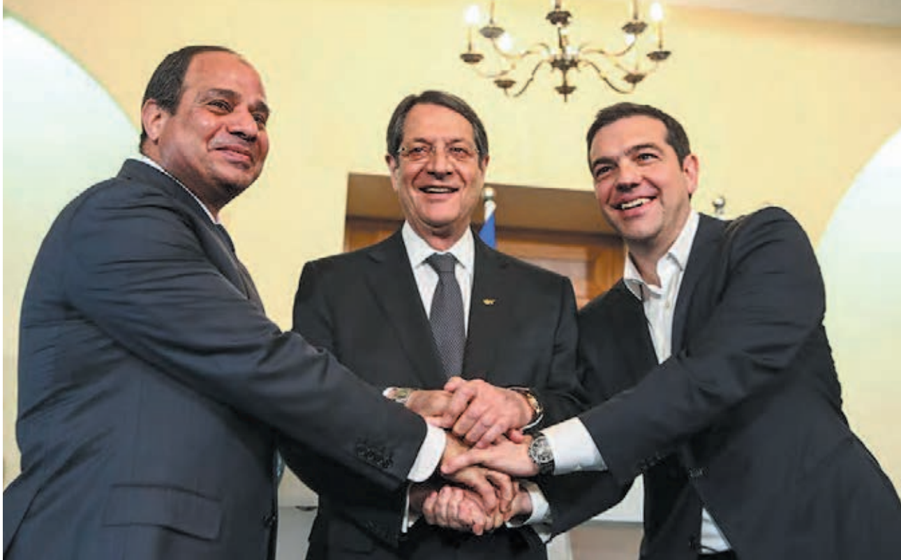
Ο Σίσι - δικτάτορας της Αιγύπτου, ο Αναστασιάδης - πρόεδρος μιας δεξιάς κυβέρνησης στην νότια Κύπρο και ο Τσίπρας δίνουν τα χέρια και συμφωνούν στην "πάταξη της τρομοκρατίας".

που θα φροντίσει να ψηφιστεί από τη Βουλή μια συμφωνία με τους δανειστές. Όσο ο Τσίπρας επιμένει στην αναζήτηση του πολιτικού συμβιβασμού με την Μέρκελ, τόσο ο Σαμαράς και ο Βενιζέλος ελπίζουν ότι μια τέτοια συμφωνία θα σημάνει ότι η αριστερά είναι «παρένθεση» και τα φυσιολογικά στηρίγματα της συμφωνίας είναι τα κόμματά τους, έστω μαζί με έναν «μεταμελημένο» ΣΥΡΙΖΑ.