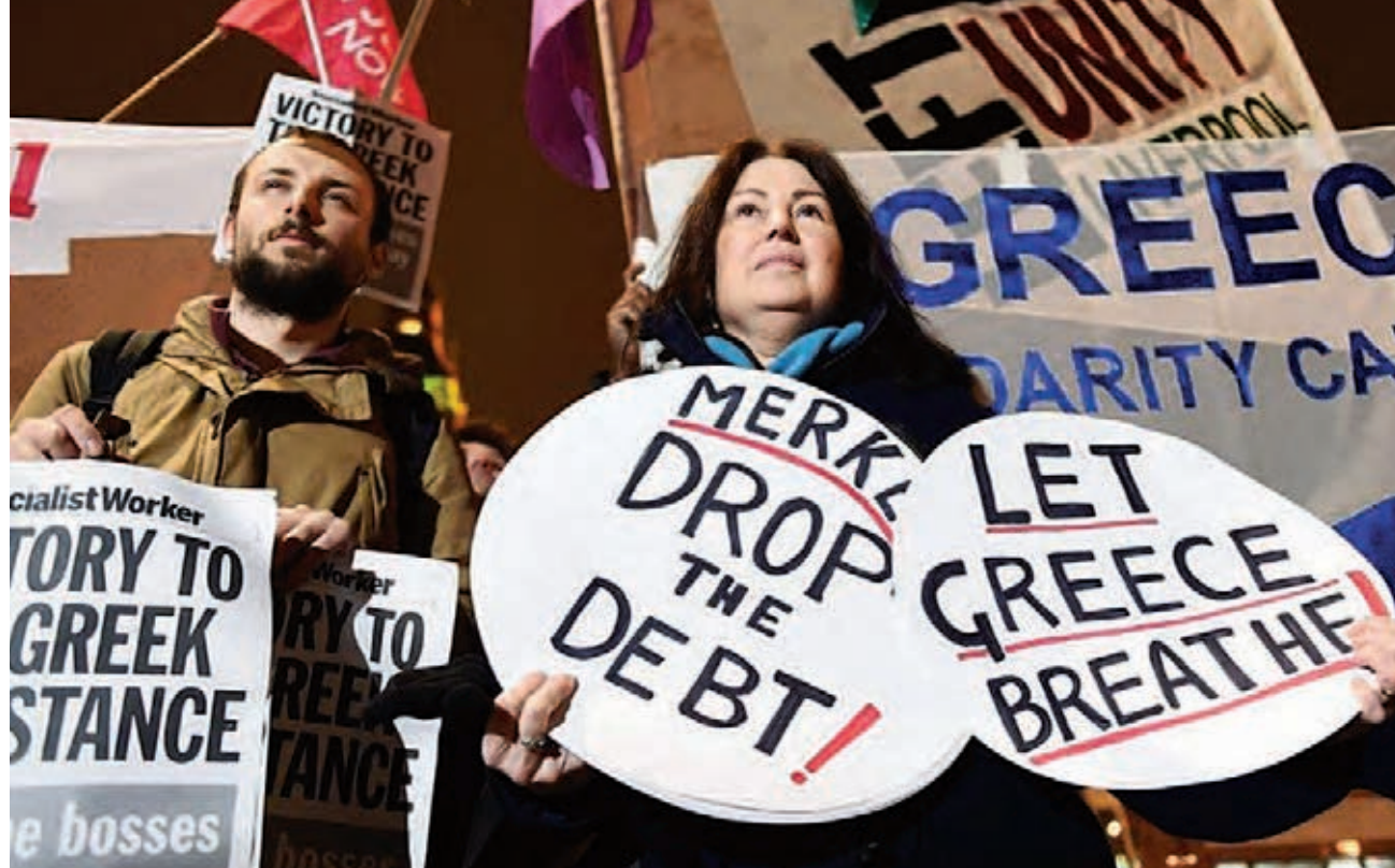
Οι δικοί μας σύμμαχοι είναι οι εργαζόμενοι που αντιστέκονται στη λιτότητα παντού. Η φωτό από διαδήλωση στο Λονδίνο το Φλεβάρη 2015.

Πουθενά η πολυαναμενόμενη ανάκαμψη μετά τη βουτιά του 2008-09 δεν απέκτησε δυναμική που να φτάνει στα επίπεδα προ κρίσης. Σύμφωνα με στοιχεία του ΔΝΤ που αναφέρει ο Μάικλ Ρόμπερτς, ο ετήσιος ρυθμός αύξησης του ΑΕΠ των αναπτυσσόμενων χωρών ήταν 2,3% στα χρόνια 2001-07, έπεσε στο 1,3% στα χρόνια 2008-14 και προβλέπεται (από την φετινή εαρινή έκθεση του ΔΝΤ) να πάει στο 1,6% τα επόμενα πέντε χρόνια 13 . Για τις αναπτυσσόμενες χώρες η επιβράδυνση είναι χειρότερη.