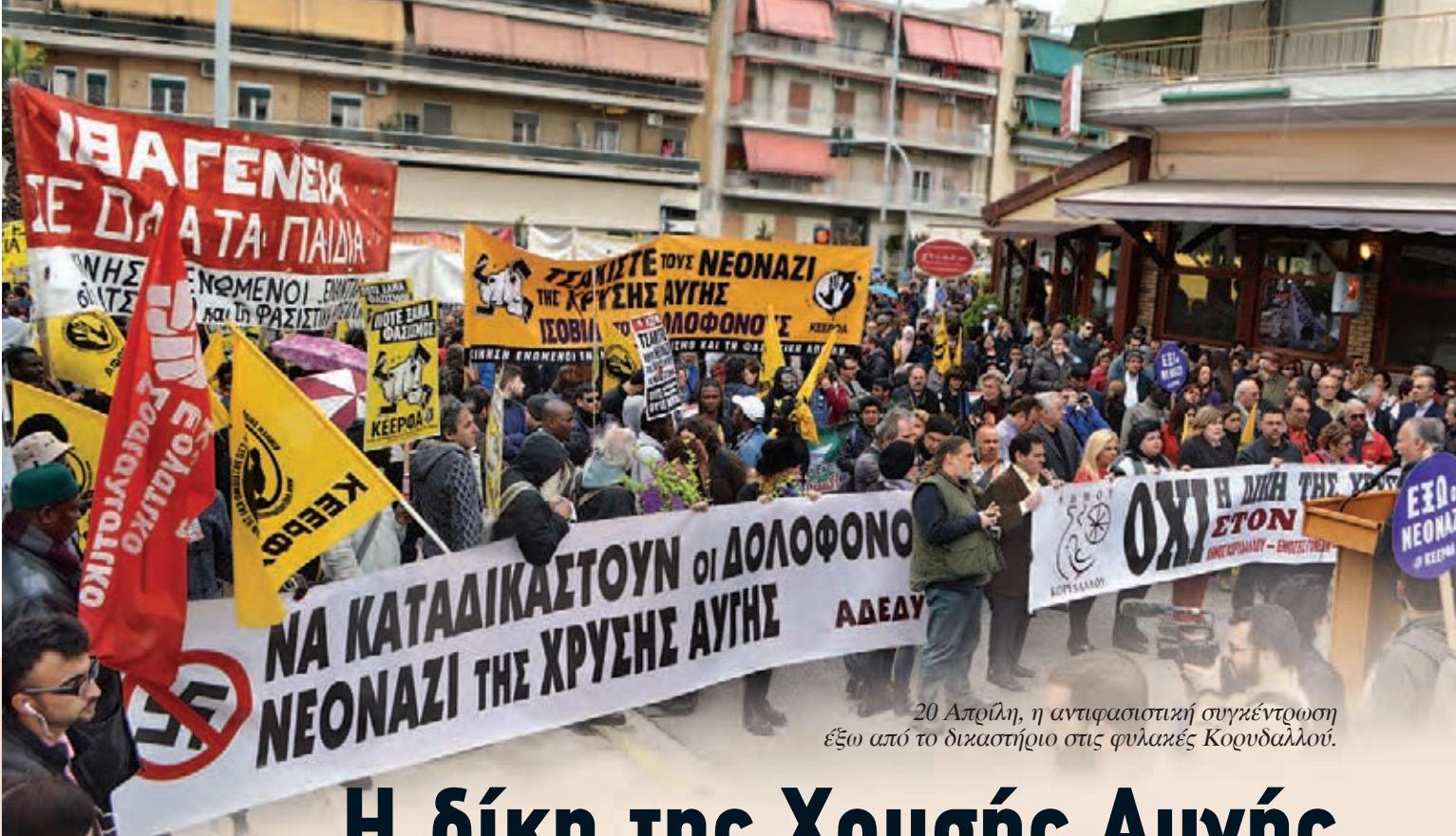
20 Απρίλη, η αντιφασιστική συγκέντρωση έξω από το δικαστήριο στις φυλακές Κορυδαλλού.