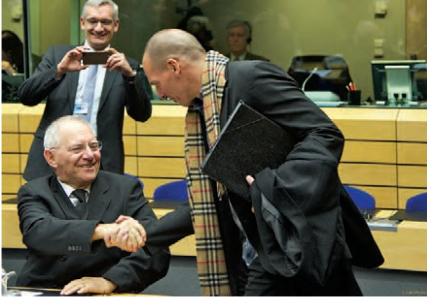
Ο Βαρουφάκης χαιρετάει τον Σόιμπλε.