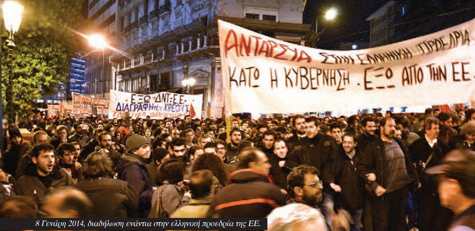
8 Γενάρη 2014, διαδήλωση ενάντια στην ελληνική προεδρία της ΕΕ.