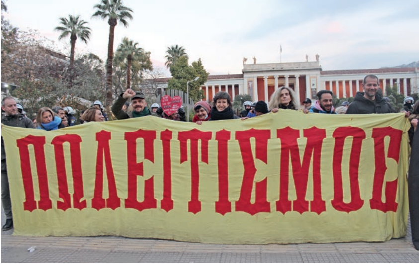
Διαδήλωση μπροστά στο Αρχαιολογικό Μουσείο

δρόμο για την κατάργηση του Άρθρου 16, που κατοχυρώνει την Δημόσια Δωρεάν ανώτατη εκπαίδευση. Δε θα αφήσουμε να κάνουν το ΠΔ85 δούρειο ίππο για την κατάργηση της δημόσιας και δωρεάν Παιδείας» τονίζουν οι φοιτητές/ριες του ΣΕΚ στις Σχολές. «Η λύση δεν είναι να ιδιωτικοποιήσουμε την Παιδεία για να έχουμε ίσα δικαιώματα στα πτυχία, η λύση είναι να κρατικοποιηθούν οι ιδιωτικές σχολές, να φτιαχτεί δημόσιο πανεπιστήμιο παραστατικών τεχνών, να καταργηθούν οι ταξικοί φραγμοί». 2