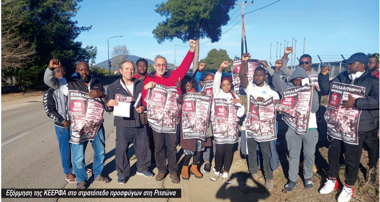
Εξόρμηση της ΚΕΕΡΦΑ στο στρατόπεδο προσφύγων στη Ριτσώνα

ανακοινώσεις, υπομνήματα και πρόσφυγες καταγγέλλουν ανοιχτά τη ρατσιστική πολιτική της ελληνικής κυβέρνησης. Η τελευταία καταγγελία μάλιστα ήρθε από ένα φορέα που αποτελεί ανεξάρτητο συμβουλευτικό όργανο του ίδιου του ελληνικού κράτους, την Εθνική Επιτροπή για τα Δικαιώματα του Ανθρώπου. Κατέγραψε μέσα από συνεντεύξεις 43 θυμάτων πάνω από 50 περιστατικά επαναπροωθήσεων από τον Απρίλιο του 2020 ως τον Οκτώβριο του 2022 που αφορούν τουλάχιστον 2.157 άτομα. Ανάμεσα στα 43 θύματα ήταν έξι αναγνωρισμένοι πρόσφυγες και 5 που είχαν ζητήσει άσυλο και περίμεναν τα αποτελέσματα. Σε 51 από τις 58 μαρτυρίες αναφέρονται πράξεις βίας (σωματική και λεκτική, προσβολή γενετήσιας αξιοπρέπειας, αφαίρεση προσωπικών αντικειμένων), στο 65% των περιπτώσεων από ένστολους.