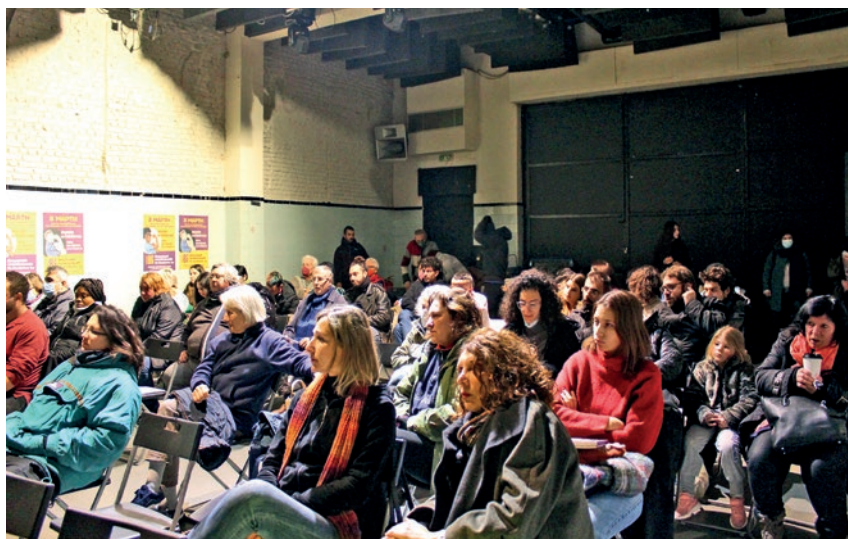
Σύσκεψη της Κίνησης για την Απεργιακή 8 Μάρτη

Σε αυτό έρχεται να προστεθεί και η πολιτική της διάλυσης των κοινωνικών υπηρεσιών που έχει σαν αποτέλεσμα να φορτώνονται ακόμα περισσότερα βάση στην οικογένεια και κατά επέκταση στη γυναίκα. Η διάλυση της δημόσιας Υγείας δεν έχει μόνο επίπτωση στην αύξηση της νοσηρότητας στους πιο φτωχούς που δεν έχουν να πληρώσουν αλλά σημαίνει ότι η φροντίδα των αρρώστων παιδιών, ηλικιωμένων, μετατρέπεται σε υπόθεση της οικογένειας και επιβαρύνει τη θέση της γυναίκας. Η υποστελέχωση των νοσοκομείων και της πρωτοβάθμιας φροντίδας υγείας έχει σαν αποτέλεσμα το δικαίωμα στην δωρεάν και