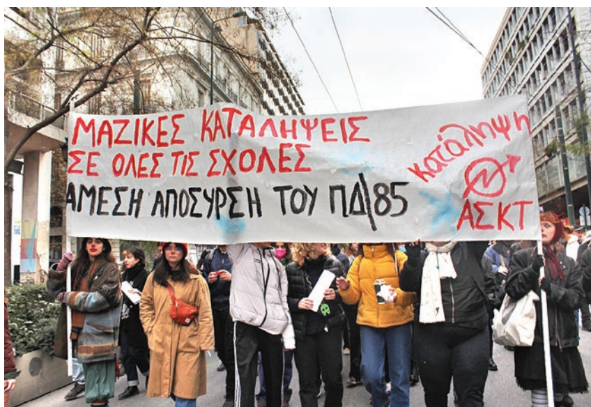
Καταλήψεις στις σχολές