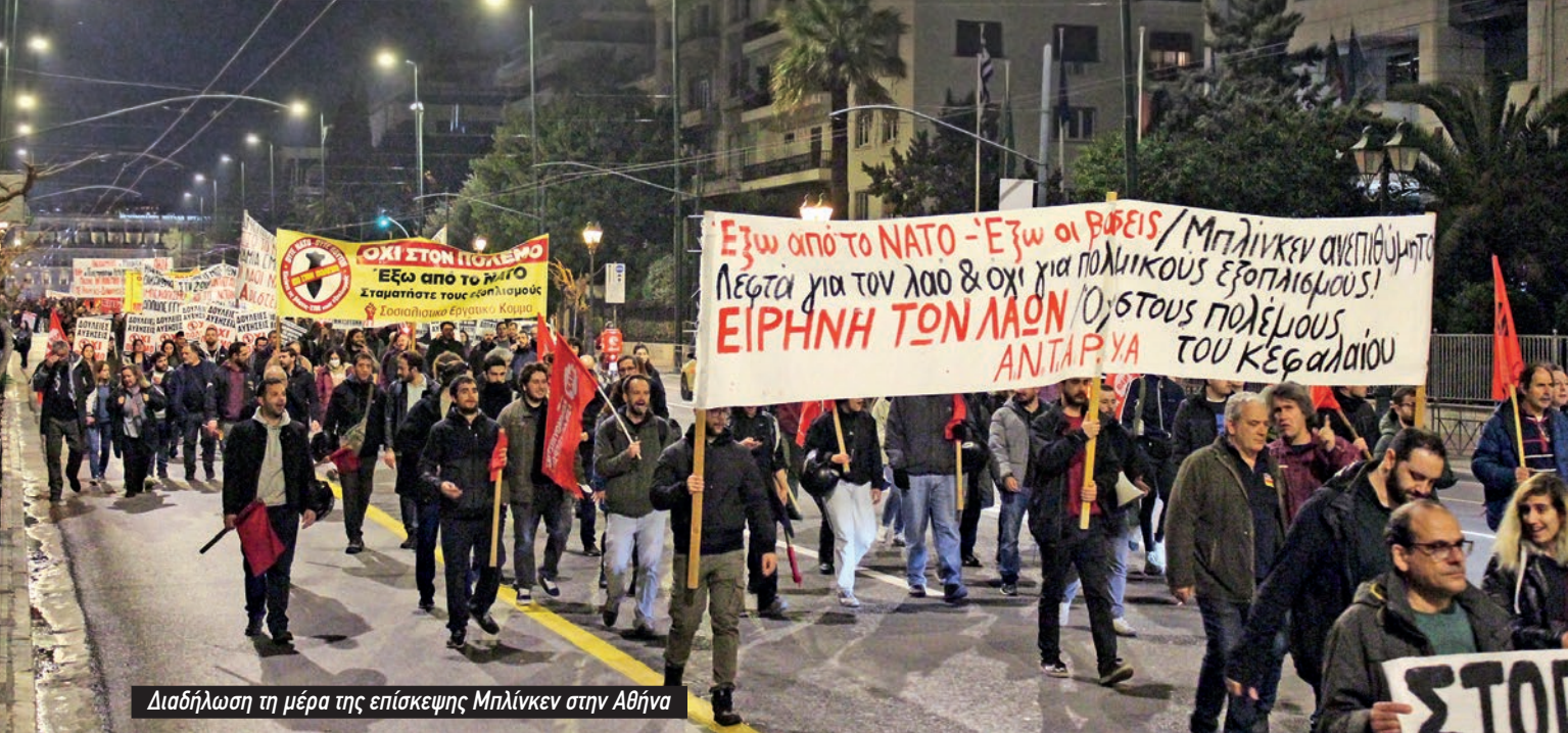
Διαδήλωση τη μέρα της επίσκεψης Μπλίνγκεν στην Αθήνα

δυνάμεων είναι η Αλεξανδρούπολη. Τις επόμενες ημέρες αναμένονται στο λιμάνι της Αλεξανδρούπολης θηριώδη μεταγωγικά πλοία για να ξεφορτώσουν πολεμικό υλικό, το οποίο θα προωθηθεί στη Βόρεια Ευρώπη, σε χώρες του ΝΑΤΟ, έως τη Βαλτική και κυρίως σε χώρες που συνορεύουν με τη Ρωσία. Έτσι, το λιμάνι θα γεμίσει από επιθετικά ελικόπτερα, άρματα μάχης, πυροβόλα, πυραύλους, πολλαπλούς εκτοξευτές, ότι πιο σύγχρονο έχει να προσφέρει η πολεμική βιομηχανία». 10