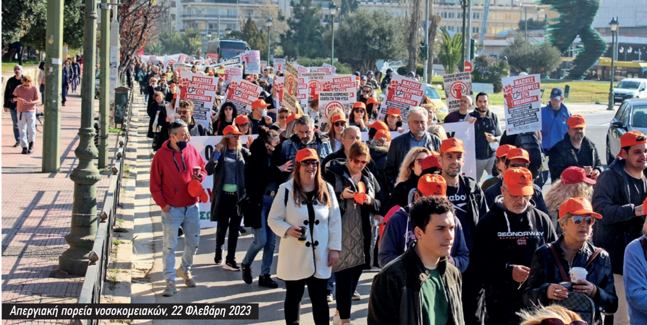
Απεργιακή πορεία νοσοκομειακών, 22 Φλεβάρη 2023

το 2021 ήταν ένα από τα σημαντικότερα επιτεύγματα των τελευταίων χρόνων. Η ελονοσία σκοτώνει ένα παιδί κάθε λεπτό και οι χώρες στις οποίες το πρόβλημα οξύνεται είναι αυτές της υποσαχάριας Αφρικής. Οι έρευνες για το συγκεκριμένο εμβόλιο γίνονται από το 1985. Σαράντα ολόκληρα χρόνια χρειάστηκαν για την παραγωγή ενός τόσο σημαντικού εμβολίου. Το ζήτημα δεν είναι το πόσο προχωρημένη είναι η επιστήμη αλλά ποιες είναι οι προτεραιότητες του συστήματος. Το κέρδος μπαίνει πάνω από όλα ακόμα και στα ζητήματα της έρευνας, του φαρμάκου και της υγείας.