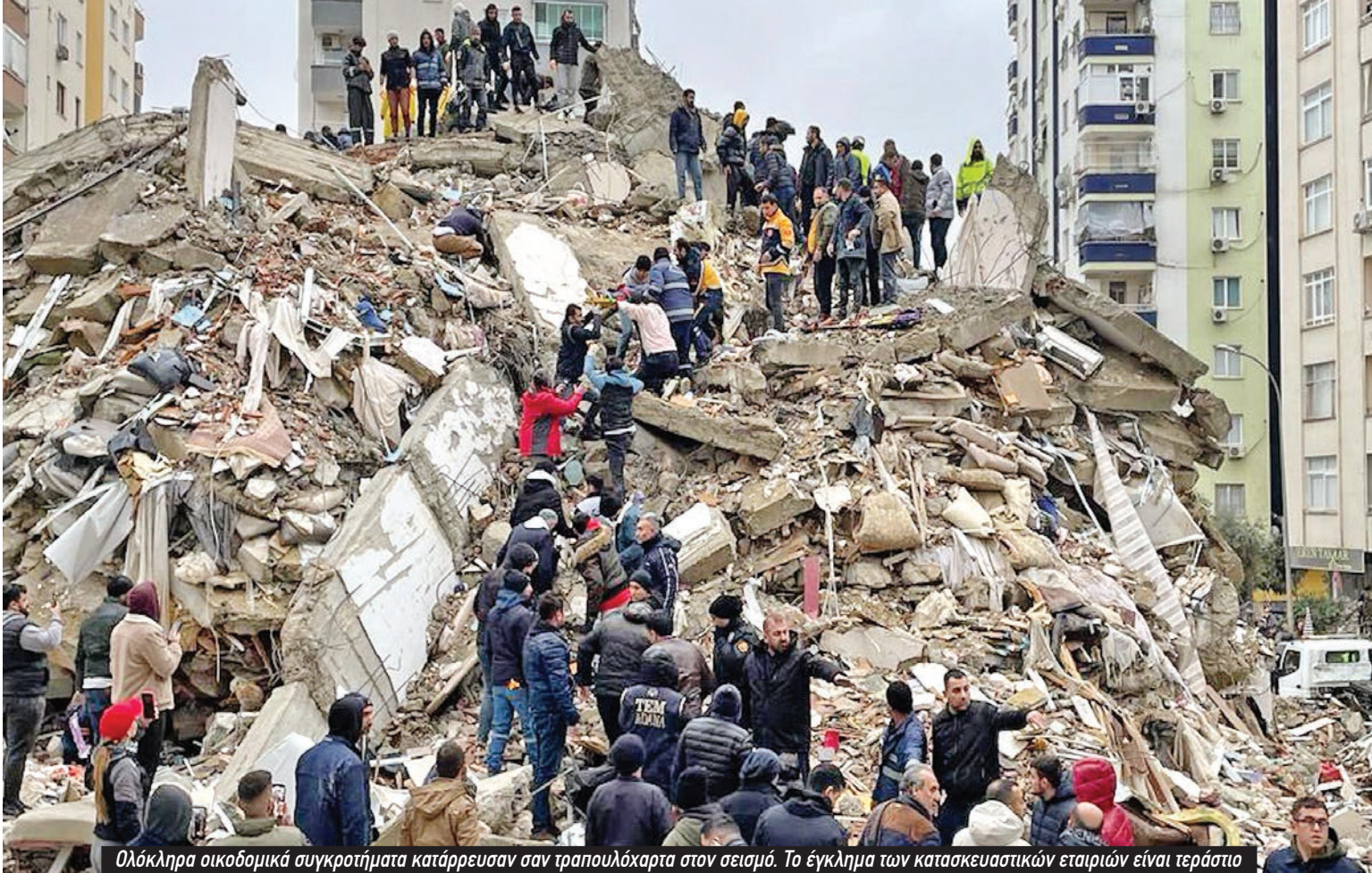
Ολόκληρα οικοδομικά συγκροτήματα κατάρρευσαν σαν τραπουλόχαρτα στον σεισμό. Το έγκλημα των κατασκευαστικών εταιριών είναι τεράστιο