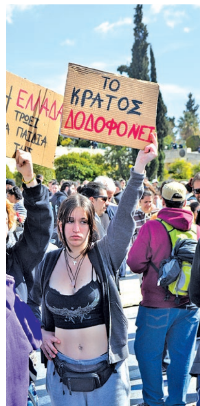
Σύνταγμα 5 Μάρτη

Οι ταξικοί αποκλεισμοί παιδιών από τα νοσοκομεία και τα σχολεία συνεχώς μεγαλώνουν. Όπως γράφει ο Σπύρος Ψύχας από το Δίκτυο για την καταπολέμηση της φτώχειας: “Σε επίπεδο Ευρωπαϊκής Ένωσης η Ελλάδα είναι σταθερά η δεύτερη μετά τη Βουλγαρία χώρα