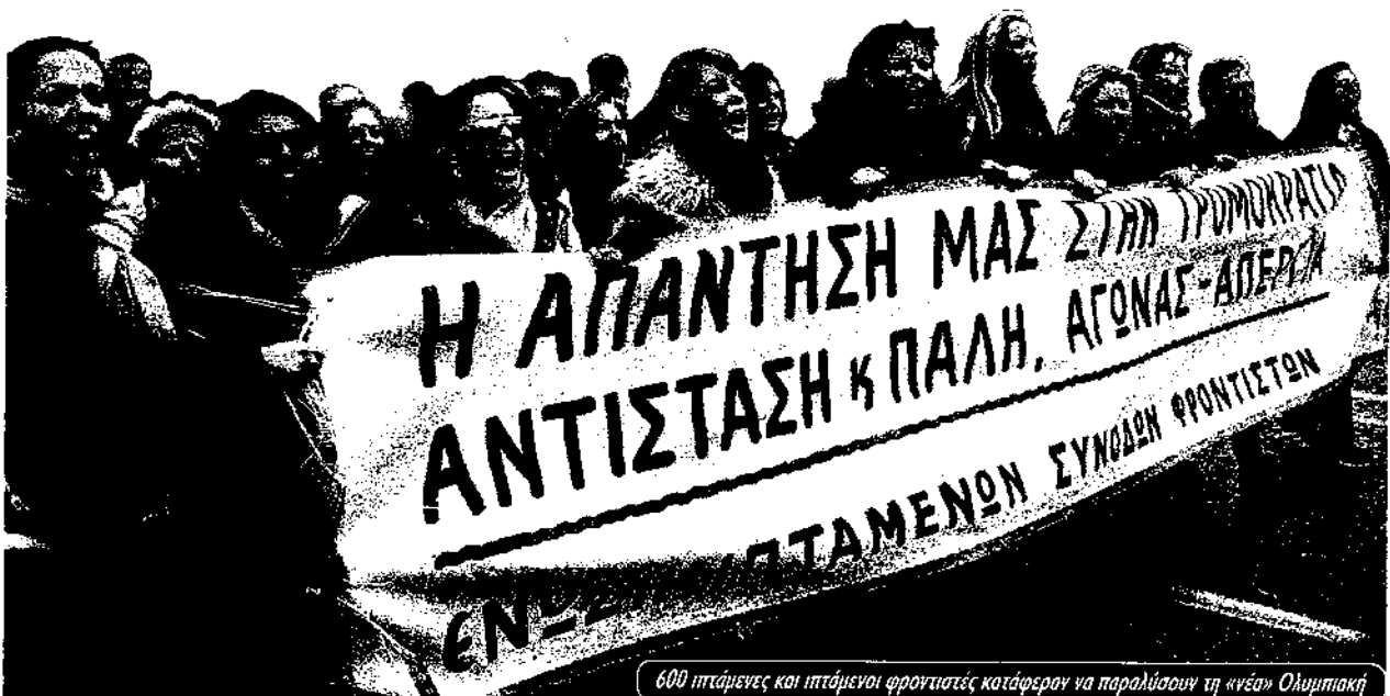
600 ιπτάμενες και ιπτάμενοι φροντιστές κατάφεραν να παρoλύσουν τη «νέα» Ολυμπιακή

Το μέλλον του νέου κινήματος είναι δεμένο με το μέλλον της νέας αριστεράς που δημιουργείται. Έχει μπροστά του μεγάλες μάχες να οργανώσει, όπως η 20 Μάρτη, παγκόσμια μέρα ενάντια στην κατοχή του Ιράκ και της Παλαιστίνης. Την εργατική αντίσταση που μόλις την αρχί τη είδαμε φέτος. Το 2004 είναι χρονιά εκλογών σε όλη την Ευρώπη και σε πολλές χώρες θα υπάρξει προσπάθεια να κατέβουν αντικαπιταλιστικά ψηφοδέλτια. Όλες αυτές οι μάχες έχουν ανάγκη από μια νέα αριστερά που θα είναι απαλλαγμένη από τις ηττοπάθειες και τους συμβιβασμούς της παλιάς αριστεράς που θα μπορεί να δίνει μάχες μέσα σ' αυτό το καινούριο κίνημα, όχι μόνο για να έχει τις επιτυχίες, τη δύναμη και την αποφασιστικότητα που έδειξε φέτος, αλλά και για την προοπτική. Γιατί δε θέλουμε ένα κίνημα που θα πιέζει απλά τους από πάνω. Θέλουμε ένα κίνημα νικηφόρο, που θα τελειώσει μια και καλή μ' αυτό το ασπίο και απάνθρωπο σύστημα.