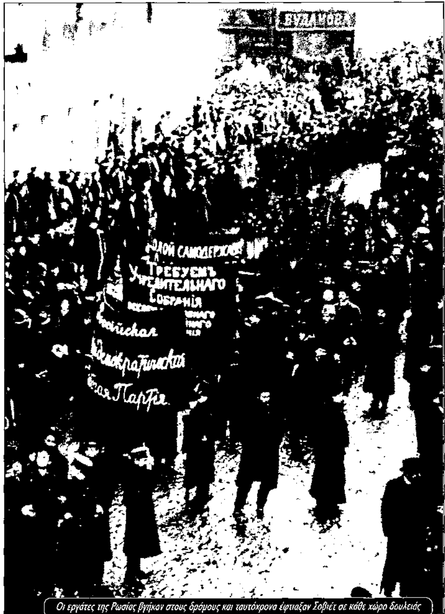
Οι εργάτες της Ρωσίας βγήκαν στους δρόμους και ταυτόχρονα έφτιαξαν Σοβιέτ σε κάθε χώρο δουλειάς

Ωστόσο, κανένο από τα αιτήματα με τα οποία βγήκαν στους δρόμους οι εργάτες και οι φαντάροι δεν υλοποιούνταν. Ο πόλεμος συνέχιζονταν, η γη παρέμενε στα χέρια των γαιοκτημόνων, το βιοτικό επίπεδο έπεφτε. Αυτή η κατάσταση είχε σαν αιτία της το γεγονός ότι στα σοβιέτ πλειοψηφούσαν τα ρεφορμιστικά κόμματα που ήθελαν συνεργασία με την αστική Προσωρινή Κυβέρνηση. Τους πρώτους μήνες της επανάστασης, την πλειοψηφία στα σοβιέτ την είχαν τα κόμματα των μενσεβίκων και των εσέρων. Ήταν κόμματα σοσιαλιστικά που είχαν αγωνιστεί ενάντια στην τσαρική απολυταρχία, αλλά που υποστήριζαν ότι οι εργάτες δεν ήταν «ώριμοι» να πάρουν την εξουσία. Για τους εσέρους και τους μενσεβίκους, ο σοσιαλισμός ήταν μια υπόθεση του μακρινού μέλλοντος, που θα ερχόταν μέσα από το κοινοβούλιο και τις εκλογές. Έστειλαν ηγετικά τους στελέχη