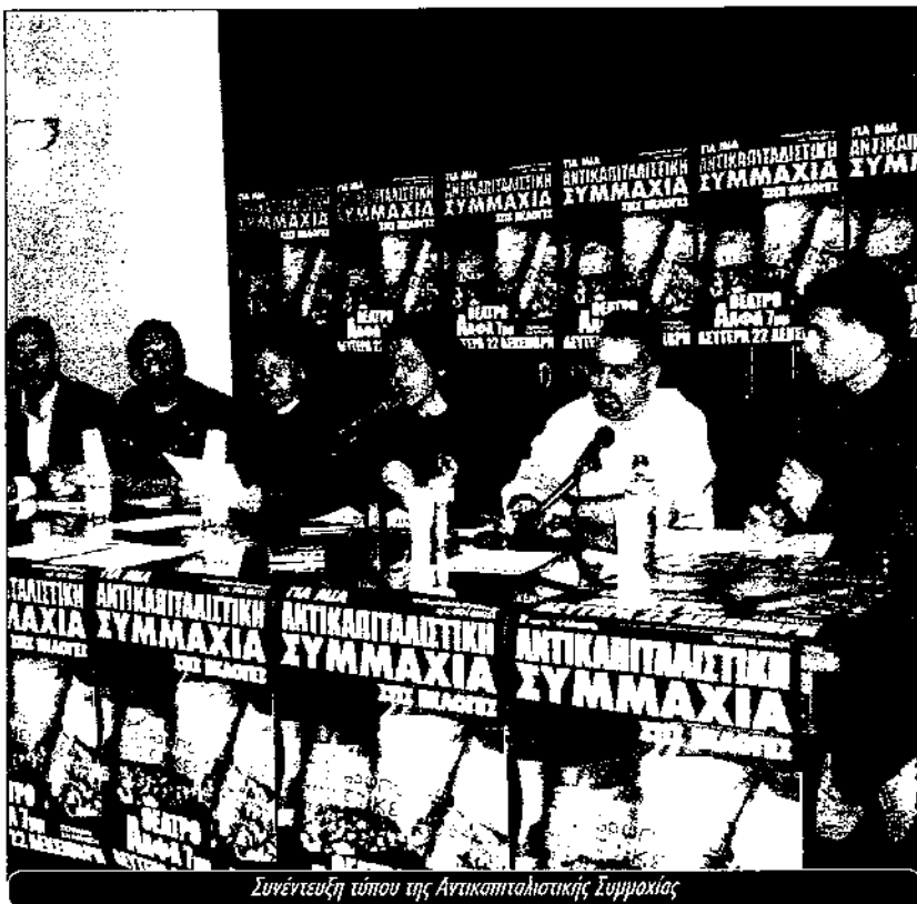
Συνέντευξη τύπου της Αντικαπιταλιστικής Συμμαχίας

“Το κίνημα που γεννήσε το Σιάτλ και συγκλόνισε τον κόσμο στη Γένοβα, γέμισε ελπίδα μεγάλα τμήματα εργαζόμενων που και στη