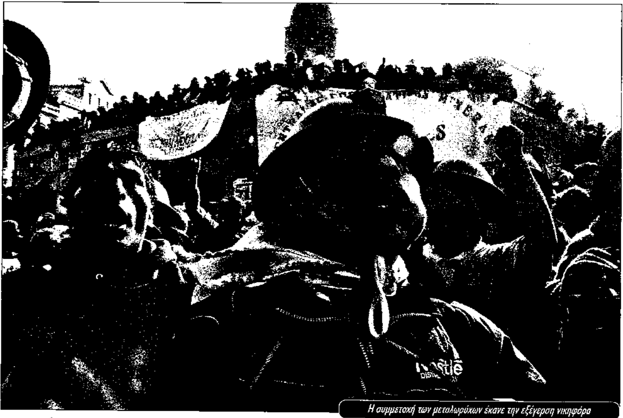
Η συμμετοχή των μεταλλωρύχων έκανε την εξέγερση νικηφόρα

σπάησε να βάλει στον «γύψο» τους εργατικούς αγώνες. Παρόλα αυτά μεγάλες απεργίες συνέχισαν να συνταράσσουν Ξανά και Ξανά τη Βολιβία. Το 1982, τελικά, οι στρατιωτικοί αναγκάστηκαν, αντιμέτωποι με μια μεγάλη οικονομική κρίση, να παραδώσουν την εξουσία. Οι εκλογές που ακολούθησαν έφεραν μια κεντροαριστερή κυβέρνηση -που όμως έτρεξε να υιοθετήσει ένα καθαρά νεοφιλελεύθερο πρόγραμμα οικονομικής σταθεροποίησης. Εκατοντάδες «μη βιώσιμα» ορυχεία έκλεισαν, ενώ τα υπόλοιπα, αφού «εξυγιάνθηκαν» με την απόλυση του «πλεονάζοντος προσωπικού» δόθηκαν πίσω στους ιδιώτες. Πάνω από 20.000 μεταλλωρύχοι πετάχτηκαν στην ανεργία.