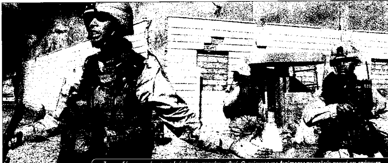
7 στους δέκα αμερικάνους στο Ιράκ έχουν «πεσμένο» ηθικό. Οι ενέργειες της Αντίστασης προκαλούν πανικό και απόγνωση

Ο Μπους βυθίζεται αργά και σταθερά κάτω από όλες αυτές τις πιέσεις. Δημοσκοπήηση στις αρχές Νοέμβρη έδειχνε για πρώτη φορά μια απόλυτη πλειοψηφία 51% των Αμερικανών να είναι αντίθετη στη συνέχιση της κατοχής, ενώ μόνο ένας στους τρεις Αμερικάνους δηλώνει πως θα ψήφιζε τον Μπους ξανά για πρόεδρο. Ο Μπους κατάφερε να πάρει το ΟΚ του Κογκρέσου για τα 87 δισεκατομμύρια δολάρια που χρειάζεται για τη συνέχιση του 'πολέμου δίχως τέλος'. Κατάφερε να πάρει το ΟΚ του ΟΗΕ στις 16 Οκτώβρη για αποστολή πολυεθνικών στρατευμάτων κατοχής. Αλλά οι δυο του αυτές νίκες δε φαίνεται πως μπορούν να εμποδίσουν την κατρακύλα στην κρίση. Το κυβερνητικό συμβούλιο του Ιράκ δήλωσε εμμέσως πλην σαφώς πως δεν συμφωνεί με την αποστολή τουρκικών στρατευμάτων στο Ιράκ, αδυνατίζοντας την τρίτη νίκη του Μπους, την έγκριση της αποστολής στρατού από το τουρκικό κοινοβούλιο.