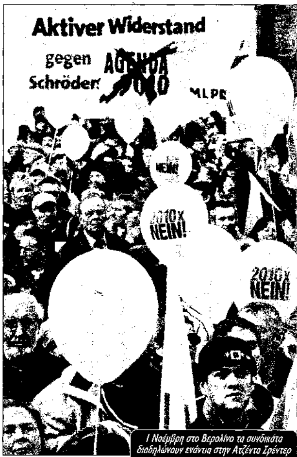
1 Νοέμβριο στο Βερολίνο τα συνδικάτα διαδηλώνουν ενάντια στην Ατζέντα Σρέντερ

καπιταλισμού. Οι «γραφιάδες» του πρώιμου καπιταλισμού ήταν ολιγάριθμο κομμάτι υπαλλήλων, στενά δεμένο με τα αφεντικά με σχέσεις αμεσότητας και εμπιστοσύνης, κατείχε μόρφωση απλησίαστη σε σύγκριση με την υπόλοιπη εργατική τάξη, ζούσε στη σκιά του αφεντικού αλλά με προνόμιο. Οι σύγχρονοι χαρτογιακάδες τόσο του ιδιωτικού τομέα όσο και του δημόσιου είναι εργάτες που εκτελούν «βιομηχανοποιημένη διανοητική εργασία» (2). Με εξαίρεση ένα μικρό διευθυντικό στρώμα δεν έχουν κανένα λόγο και κανένα ουσιαστικό έλεγχο πάνω στη δουλειά τους, παρ'όλο που συμβάλλουν αποφασιστικά στην τεράστια αύξηση της παραγωγικότητας της εργασίας. Υφίστανται όλων των ειδών τις πιέσεις από το κεφάλαιο: εντατικοποίηση, ελέγχους, αξιολογήσεις και φυσικά επίθεση στους μισθούς. Οι αντικειμενικές συνθήκες μέσα στις οποίες ζουν και δουλεύουν κλάδοι όπως εκπαιδευτικοί, τεχνικοί πληροφορικής, έρευνας, στατιστικής, μηχανικοί, και τα χτυπήματα που υφίστανται σε συνθήκες κρίσης τους φέρνουν σήμερα σαφώς πιο κοντά στην εργατική τάξη παρά στα μεσοστρώματα. Κι αυτό εκφράζεται με πολλούς τρόπους. Με την αποστασιοποίηση από το «ιερό λειτούργημα» που τους κληροδότησε το σύστημα, με την κρίση των ίδιων των θεσμών που επανδρώνουν, από την παιδεία, την υγεία, τη δικαιοσύνη κλπ., αλλά και στο πώς αντιδρούν: Με το συνδικαλισμό και τις απεργίες, τη συλλογική εμπειρία που έχουν αποκτήσει οι εργάτες σαν κοινωνική τάξη.