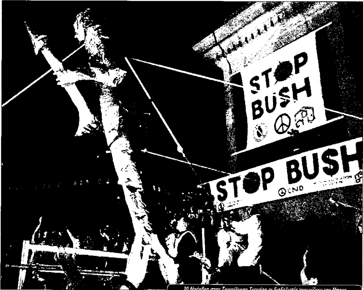
20 Νοέμβρη στην Τραφάλγκαρ Σκουέαρ οι διαδηλωτές γκρεμίζουν τον Μπους

θε περιοχή του πλανήτη. Αυτή είναι η σχέση ανάμεσα στον πόλεμο και το κεφάλαιο. Θα πρέπει κάποιος να είναι τυφλός για να μην βλέπει αυτή τη σύνδεση. Κοιτάχτε τι γίνεται στο Ιράκ. Οι αμερικάνικες εταιρείες πάνε να εκμεταλλευτούν τις πηγές της χώρας και αυτό είναι το όφελος για τις πιο πλούσιες εταιρείες στο πλανήτη και υπάρχει μεγάλη σύνδεση αυτών των εταιρειών με την αμερικανική κυβέρνηση. Ο κόσμος που υπέφερε από την δικτατορία ακόμα υποφέρει από όλα αυτά που κάνουν.