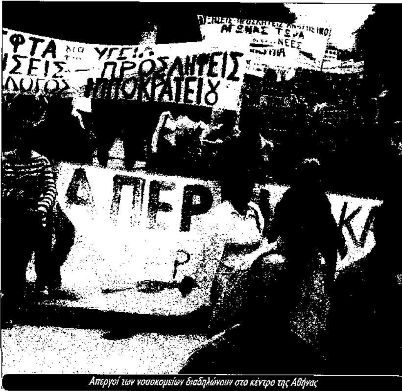
Απεργία των νοσοκομείων διαδηλώνουν στο κέντρο της Αθήνας

έχει οδηγηθεί σε αδιέξοδο καθώς Ισπανία και Πολωνία αρνούνται να αποδεχθούν τις ρυθμίσεις του Γαλλο-Γερμανικού άξονα. Είναι μια αντιπαράθεση που δεν αφορά μόνο τη σχετική βαρύτητα του κάθε κράτους σε ψήφους μέσα στην ΕΕ, αλλά και τη σχέση με το ΝΑΤΟ και τις ΗΠΑ.