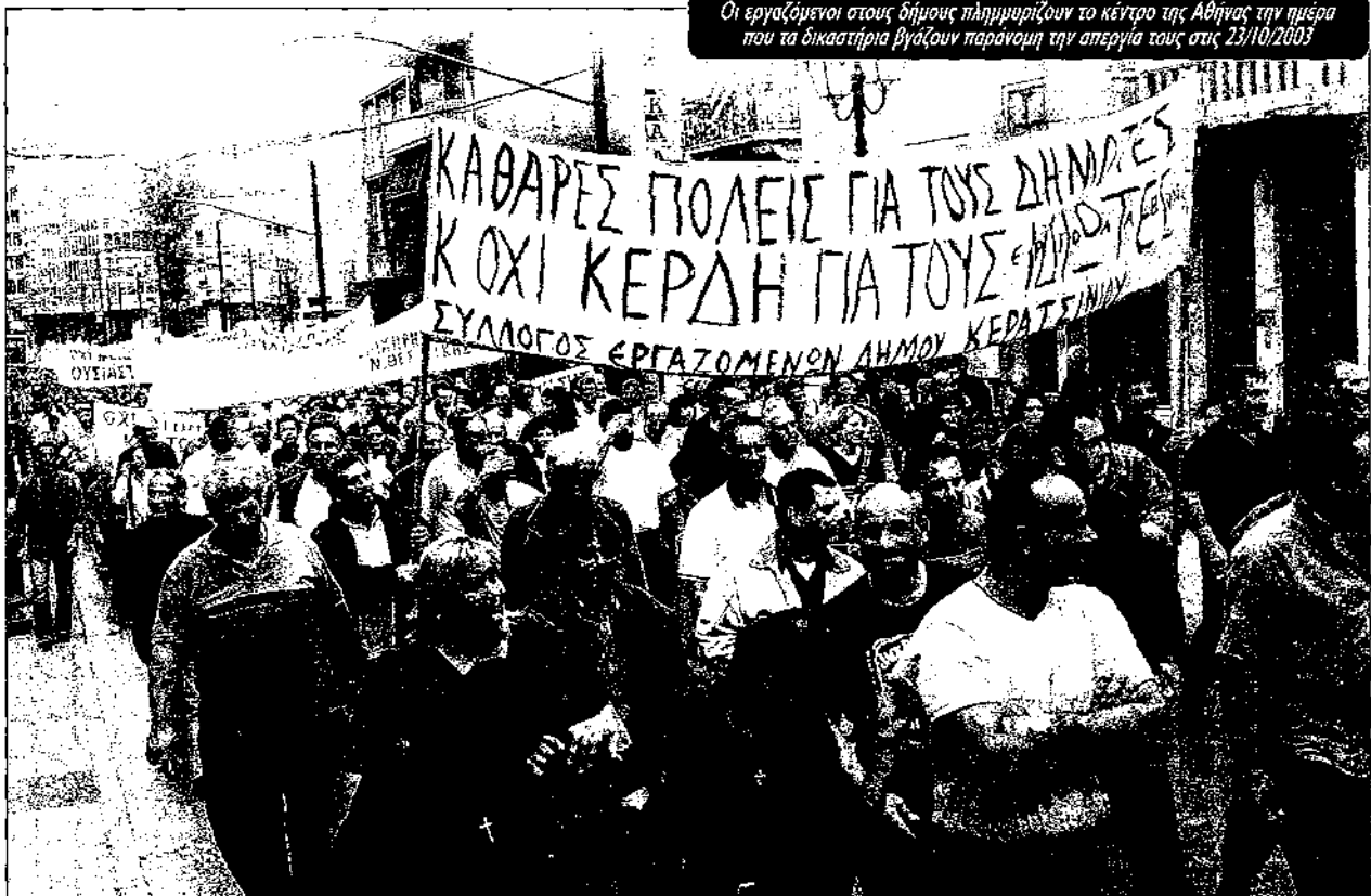
Οι εργαζόμενοι στους δήμους πλημμυρίζουν το κέντρο της Αθήνας την ημέρα που τα δικαστήρια βγάλουν παράνομη την απεργία τους στις 23/10/2003

Αυτό το γενικευμένο κλίμα έπαιξε πολύ σημαντικό ρόλο στο ξεκίνημα απεργιακών κινητοποιήσεων ενάντια στις ιδιωτικοποιήσεις που προωθεί η κυβέρνηση Σημίτη. Οι εργαζόμενοι στο Ταχυδρομικό Ταμιευτήριο ξεκίνησαν τη μάχη ενάντια στην ιδιωτικοποίηση του με 48ωρες απεργίες και συνέχισαν παρά το γεγονός ότι ο Χριστοδουλλάκης προσπάθησε να τους εξαγοράσει δίνοντάς τους κάποια ψίχουλα από τα έσοδα των μετοχών που θα πουληθούν στο Χρηματιστήριο. Οι εργαζόμενοι της ΕΙΣΦ βρήκαν την αυτοπεποίθηση να οργανώσουν απεργίες κόντρα στην διάλυση της Ολυμπιακής παρά το γεγονός ότι η Ομοσπονδία τους είχε συμβιβαστεί. Σύσσωμοι, χωρίς απεργοσπάστες, οι ιπτάμενες και οι ιπτάμενοι συνοδοί και φροντιστές, υπερασπίζονται τα πιο βασικά συνδικαλιστικά δικαιώματα. Αρνούνται να