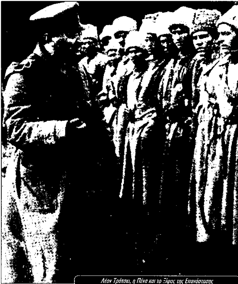
Λέον Τρότσκι, η Πένα και το Ξίφος της Επανάστασης

σύνθημα πρέπει να είναι «Όλη η εξουσία στα σοβιέτ», βρήκε σπένοντί του όλη την ηγεσία του κόμματος, τους «παλιούς μπολσεβίκους» όπως τον Κάμενεφ, τον Ζηνόβιεφ, τον Στόλιν και άλλους. Χρειάστηκε μια σκληρή εσωτερική συζήτηση και διαμάχη για να υιοθετηθεί το κόμμα την πολιτική του Λένιν. Ακόμα και στις παραμονές του Οκτώβρη, ένα μεγάλο τμήμα της ηγεσίας τάχθηκε ενάντια στον «τυχοδιωκτισμό» του Λένιν και του Τρότσκι. Επειδή οι μπολσεβίκοι ήταν ένα επαναστατικό κόμμα με χρόνια πάλης και εμπειρίας καθώς και με δεσμούς με την εργατική τάξη, στάθηκαν ικανοί να βρουν το σωστό βηματισμό τους.