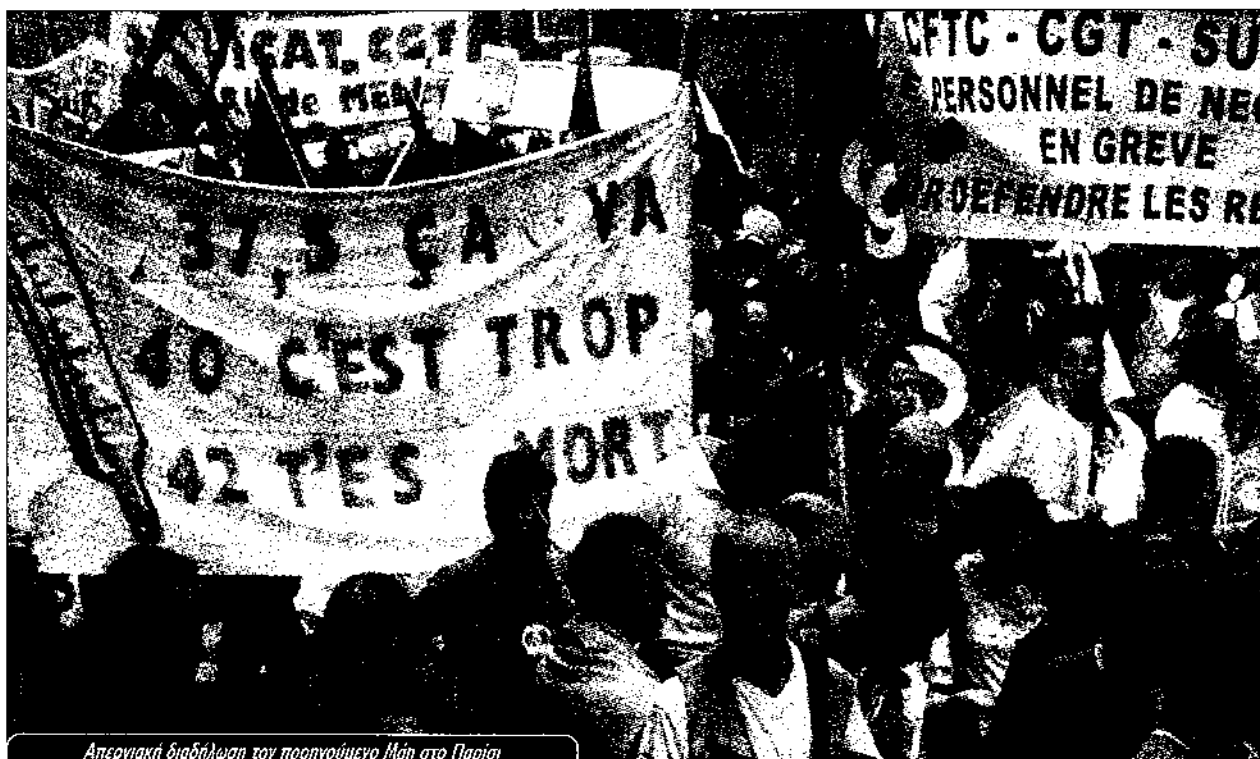
Απεργιακή διαδήλωση τον προηγούμενο Μάη στο Παρίσι

ψαν και κέρδισαν το οκτώωρο, έκαναν τη «Διεθνή» παγκόσμιο ύμνο για την αλλαγή της κοινωνίας, συγκλόνισαν τον κόσμο με τις επαναστάσεις που έκλεισαν τον Α' Παγκόσμιο Πόλεμο (1).