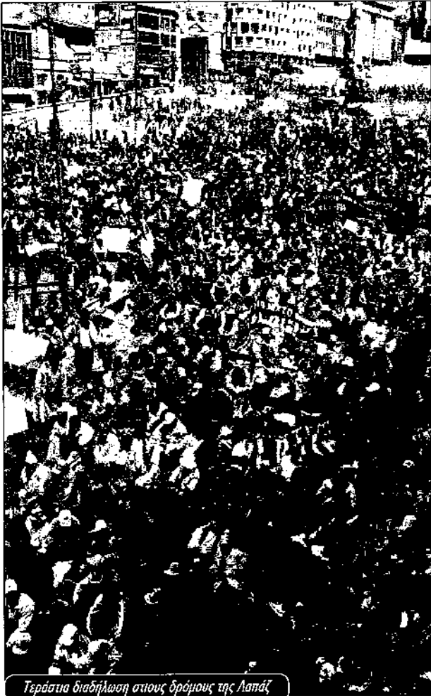
Τεράστια διαδήλωση στους δρόμους της Λαπάζ

Αλ Άλτο, ένα πυκνοκατοικημένο, φτωχικό προάστιο πάνω από την Λα Παζ. Κανέννας δεν γνωρίζει ακριβώς πόσο σκοτώθηκαν εκείνη την ημέρα. Οι επίσημες ανακοινώσεις της κυβέρνησης έκαναν λόγο για 90.