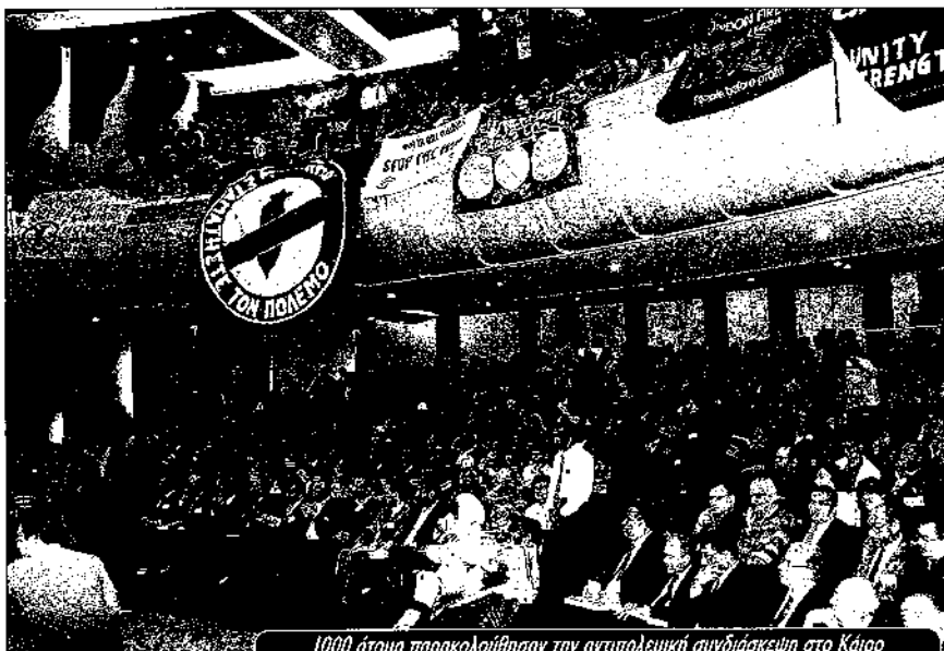
1000 άτομα παρακολούθησαν την αντιπολεμική συνδιάσκεψη στο Κάιρο