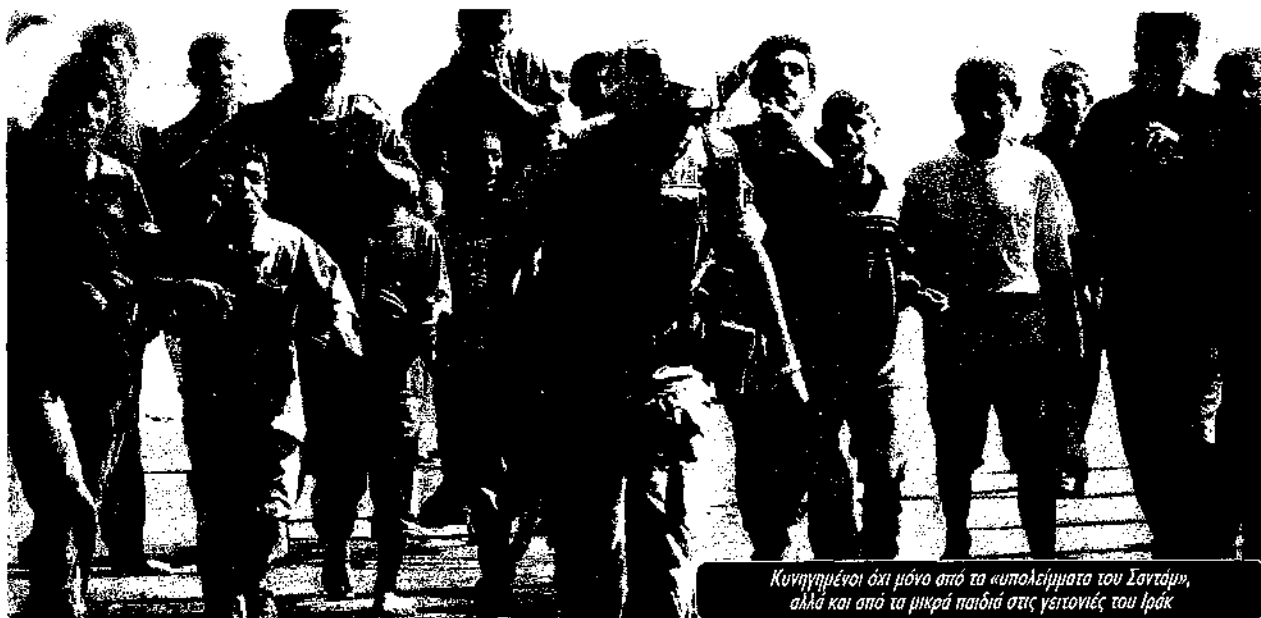
Κινηγμένοι όχι μόνο από τα κυπολίμματα του Σαντάμ, αλλά και από τα μικρά παιδιά στις γειτονίες του Ιράκ

Δέκο μέρες μετά, η έκρηξη στο σημαντικότερο τέμενος των Σιτών στη Νατζάφ άφηνε πίσω της περισσότερους από 130 νεκρούς, στην πλειοψηφία τους απλούς προσκυνητές, αλλά και τον ηγετικό κληρικό αλ Χακίμ. Εγινε συντονισμένη προσπάθεια να παρουσιαστεί σαν αρχή ενός εμφυλίου πολέμου ανάμεσα σε Σίτες και Σουνίτες. Όμως οι θρησκευτικοί ηγέτες των Σιτών έδειξαν τον πραγματικό ένοχο, τους Αμερικάνους και τους Βρετανούς. Η σπώλεια του ελέγχου από τα χέρια των στρατευμάτων κατοχής φάνηκε