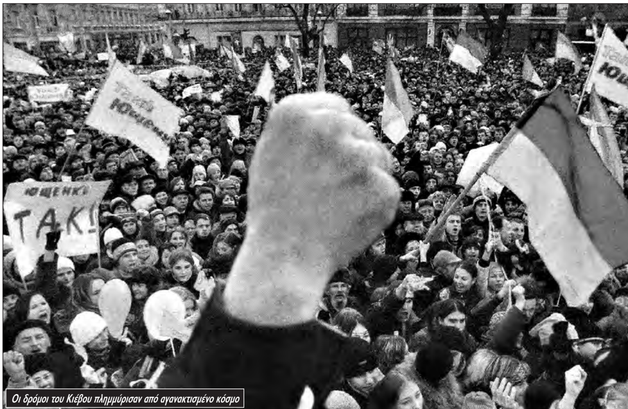
Οι δρόμοι του Κιέβου πλημμύρισαν από αγανακτισμένο κόσμο

φιλο-ρωσική πολιτική. Ομως ενώ κυβερνούσε έτεινε και προς τις ΗΠΑ. Το 1999 υποστήριξε τον πόλεμο του ΝΑΤΟ ενάντια στη Σερβία παρά τη μαζική αποδοκιμασία.