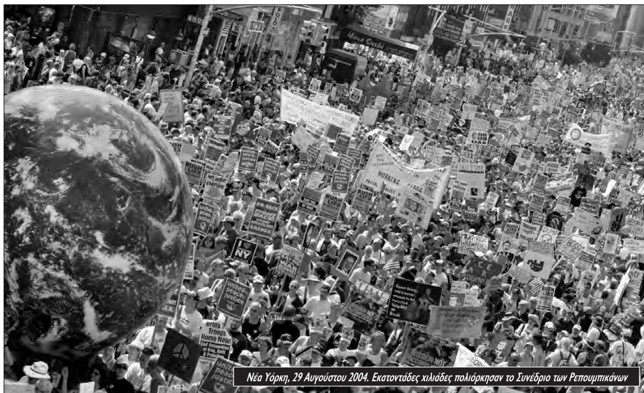
Νέα Υόρκη, 29 Αυγούστου 2004. Εκατοντάδες χιλιάδες πολίερκησαν το Συνέδριο των Ρεπουμπλικάνων

του Κέρι έμοιαζε με πόλεμο από τον αέρα. Βομβάρδιζε τον κόσμο με αοριστολογίες και έλπιζε ότι η μαζική διάθεση για “οποιοσδήποτε εκτός από τον Μπους” θα ήταν αρκετή.