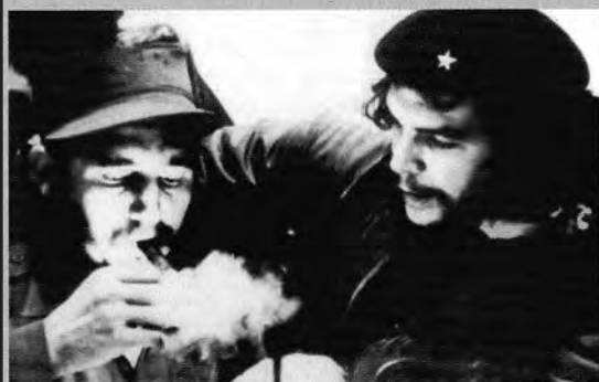
Επάνω ο Τσε στον ΟΗΕ το 1964. Αριστερά ο Τσε μαζί με τον Κάστρο στην Σιέρα Μαέστρα. Κάτω ο Τσε μιλάει στον κόσμο καθώς οι αντάρτες προελαύνουν στην Αβάνα