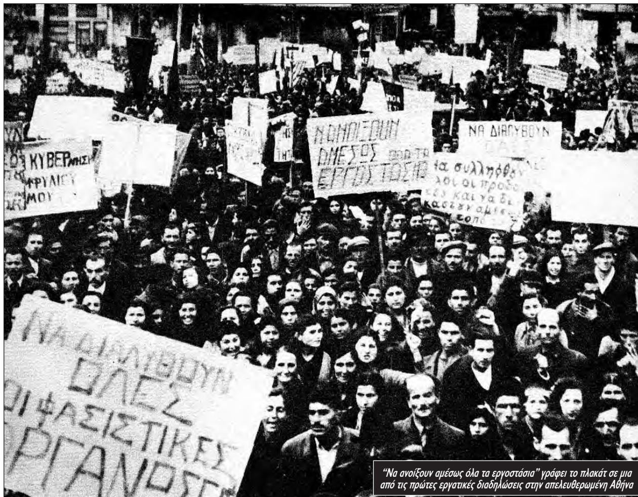
«Να ανοίξουν αμέσως όλα τα εργοστάσια» γράφει το πλακάτ σε μια από τις πρώτες εργατικές διαδηλώσεις στην απελευθερωμένη Αθήνα

Μέσα από τέτοιες μάχες γιγαντώθηκαν οι οργανώσεις του ΕΑΜ και του ΚΚΕ, που στις παραμονές της Απελευθέρωσης είχε ξεπεράσει τις 400.000 μέλη. Ο ΕΛΑΣ είχε περίπου 80.000 αντάρτες στο βουνό, δεκάδες χιλιάδες «εφεδρικούς» στις πόλεις. Στην πραγματικότητα είχε την εξουσία.