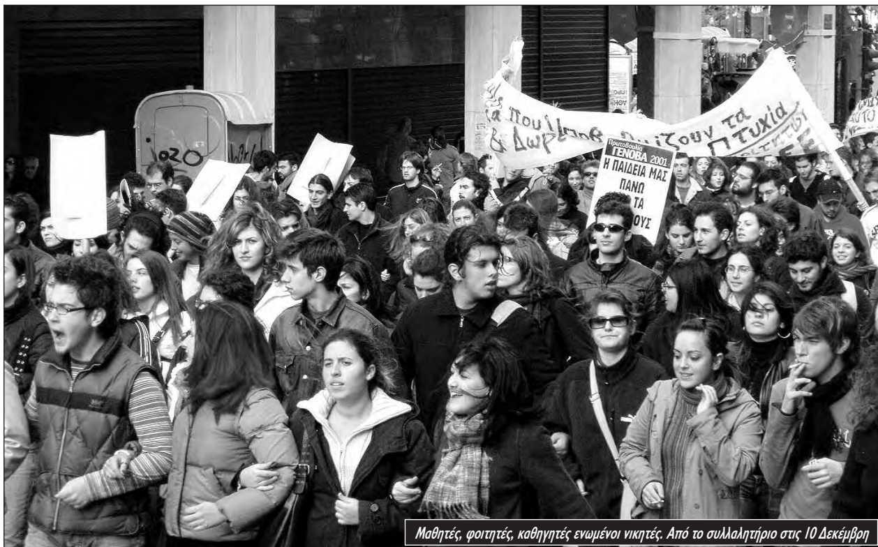
Μαθητές, φοιτητές, καθηγητές ενωμένοι νικητές. Από το συλλαλητήριο στις 10 Δεκέμβρη

φάνηκαν και σε άλλα σημεία, κάπως απροσδόκητα. Οι 400 εργαζόμενοι στις εταιρίες security, που έχουν αναλάβει εργολαβικά τον έλεγχο ασφάλειας επιβατών και αποσκευών στο αεροδρόμιο των Σπάτων, μπορεί να μην θεωρούνται από πολλούς σαν δυναμικό κομμάτι της εργατικής τάξης. Αλλά όταν οι εταιρίες προσπάθησαν να τους απολύσουν βρέθηκαν μπροστά σε μια απεργία που παρέλυσε το “καλύτερο αεροδρόμιο της Ευρώπης”. Η εργοδοσία αναγκάστηκε να κάνει πίσω.