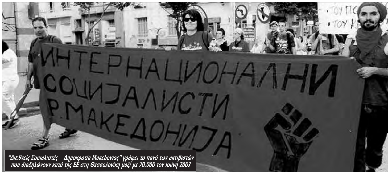
"Διεθνείς Σοσιαλιστές - Δημοκρατία Μακεδονίας" γράφει το πάνω των ακτιβιστών που διαδηλώνουν κατά της ΕΕ στη Θεσσαλονίκη μαζί με 70.000 τον Ιούνιο 2003

συμμορίες που ασχολούνται με την πορνεία, την παράνομη διακίνηση ανθρώπων και το λαθρεμπόριο όπλων, κατά κανόνα συνδεδεμένες με διεφθαρμένα πολιτικά ή φιλετικά κυκλώματα, λένε". Τράφικινγκ, πορνεία, λαθρεμπόριο όπλων -αυτό είναι το καθεστώς που ονομάζουν "σταθερότητα" ο Μπους και οι φίλοι του. Αυτό είναι το όραμά τους για τη Δημοκρατία της Μακεδονίας, που μόλις αναγνώρισαν με το "συνταγματικό της όνομα".