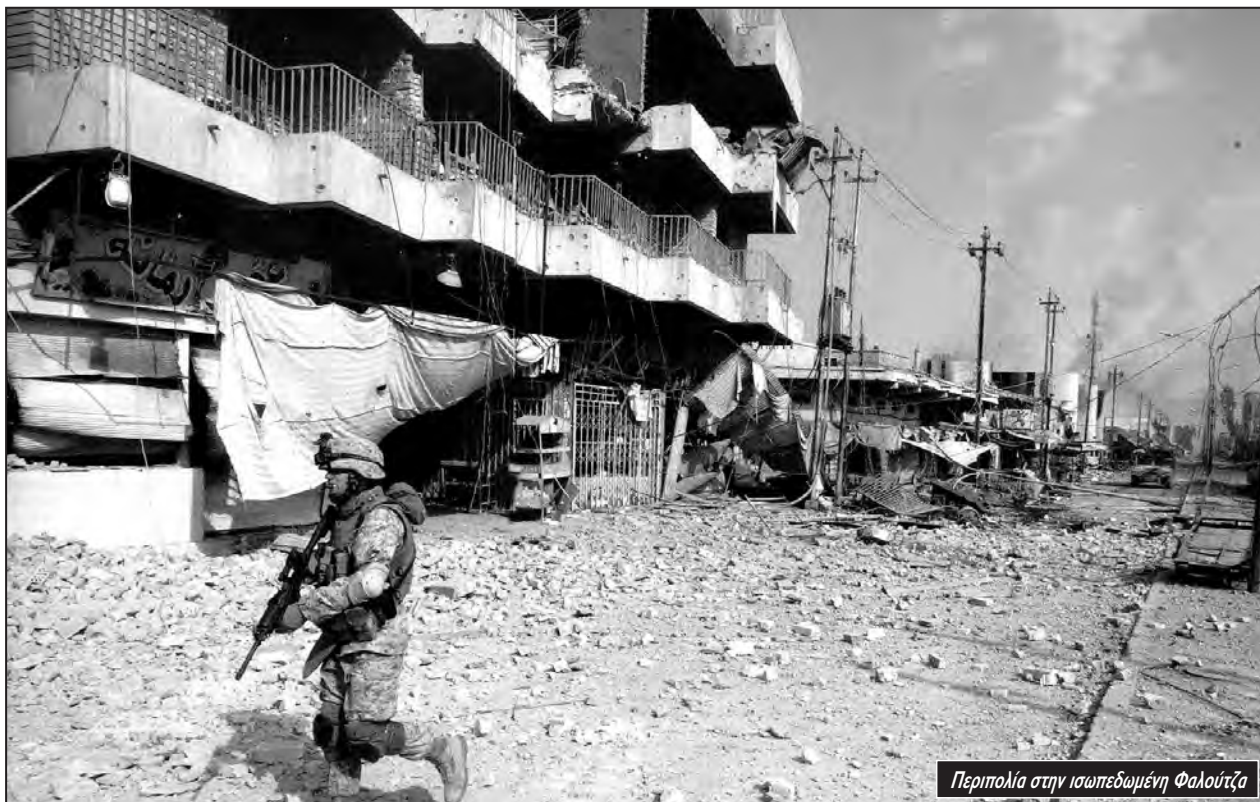
Περιπολία στην ισωπεδωμένη Φαλούτζα

καιρέτησαν συνδικαλιστές, αλλά και μια σειρά συνδικάτα που συμμετέχουν στο Stop the War Coalition (Συμμαχία Σταματήστε τον Πόλεμο), έριξαν το βάρος τους στο να πάρει η διαδήλωση αντιπολεμικό χαρακτήρα. Το βλέπουμε και στην Ελλάδα, όπου το ένα συνδικάτο μετά το άλλο παίρνει απόφαση για τις 19 Μάρτη. Το Συνέδριο της ΑΔΕΔΥ πήρε ομόφωνα απόφαση ότι καλεί στις 19 Μάρτη. Το ίδιο έγινε στα Συνέδρια της ΠΟΕΜ, της ΠΟΣΠΕΡΤ της ΠΟΕΠΤΗΜ. Και αυτό είναι πολύ σημαντικό γιατί και τα δυο συνδικάτα καλύπτουν εργαζόμενους στα ΜΜΕ.