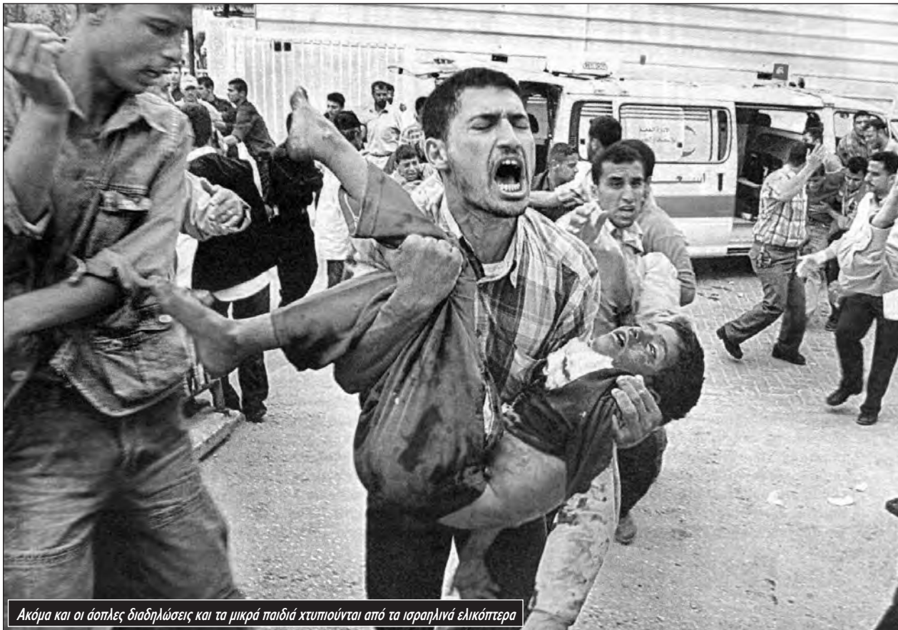
Ακόμα και οι άοπλες διαδηλώσεις και τα μικρά παιδιά χτυπιούνται από τα ισραηλινά ελικόπτερα

δέος απέναντι στην Παλαιστινιακή Αρχή που δεν μπορούσε να προσφέρει τίποτα εκτός από καταστολή και κλιδή για τους αξιωματούχους της.