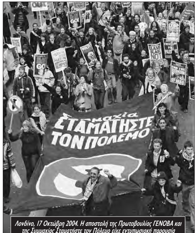
Λονδίνο, 17 Οκτώβρη 2004. Η αποστολή της Πρωτοβουλίας ΓΕΝΟΒΑ και της Συμμαχίας Σταματήστε τον Πόλεμο είχε εντυπωσιακή παρουσία

Ένα πλήθος τραγουδούσε και διαδήλωνε κατά του πολέμου, αλλά ένα πλήθος με συντριπτική συμμετοχή μαύρων, μουσουλμάνων, μεταναστών. Η ενοχοποίηση όλου αυτού του κόσμου από την ρατσιστική