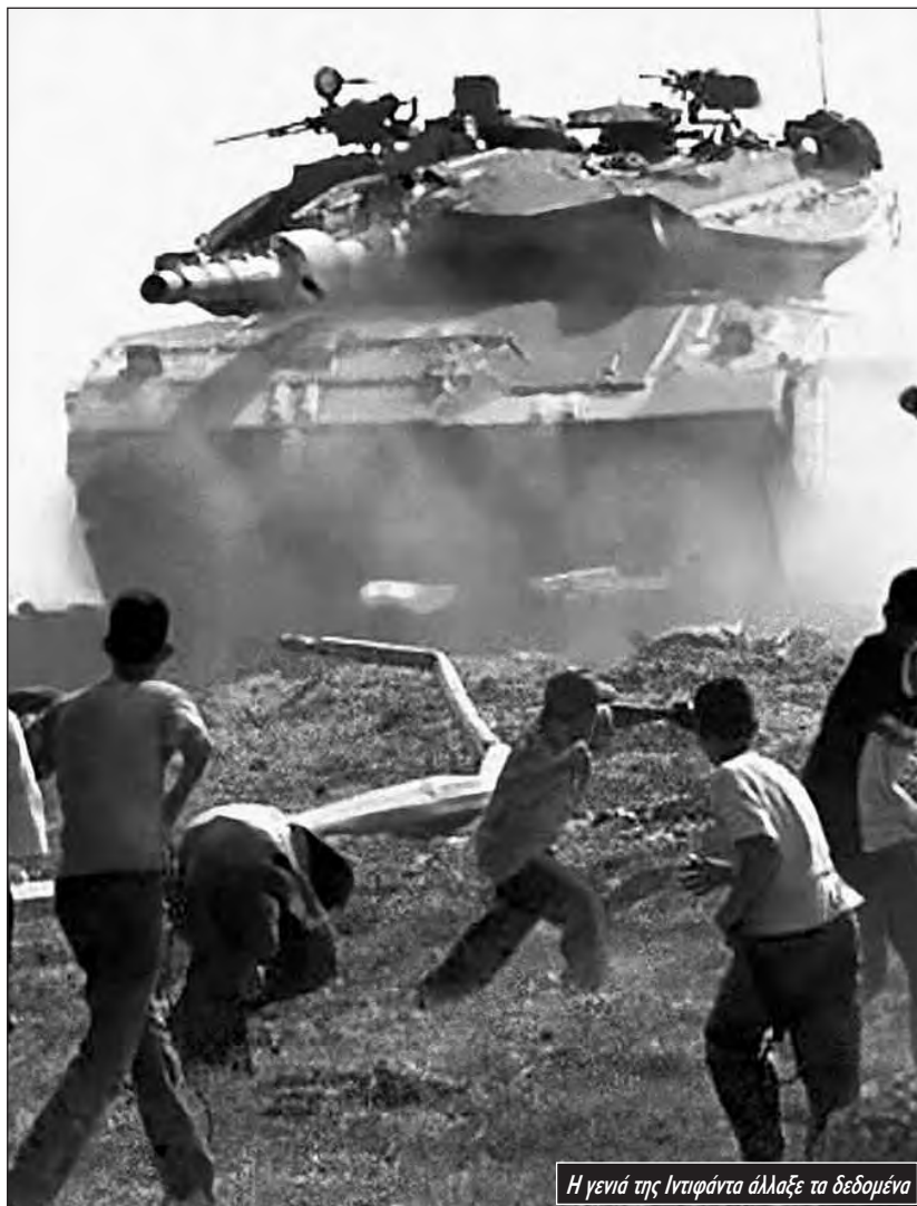
Η γενιά της Ιντιφάντα άλλαξε τα δεδομένα

απάτη, η Παλαιστινιακή Αρχή μετατρέπεται σε ένα ανίκανο, διεφθαρμένο άδειο κέλυφος και η απόσταση ανάμεσα στην ιστορική ηγεσία και τη βάση μεγάλωνε, η φωνή των "σαμπάμπ" άρχισε να ξανακούγεται.