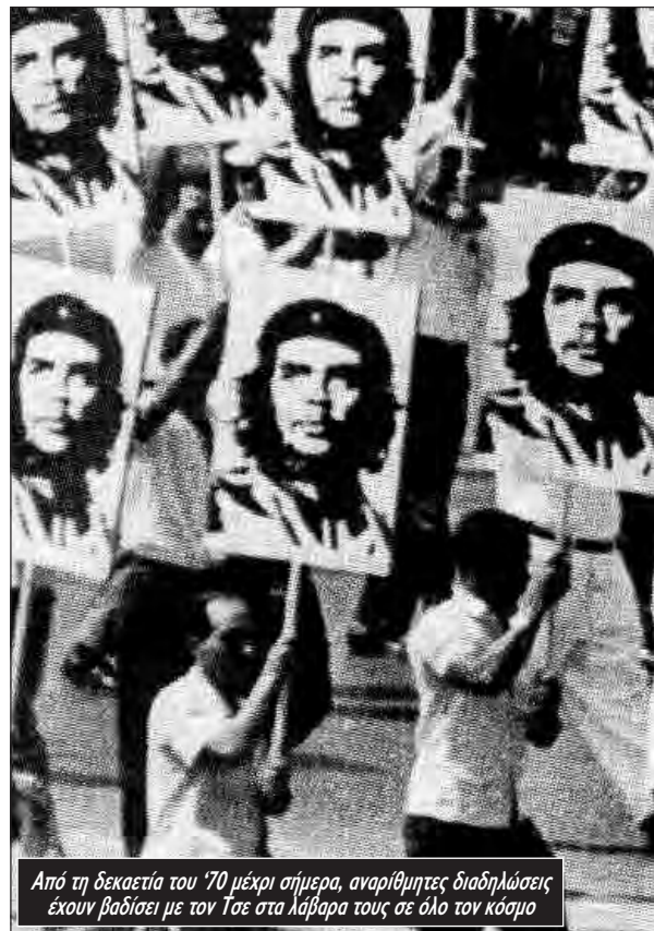
Από τη δεκαετία του '70 μέχρι σήμερα, αναρίθμητες διαδηλώσεις έχουν βαδίσει με τον Τσε στα λάβαρα τους σε όλο τον κόσμο

Αναμφισβήτητο σύμβολο της επανάστασης ο Τσε ξανανοίγει την πιο επίκαιρη συζήτηση