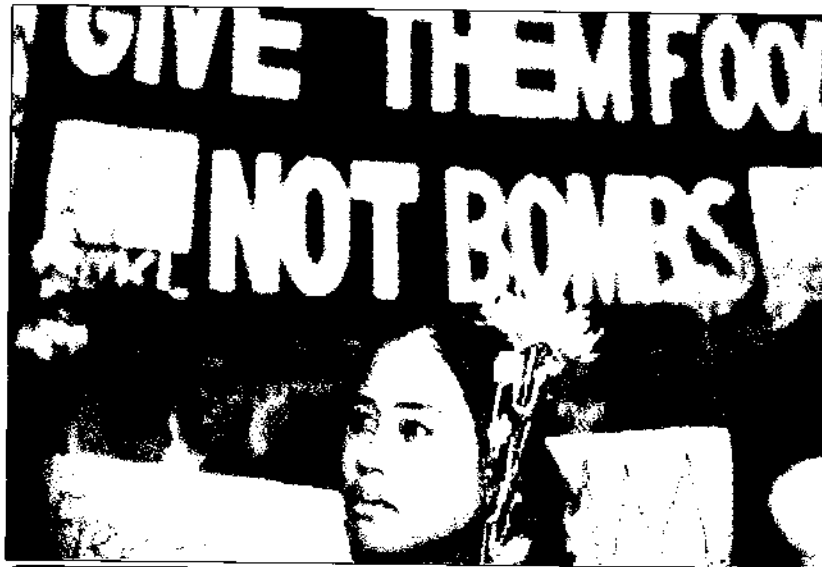
“Δώστε τους τρόφιμα, όχι βόμβες”. Διαδήλωση στη Μαλαισία μετά το τσουνάμι

Ινδονησία είναι η χώρα που είχε τις μεγαλύτερες καταστροφές από το τσουνάμι. Στην επαρχία Ατσέχ οι νεκροί ξεπέρασαν τις 80.000. Το χρέος της Ινδονησίας ανέρχεται αυτή τη στιγμή στα 132 δισεκατομμύρια δολάρια, το 65% του ΑΕΠ της χώρας. Μια μελέτη του 2002 έδειξε ότι εκείνη τη χρονιά η Ινδονησία θα έπρεπε να πληρώσει 37 δισεκατομμύρια δολάρια για την αποπληρωμή τόκων του χρέους. Η Ινδονησία ξοδεύει 10