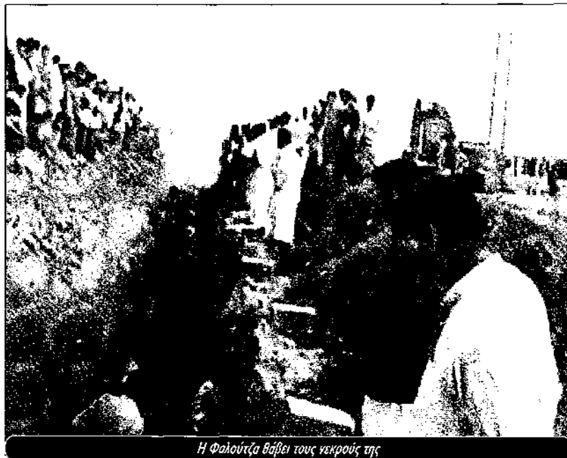
Η Φαλούτζα θάβει τους νεκρούς της

"Η ιρακινή εθνοφυρουρά είναι προδότες", φωνάζει κάποιος. "Είναι χειρότεροι απ' τους Αμερικάνους". Το πλήθος ξαναρχίζει να φωνά-