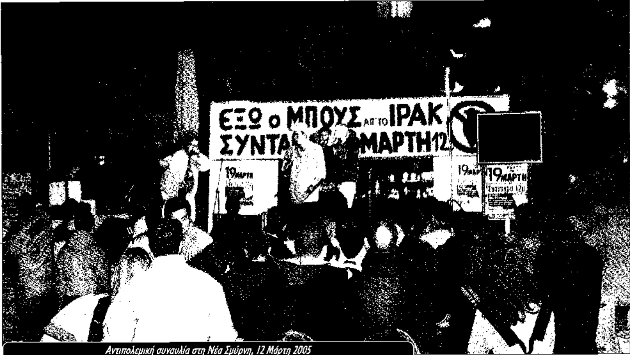
Αντιπολεμική συναυλία στη Νέα Σμύρνη, 12 Μάρτη 2005

Το επιχείρημα της "τρομοκρατίας" που δόθηκε εμπόδισε τους Ιρακινούς να ψηφίσουν δεν πειθεί. Δεν υπήρξε μαζικό κύμα επιθέσεων τη μέρα των εκλογών. Από τα 5000 εκλογικά τμήματα του Ιράκ, μόνο 109 δέχτηκαν κάποια μορφή επίθεσης, δηλαδή 2%. Το ρεπορτάζ του αλ-Τζαζίρα έκανε λόγο για ελάχιστα ποσοστά αποχής από φόβο. Η αποχή ήταν πολιτική στάση ενάντια στην κατοχή. Οι Ιρακίνοι του εξωτερικού που δεν είχαν να αντιμετωπίσουν απειλή βίας, είχαν αντίστοιχη συμπεριφορά. Από τα δύο εκατομμύρια με δικαίωμα ψήφου, ψήφισαν 265 χιλιάδες.