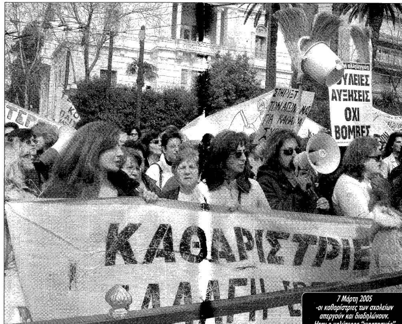
7 Μάρτη 2005 -οι καθαρίστριες των σχολείων απεργούν και διαδηλώνουν. Ήταν ο καλύτερος "γιορτασμός" της παγκόσμιας μέρας των γυναικών

Βγαίνουν μαζικά από το σπίτι, μπαίνουν ορμητικά στο κίνημα, οι γυναίκες της εργατικής τάξης έχουν έναν ολόκληρο κόσμο να κερδίσουν, γράφει η Μαρία Στύλλου