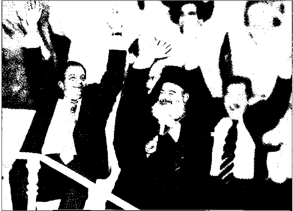
Καραμανλής-Χριστόδουλος μαζί όταν παρίσταναν τους αθώους φιλάθλους που πανηγυρίζουν. Τώρα τους έχει κοπεί η διάθεση για πανηγύρια

νο οικονομικά. Για να έχει φιλοδοξίες ότι θα πείσει τους εφοπλιστές να φέρουν λίγα από τα κέρδη τους στην Ελλάδα, ο Καραμανλής πρέπει να τους προσφέρει τις καλές υπηρεσίες της ελληνικής κυβέρνησης για την εξασφάλιση της πηγής αυτών των κερδών- τον δυτικό έλεγχο των πετρελαίων της Μέσης Ανατολής. Τα 100.000 δολάρια την ημέρα για κάθε τάνκερ από τον Περσικό προϋποθέτουν κάτι βασικό: την επιτυχία του πολέμου του Μπους στο Ιράκ και την ευρύτερη περιοχή. Οι διακηρύξεις της κυβέρνησης Καραμανλή, όπως τις διατύπωσε ο ίδιος ο πρωθυπουργός στις Βρυξέλες στη σύνοδο του