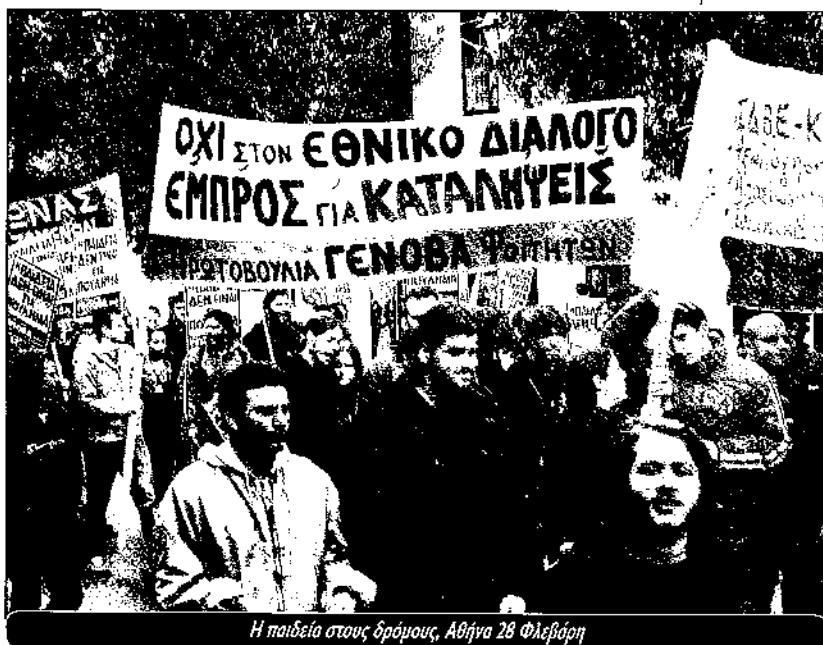
Η παιδεία στους δρόμους, Αθήνα 28 Φλεβάρη

Ο δεύτερος γύρος αυτής της σύγκρουσης θα είναι σκληρότερος. Και γιατί η Κουτσίκου θα αναγκαστεί αργά ή γρήγορα να προχωρήσει στην υλοποίηση της πολιτικής της