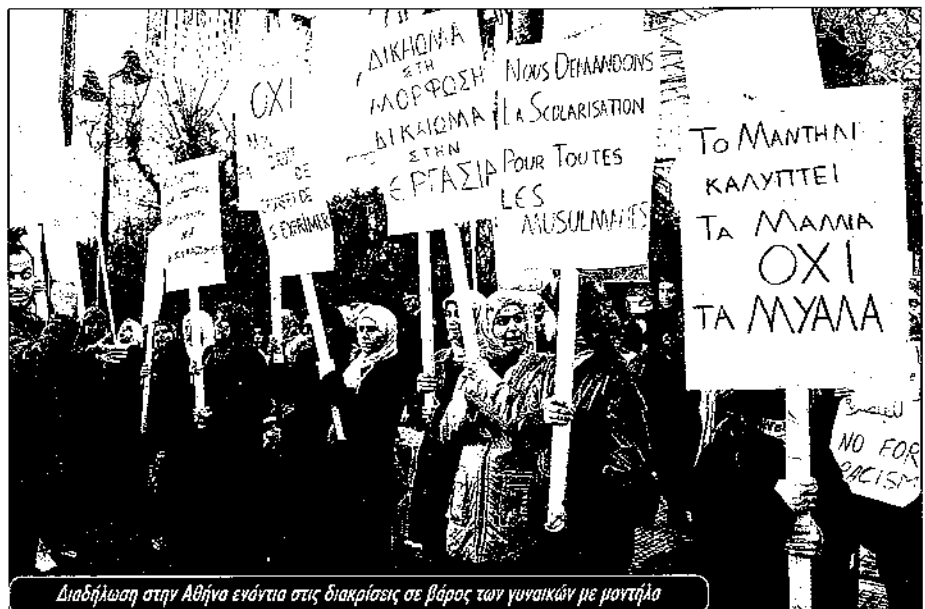
Διαδήλωση στην Αθήνα ενάντια στις διακρίσεις σε βάρος των γυναικών με μαντίλα

Η επανάσταση στη Ρωσία, έστω κι αν άντεξε λίγα χρόνια πριν απομονωθεί και πνιγεί από το σταλινισμό, έδειξε στην πράξη ότι η μεγάλη κοινωνική ανατροπή είναι ο δρόμος για την απελευθέρωση των γυναικών και όλων των καταπιεσμένων. Μια κοινωνία χωρίς σεξιστικές διακρίσεις δεν είναι ουτοπία. Σήμερα, με τη δύναμη των γυναικών που μπαίνουν ορμητικά στην εργατική τάξη και το κίνημά της, μια τέτοια κοινωνία είναι πιο εφικτή παρά ποτέ.