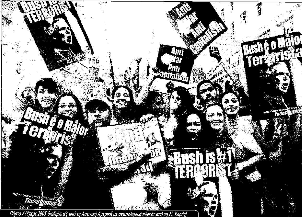
Πάρτο Αλέγχερ 2005-διαδηλωτές από τη Λατινική Αμερική με αντιπολεμικά πλακάτ από τη Ν. Κορέα!

λεύθερους που υποκρίνονταν ότι οι αμαρτίες της κυβέρνησης Μητσοτάκη μετακόμισαν στο ΠΑΣΟΚ μαζί με τον Ανδριανόπουλο και τον Μάνο, θιασώτες της λαϊκής δεξιάς που ορκίζονταν ότι ο Εβερτ έγινε “κεντροδεξιός”, ελληναράδες που προσπαθούσαν να μην πανηγυρίζουν πολύ ανοιχτά για την επιστροφή του Σαμαρά και περιπτώσεις σαν τον Σουφλιά που είχαν φτάσει στα πρόθυρα συνεργασίας με το ΠΑΣΟΚ.