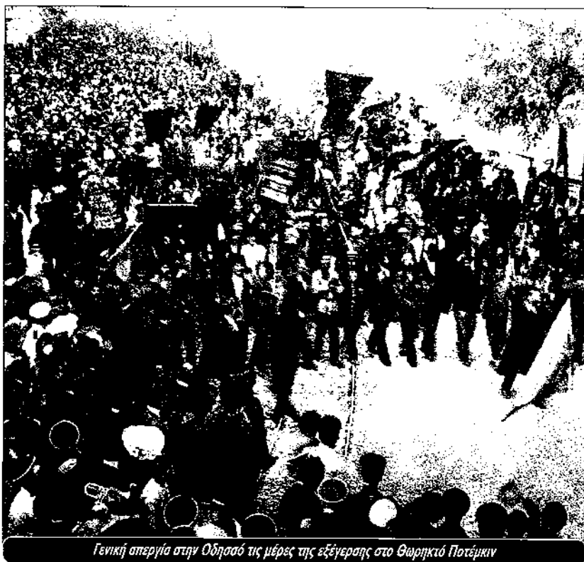
Γενική απεργία στην Οδησό τις μέρες της εξέγερσης στο Θωρηκτό Ποτέμκιν

νίας όταν είστε δυνατοί" λένε οι Μαρξιστές στους εργάτες. Όσο πιο δυνατό ήταν το κίνημα, τόσο περισσότερους εργάτες θα μπορούσε να τραβήξει στις κινητοποιήσεις. Μόνο ένα κίνημα που έβαζε πραγματικά στην σημαία του την προοπτική της νίκης μπορούσε να κερδίσει με τη μεριά του τις πιο καθυστερημένες μάζες των εργατών αλλά και τους αγρότες και τα άλλα καταπιεσμένα κομμάτια της κοινωνίας.