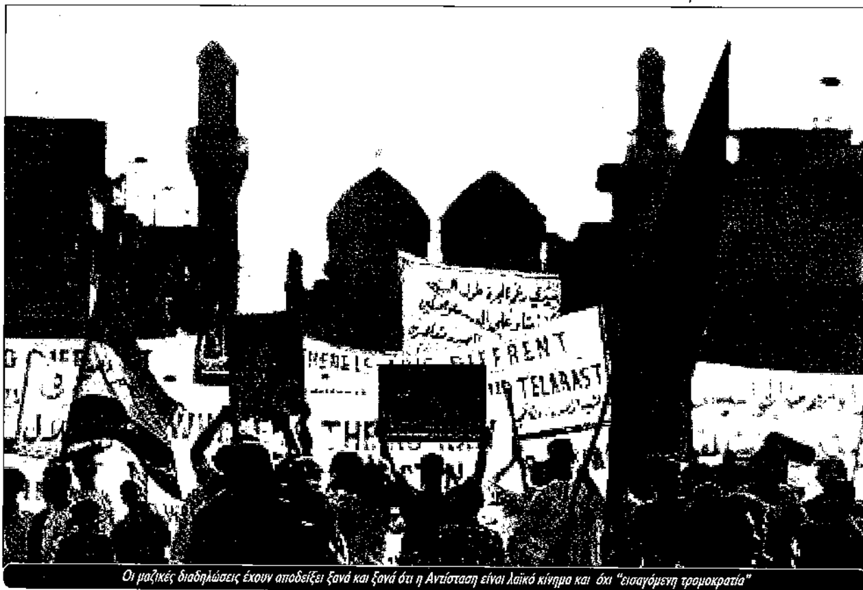
Οι μαζικές διαδηλώσεις έχουν αποδείξει ξανά και ξανά ότι η Αντίσταση είναι λαϊκό κίνημα και όχι "εισαγόμενη τρομοκρατία"