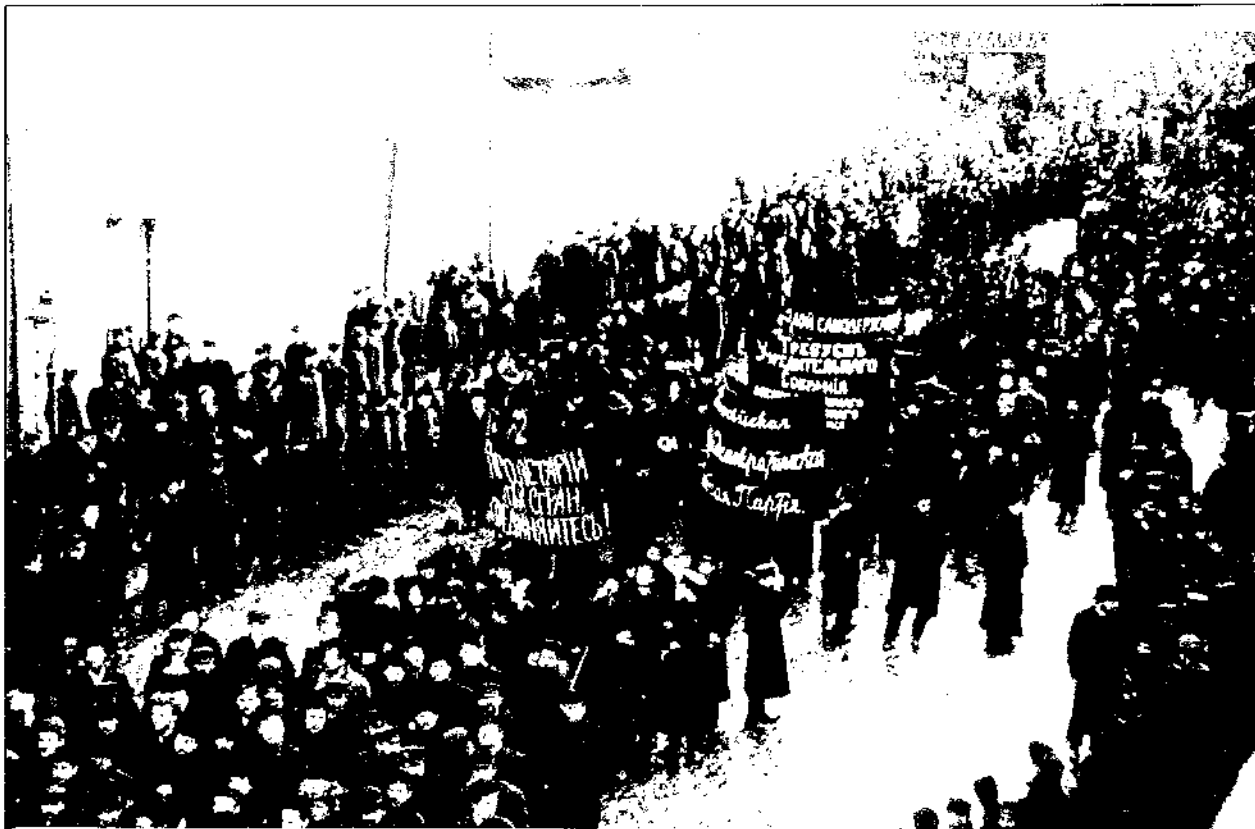
Εργατική διαδήλωση στη Μόσχα, λίγο πριν τα οδοφράγματα του Δεκέμβρη

Η Ρωσία του 1905 ήταν το καλύτερο παράδειγμα. Η μεγάλη απεργία που ξέσπασε τον Οκτώβρη είχε ξεκινήσει από ένα απλό, ασήμαντο οικονομικό αίτημα: οι τυπογράφοι, που πληρώνονταν εκείνη την εποχή με βάση τον αριθμό των γραμμάτων που τύπωναν, διεκδικούσαν να μετριούνται σαν γράμματα και τα σημεία στήξης. Από αυτήν την "συντεχνιακή" απεργία, όμως, ξεπήδησε ένα τεράστιο κίνημα με πολιτικές απεργίες και διαδηλώσεις σε ολόκληρη τη Ρωσία που ανάγκασε τον Τσάρο να υποσχεθεί μια ολόκληρη σειρά από δημοκρατικές μεταρρυθμίσεις. Ο οικονομικός αγώνας είχε γίνει η σπίθα για ένα τεράστιο πολιτικό κίνημα, στο οποίο συμμετείχαν ενεργά εκατοντάδες χιλιάδες άνθρωποι. Οι οικονομικοί αγώνες, γράφει η Ρόζα, είναι η "μόνιμη δεξαμενή" από την οποία η εργατική τάξη αντλεί κάθε φορά δύναμη για τους πολιτικούς αγώνες.