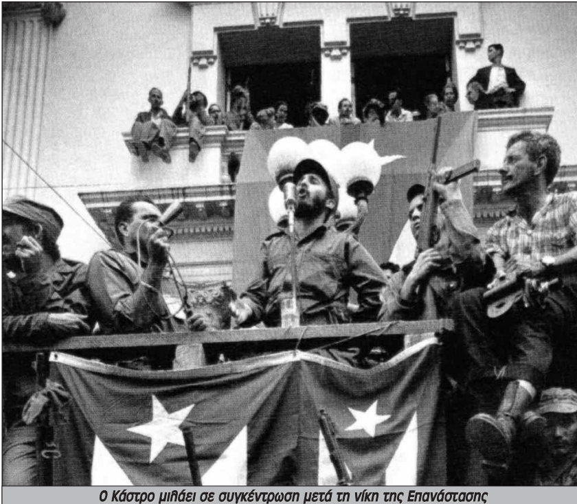
Ο Κάστρο μιλάει σε συγκέντρωση μετά τη νίκη της Επανάστασης

θα επιτρέψουν την εκβιομηχάνιση. Αυτό σήμαινε πίεση για ακόμη μεγαλύτερη εκμετάλλευση και των εργατών αλλιά και των αγροτών που είχαν μετατραπεί σε εργάτες γης.