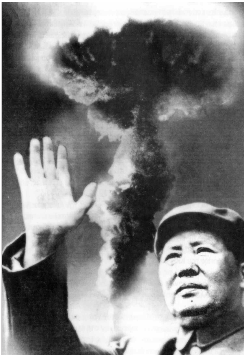
“Πρέπει να ξεπεράσουμε κάθε χώρα σε ατομικές βόμβες και υδρογονοβόμβες όποιο και αν είναι το κόστος”. Δήλωση του Μάο , Γενάρης 1965. Φωτομοντάζ από προπαγανδιστική αφίσα του καθεστώτος

«Στον αγώνα για την κατάληψη της εξουσίας πρέπει να εφαρμοστεί η μαρξιστική αρχή του τσακίσματος της παλιάς κρατικής μηχανής. Το σύστημα της εκμετάλλευσης και της γραφειοκρατίας πρέπει να διαλυθεί ολοκληρωτικά... Η πραγματική επανάσταση δεν έχει αρχίσει ακόμα... Το προλεταριάτο μπορεί να χάσει σε αυτή την επανάσταση μόνο τις αλυσίδες του, αλλιά μπορεί να κερδίσει τον κόσμο ολόκληρο. Η Κίνα του αύριο να είναι ο κόσμος