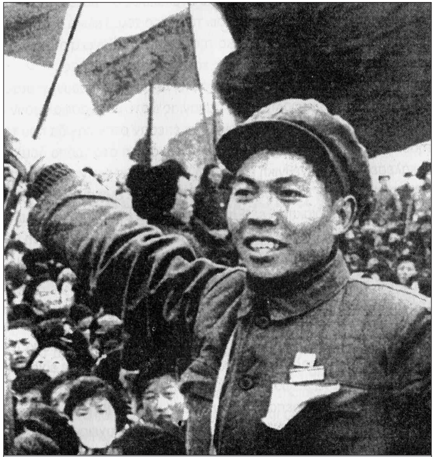
Το κίνημα των ερυθροφρουρών σύντομα ξέφυγε από τον έλεγχο του Μάο

«Η επανάστασή μας αφορά τη νεολαία και δεν πρέπει με κανένα τρόπο να επηρεάσει την παραγωγική διαδικασία με τρόπο που θα επιβραδύνει την οικονομική ανάπτυξη της χώρας», επανέλαβε πολλές φορές. «Οι εργάτες θα πρέπει να παραμένουν σταθερά στο πόστο της δουλειάς τους, να τηρούν σταθερά το οκτάωρο τους και να κάνουν επανάσταση μόνο στον ελεύθερο χρόνο τους εκτός ωραρίου εργασίας», έλεγε η ανακοίνωση του Πρακτορείου Νέα Κίνα στις 10 Φεβράρη 1968. Το Συνέδριο του ΚΚΚ αποφάσισε ότι στους χώρους δουλειάς θα έμπαινε σε εφαρμογή «ένα πρόγραμμα Σοσιαλιστικής Εκπαίδευσης, ενώ η Πολιτιστική Επανάσταση θα περιοριζόταν στους χώρους της εκπαίδευσης και του πολιτισμού καθώς και στα ηγετικά κλιμάκια του κόμματος και