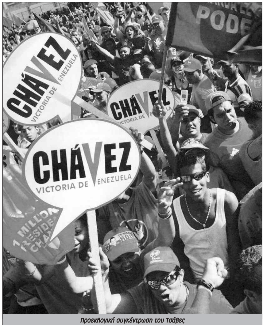
Προεκλογική συγκέντρωση του Τσάβες

Ακόμα περισσότερο, η «Λαϊκή εξουσία» δεν σημαίνει και πολλά πράγματα αν δεν μπορεί να διεισδύσει στα «σώματα ένοπλων ανθρώπων» τα οποία αποτελούν τον πυρήνα του κράτους, δηλαδή αν δεν υπάρχουν συμβούλια των φαντάρων τα οποία θα είναι συνδεδεμένα με τα συμβούλια στους χώρους δουλειάς και στις