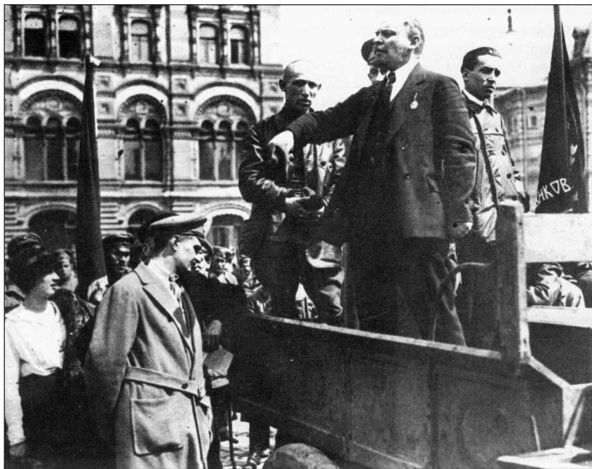
Ο Λένιν μιλάει σε συγκέντρωση το καλοκαίρι του 1917

ομού- να ακολουθήσουν μια επαναστατική πολιτική. Υπάρχει ένα χαρακτηριστικό επεισόδιο που διηγείται ένας άλλος ιστορικός της επανάστασης, ο αριστερός μενσεβίκος Σουχάνοβ. Ένας εργάτης που άκουγε τον Τσερετέλι, τον μενσεβίκο πρόεδρο της ΕΕ των Σοβιέτ, να τους μιλάει έξω από το Ανάκτορο της Ταυρίδας, πετάχτηκε μπροστά του κουνώντας οργισμένος τη γροθιά και λέγοντας: «Ε, τότε σκύλας γιε, πάρε την εξουσία όταν σου τη δίνουνε!»