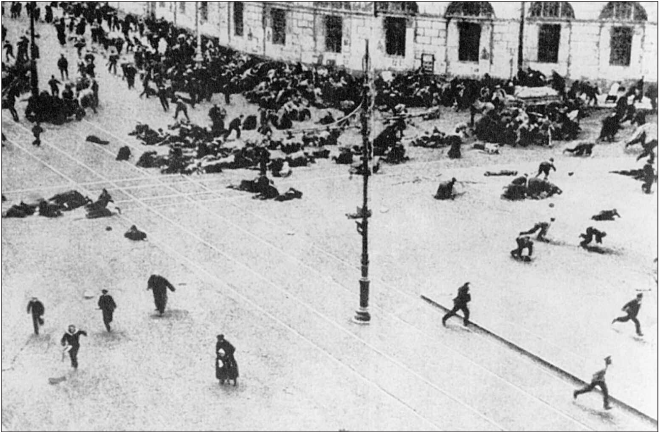
Διαδηλωτές δέχονται καταγισμό πυροβολισμών στο κέντρο της Πετρούπολης

μαινε πάλη: «Αυτό που καθορίζει τη στάση και τη συμπεριφορά του κόμματός μας είναι το βασικό και γενικό γεγονός ότι η πλειοψηφία δείχνει ακόμα εμπιστοσύνη στη μικροαστική πολιτική των μενσεβίκων και των εσέρων που εξαρτώνται από τους καπιταλιστές».