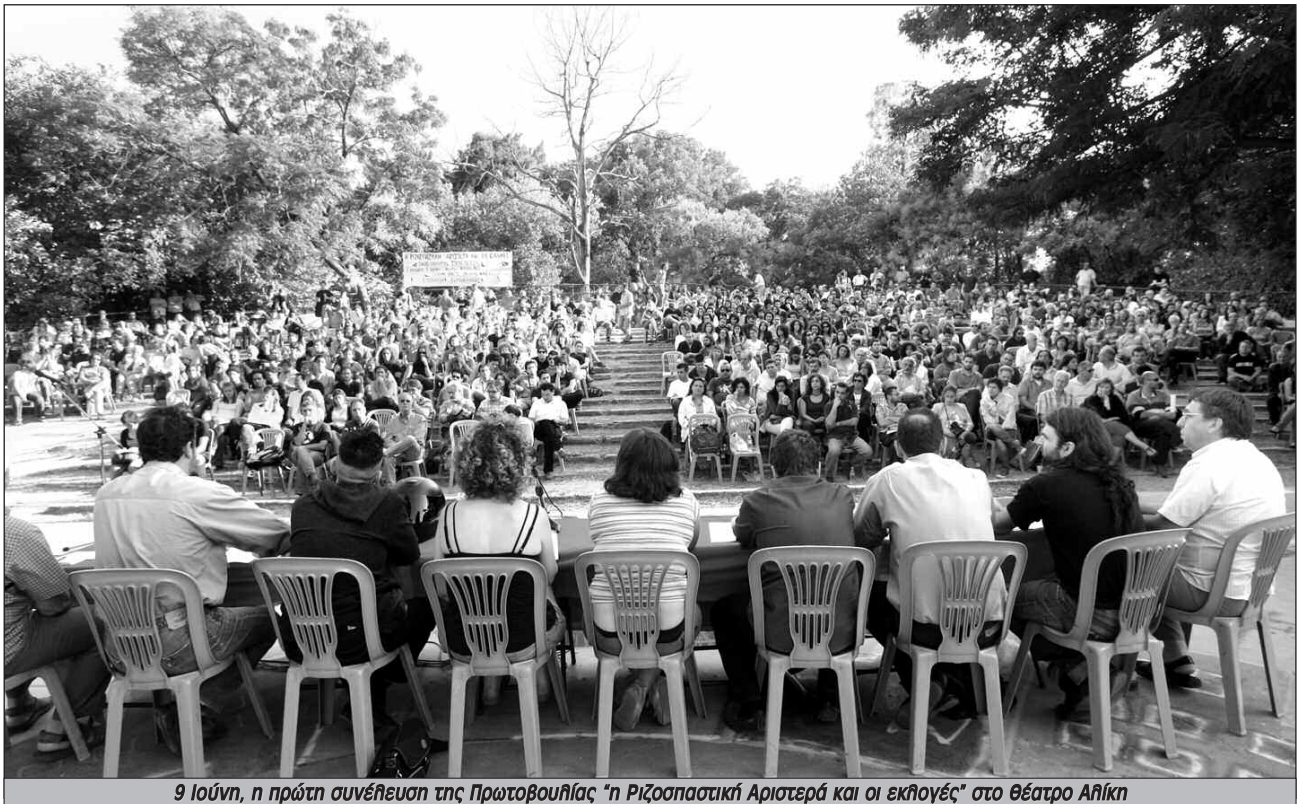
9 Ιούνη, η πρώτη συνέλευση της Πρωτοβουλίας "η Ριζοσπαστική Αριστερά και οι εκλογές" στο θέατρο Αθήνα

μέρες δόξας. Είναι, όμως, κοινό μυστικό ότι όλα τα οικονομικά επιτελεία ανησυχούν. Η περίοδος των χαμηλών επιτοκίων έχει πάρει τέλος και κανένας δεν είναι βέβαιος πόσο θα αντέξουν οι επιτυχημένες κερδοσκοπικές φούσκες στον επόμενο γύρο ανόδου των επιτοκίων. Το βάρος των τόκων στο δημόσιο προϋπολογισμό παραμένει τεράστιο και οι πιέσεις για νέους γύρους περικοπών, ιδιωτικοποιήσεων και άλλων «μεταρρυθμίσεων» μεγαλώνουν καθημερινά.