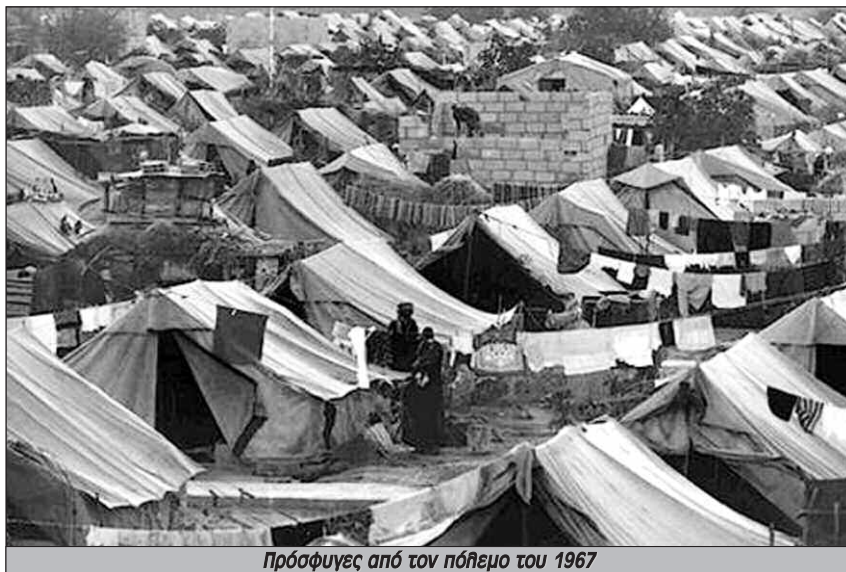
Πρόσφυγες από τον πόλεμο του 1967

Ο πόλεμος των έξι ημερών ήταν πράγματι σημείο καμπής. Η ιστορία, όμως, δεν έχει πει ακόμα την τελευταία της λέξη.