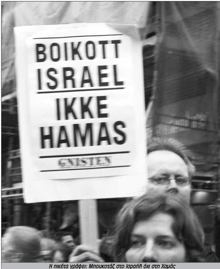
Η πικέτα γράφει: Μπουκοτζά στο Ισραήλ όχι στη Χαμάς

θυμο συνεργάτη τον Αμπάς. Η κυβέρνηση εθνικής ενότητας Φατάχ-Χαμάς που δημιουργήθηκε πριν 6 μήνες με μεσοδιάβαση της Σαουδικής Αραβίας ήταν ένα σύντομο διάλειμμα συνεργασίας που δεν κράτησε για πολύ. ΗΠΑ και Ισραήλ πίεζαν συνεχώς για νέες επιθέσεις σε βάρος της Χαμάς. Γι' αυτό και η προοπτική να ανατρέψουν με πραξικόπημα την δημοκρατικά εκλεγμένη κυβέρνηση ήταν το μόνο που τους έμενε. Για την πρακτική οργάνωση αυτών των σχεδίων χρειάστηκε η βοήθεια του Μουμπάρακ.