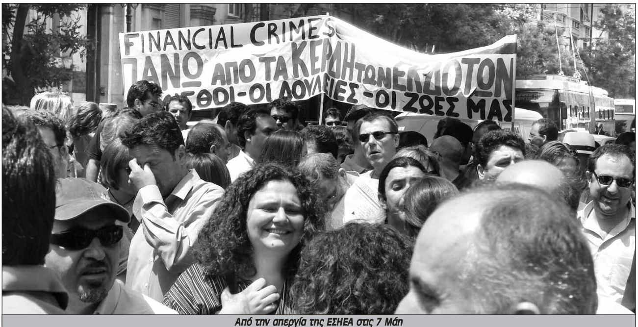
Από την απεργία της ΕΣΗΕΑ στις 7 Μάρ

καλήψουν ανάγκες και αναζητήσεις που δεν καλύπτονται από τον αστικό Τύπο, χωρίς όμως να έχουν συνειδητή και διακηρυγμένη θέση σε επαναστατική κατεύθυνση, ή πού δημιουργούνται στη διάρκεια μιας κινητοποίησης με στόχο να βοηθήσουν στην προβολή της και με διάρκεια ζωής, όσο και αυτή. Τέτοιου τύπου κινηματικά ΜΜΕ, συναντήσαμε σε επαναστατικές εξάρσεις και εξεγέρσεις (πχ Πολυτεχνείο 1973, η χρήση του ραδιοφωνικού σταθμού), σε δράσεις κοινωνικών ομάδων (ραδιόφωνα απεργιών και καταλήψεων στην Ελλάδα, την δεκαετία του 90, όπως στα ΤΕΙ, στους αγώνες της ΕΒΟ, της Πειραιϊκής-Πατριϊκής, κλπ).