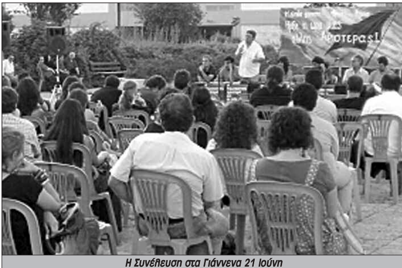
Η Συνέλευση στα Γιάννενα 21 Ιούνη

Η απόφαση της συνέλευσης για να προχωρήσει αυτή η πρωτοβουλία και σε τοπικό επίπεδο με την οργάνωση αντικαπιταλιστικών συνελεύσεων σε γειτονιές και χώρους εργασίας δεν άργησε να πάρει σάρκα και οστά. Την αρχή έκανε το Ρέθυμνο στις 17 Ιούνη. Πάνω από 80 άτομα συμμετείχαν στην πρώτη τοπική αντικαπιταλιστική συνέλευση που οργάνωσε πανελλαδικά. Η συνέλευση ξεκαθάρισε τα χαρακτηριστικά αυτής της πρωτοβουλίας, αποφάσισε τη διεύθυνση της στα γύρω χωριά και κατέληξε σε ένα εμπλουτισμένο κείμενο πρόταση προς την πανελλαδική συνέλευση της πρωτοβουλίας στις 14 Ιούλη. Όπως μας μετέφεραν οι σύντροφοι του Ρεθύμνου η καλύτερη στιγμή της συνέλευσης ήταν