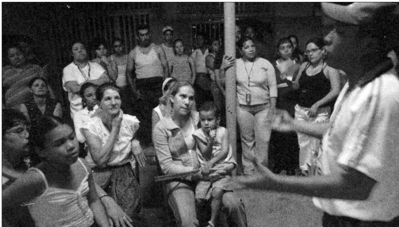
Συνεδρίαση μιας οργανωτικής επιτροπής του κοινοτικού συμβουλίου του Πετάρε, του μεγαλύτερου μπάριο στην Λατινική Αμερική

ζει ότι προσπαθεί να προωθήσει μεταρρυθμίσεις σε μια χώρα που παραμένει καπιταλιστική, χρησιμοποιώντας ένα κράτος που το στελεχώνουν άνθρωποι κατά κανόνα εχθρικοί στους σκοπούς του. Δεν υπάρχει κάποιο «εργαλείο» που να μπορεί να υλοποιήσει τις πολιτικές που υποστηρίζει ο Τσάβες ή που έστω να μπορεί να ανταποκρίνεται, με έναν περισσότερο από αυτοσχέδιο τρόπο, στη καθημερινή διαχείριση της κοινωνικής ζωής. Η κατάσταση είναι, όπως το θέτει ο αριστερός ακτιβιστής Ρολάντ Ντενίς, «χαοτική».