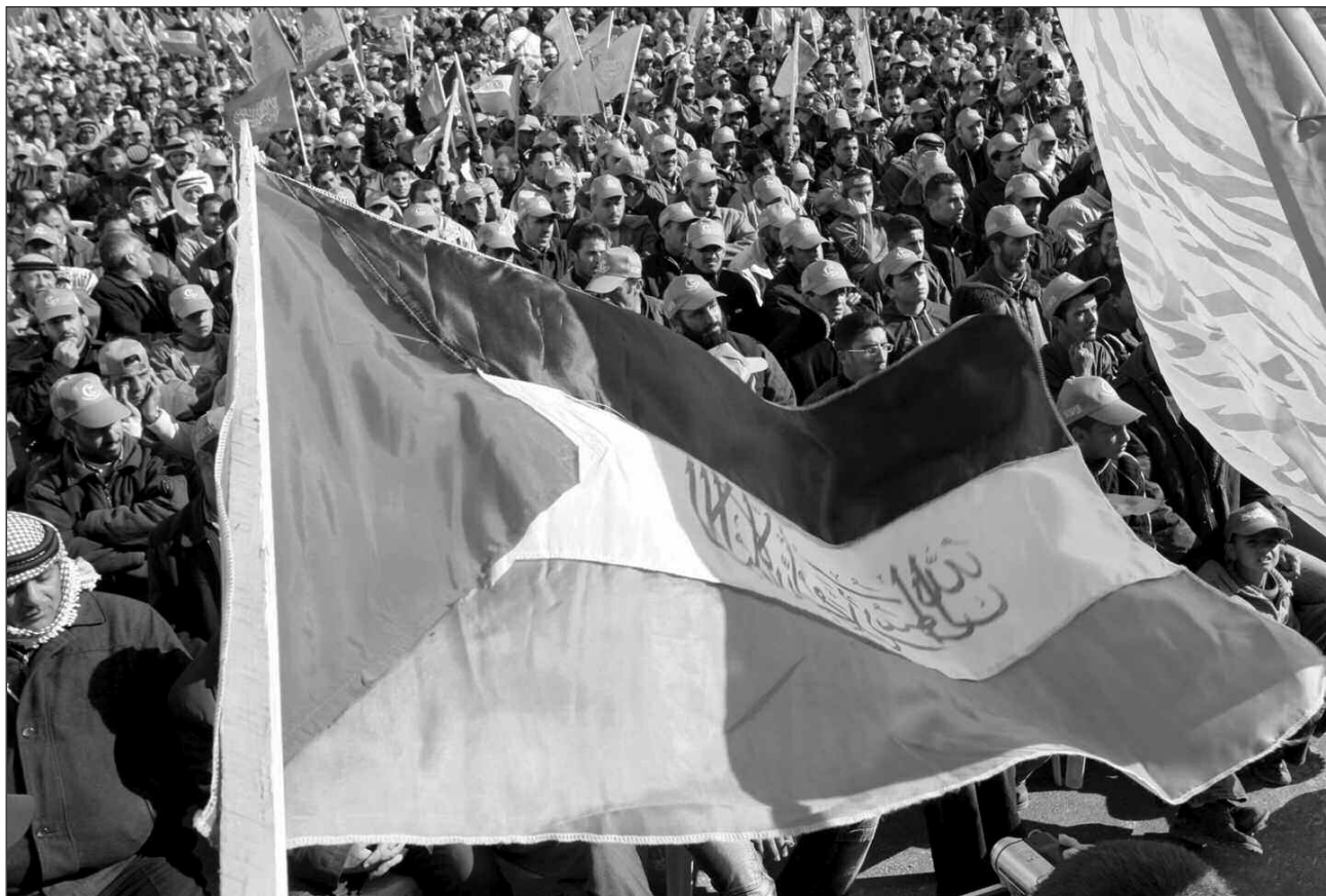
Συλλαλητήριο στη Γάζα

μική βοήθεια στον Αμπάς σε μια ανοιχτή προσπάθεια να στρέψουν τη Δυτική Όχθη ενάντια στη Γάζα. Αλλά ακόμα και αμερικάνοι αξιωματούχοι προειδοποιούν δημόσια τον Μπους ότι το μόνο που θα πετύχουν είναι να ενισχυθεί η επιρροή της Χαμάς και στη Δυτική Όχθη.