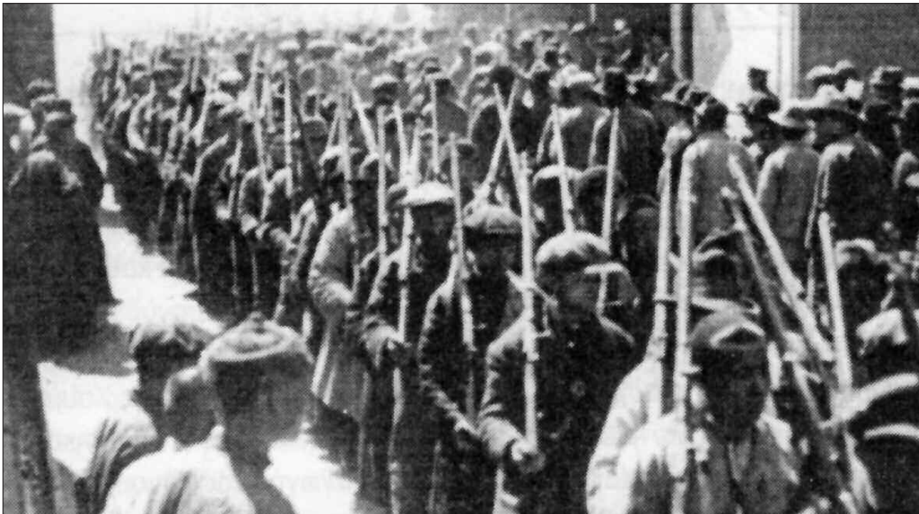
Η εργατική ποδηλοφυλακή στην Σαγκάη το 1927

γράμμα τα Πεντάχρονα Πλάνα με τα οποία ο Στάλιν πέτυχε την γρήγορη εκβιομηχάνιση της Ρωσίας τη δεκαετία του '30. Όμως, η Κίνα ήταν πολύ περισσότερο καθυστερημένη από τη Ρωσία. Η κινέζικη γραφειοκρατία αποφάσισε να αυξήσει απότομα και εντατικά το ρυθμό της οικονομικής ανάπτυξης. Ο Μάο επέβαλε το «Μεγάλο Άλημα Προς Τα Μπρος». Η εκμετάλλευση των εργατών και των εργατριών στα εργοστάσια κλιμακώθηκε σε σημεία τραγικά ενώ τα αποτελέσματα ήταν πενιχρά. Αν στις πόλεις το Μεγάλο Άλημα ήταν φιάσκο, στην επαρχία ήταν τραγωδία. Οι αναγκαστικές κολεκτιβοποιήσεις και η επιβολή στις αγροτικές «κομμούνες» να παράγουν μόνες τους ακόμα και το χάλυβα που θα χρησιμοποιούσαν, το μόνο που πέτυχαν ήταν ακόμα μεγαλύτερη φτώχεια. Το 1961 ξέσπασε λιμός που οδήγησε ακόμα και σε αγροτικές εξεγέρσεις. Την ίδια χρονιά ξεκίνησε και η ρήξη ανάμεσα σε Ρωσία και Κίνα που – παρά τη φιλολογία που αναπτύχθηκε εκ των υστέρων – είχε τις ρίζες της στις διαφορετικές φιλοδοξίες των γραφειοκρατικών αρχουσών τάξεων των δυο κρατικών καπιταλισμών.