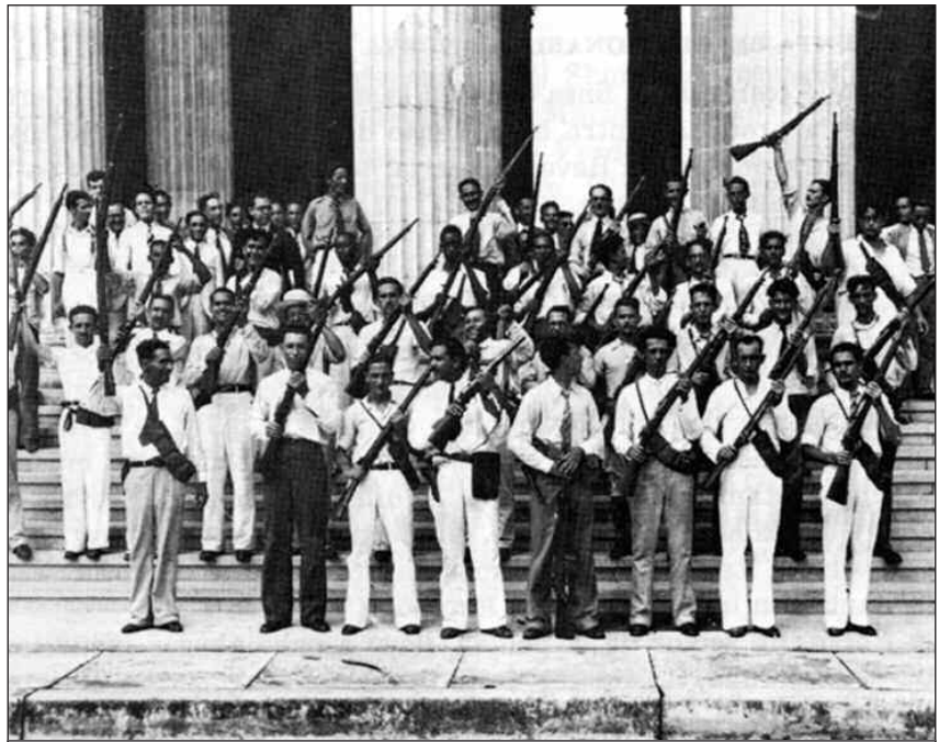
Φοιτητές και εργάτες μπροστά στο Προεδρικό Μέγαρο στην Αβάνα στην επανάσταση του 1933

Η κατάσταση οδηγεί τμήματα της γενιάς του '33 σε ριζοσπαστικοποίηση. Ο Κάστρο για παράδειγμα ήταν μέλος του κόμματος Ορτοντόβο που είχε διασπαστεί το 1947 από το κόμμα Αουτέντικο. Το