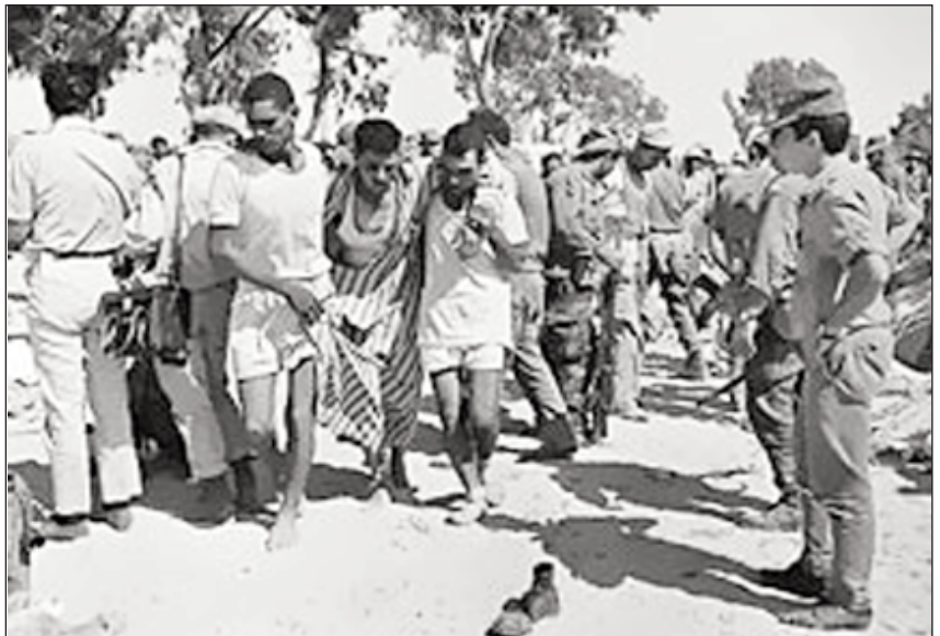
Αιγύπτιοι αιχμάλωτοι των Ισραηλινών. Εκατοντάδες εκτελέστηκαν και θάφτηκαν σε ομαδικούς τάφους.

Τα όρια του νασερισμού, όμως, δεν φαίνονταν μόνο στο εσωτερικό. Ο Νάσερ, παρά την σύγκρουσή του με την Βρετανία και τις άλλες Μεγάλες Δυνάμεις, συνέχισε να έχει στενές σχέσεις με όλα τα παλιά συντηρητικά αραβικά καθεστώτα που είχαν επιβιώσει από τις αρχές του 20ου αιώνα στην περιοχή: ο βασιλιάς Χουσεΐν της Ιορδανίας (που είχε προδώσει τους Παλαιστίνιους κλείνοντας μουσικές συμφωνίες με το Ισραήλ) ήταν ένας από τους διακεκριμένους "Αραβες αδελφούς μας".