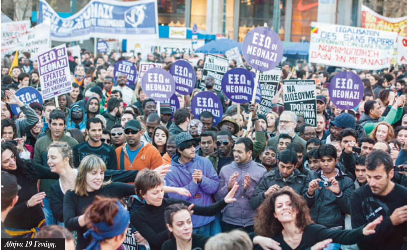
Αθήνα 19 Γενάου.

σμα έχει υποχωρήσει κατά 20% το τελευταίο διάστημα και το ζήτημα απασχόλησε τις συναντήσεις και των G7 και των G20. Γράφει σχετικά ο Μουσιές Λίτωνς στο blog «Η οικονομία με άλλο μάτι» στις 18 Φλεβάρη: