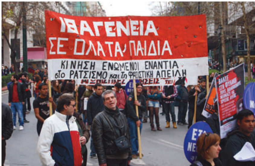
Πανεκπαιδευτικό συλλαλητήριο 2 Μάρτη.

γεγονός της γέννησης ή της ανατροφής του στην χώρα από πολύ νεαρή ηλικία.