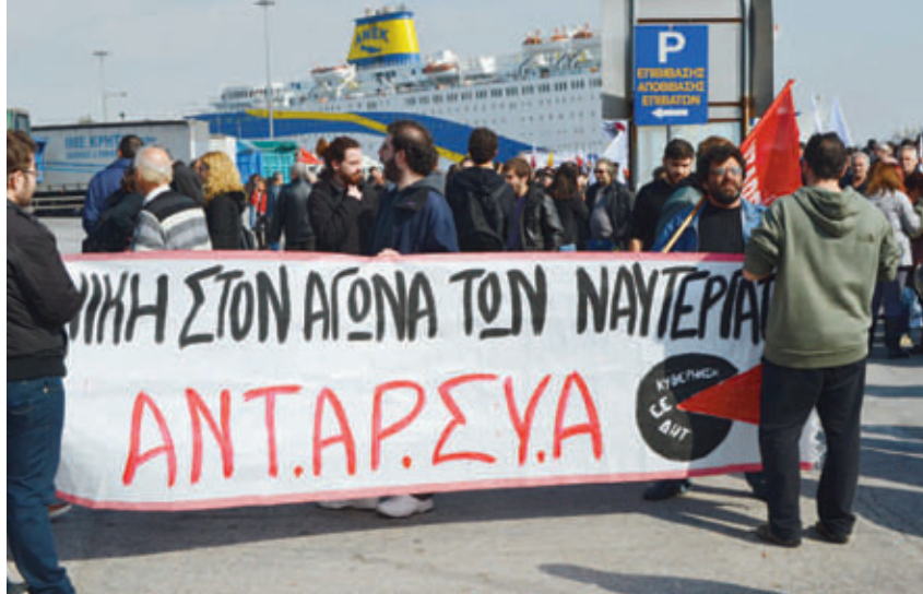
Συμπαράσταση στην απεργία των ναυτεργατών, στον Πειραιά.

Όταν οι σύνδεσμοι του ΣΥΡΙΖΑ με τα οργανωμένα τμήματα της τάξης συμπεριφέρονται έτσι, με κριτήριο την ψήφο, είναι επόμενο το οικονομικό επιτελείο του να κινείται ακόμη πιο δεξιά.