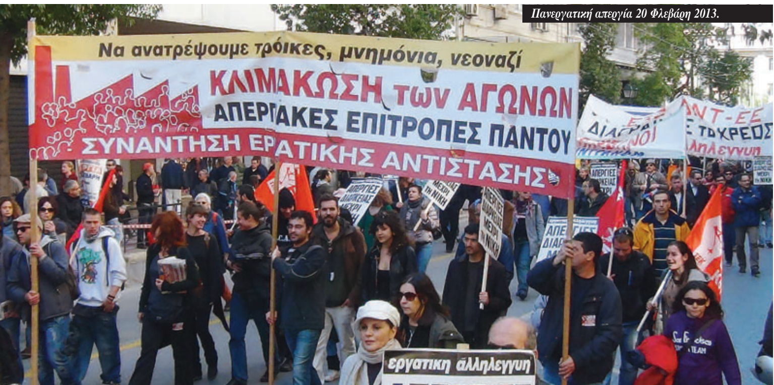
Πανεργατική απεργία 20 Φλεβάρη 2013.

Παρόλα αυτά, και το τρίτο Μνημόνιο υπογράφηκε από την ελληνική κυβέρνηση και την Τρόικα με την ίδια συνταγή όπως και τα προηγούμενα δυο. Οι επίσημες δικαιολογίες γι' αυτό ποικίλουν. Η Κομισιόν της ΕΕ αμφισβητεί τις μελέτες του ΔΝΤ για τον «πολλαπλασιαστική» γενικότερα αλλά και ειδικά για την Ελλάδα. Η δική της ερμηνεία είναι ότι τα προηγούμενα Μνημόνια ουσιαστικά δεν εφαρμόστηκαν λόγω της πολιτικής αστά-