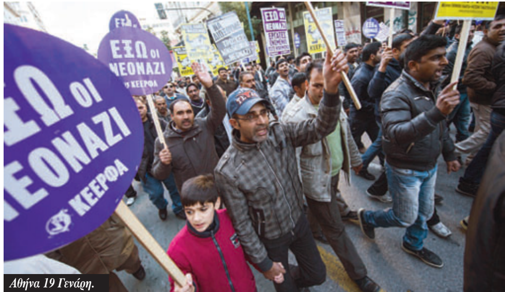
Αθήνα 19 Γενάρη.

Το Δικαστήριο έκρινε κατά πλειοψηφία (24 έναντι 13) αντισυνταγματικές τις