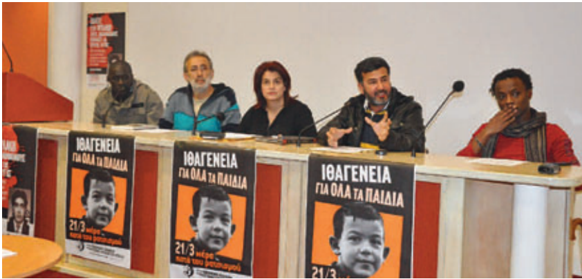
Σύσκεψη ΚΕΕΡΦΑ για την Ιθαγένεια.

συνδικαλιστικών και πολιτικών της οργανώσεων, ενάντια στη διάσπαση των εργατών και την επίθεση στα δικαιώματα των παιδιών τους. Είναι μια μάχη για την υπεράσπιση του πολυεθνικού χαρακτήρα της εργατικής τάξης στην Ελλάδα και της διεθνιστικής προοπτικής αυτής της τάξης, που κανένας “ανοιχτόμυαλος” εθνικισμός ή αστικός κοσμοπολιτισμός δεν μπορεί να την υποκαταστήσει. Για να δώσουμε αποτελεσματικά τη μάχη αυτή, χρειαζόμαστε καθαρές απαντήσεις σε κάποια κρίσιμα ζητήματα: