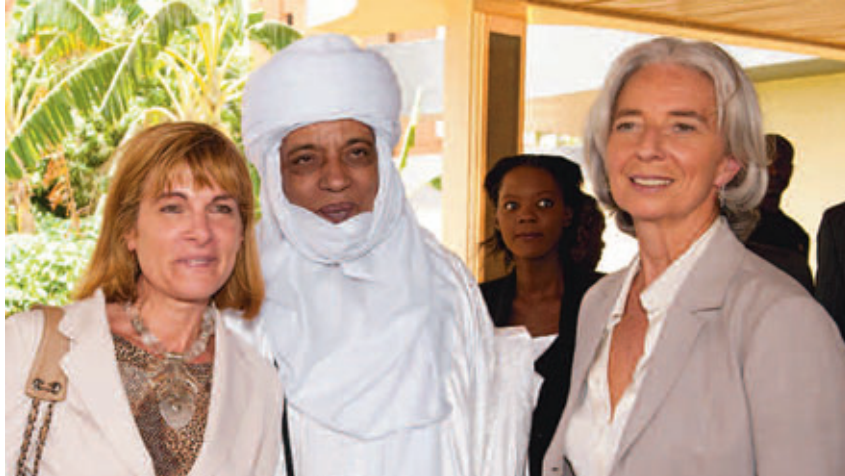
Η Κριστίν Λαγκάρντ ως υπουργός Οικονομικών μαζί με την εκπρόσωπο της γαλλικής πολυεθνικής AREVA συναντούν τον υπουργό Ορυχείων του Νίγηρα, το 2009. Τώρα η Γαλλία στέλνει τάνκς για να διασφαλίσει τον έλεγχο των κοιτασμάτων ουρανίου.

Παρά τη φαινομενική “έκπληξη” και την αίσθηση κατεπείγοντος, η επέμβαση στο Μαλί προετοιμάζεται εδώ και μήνες. Στις αρχές Νοέμβρη η Χίλαρι Κλίντον έκανε επίσκεψη στην περιοχή και προετοίμασε το έδαφος. Όταν συναντήθηκε με τον Αμπντελαζίζ Μπουτεφλίκα της Αλγερίας, τα διεθνή πρακτορεία μετέδωσαν δηλώσεις ανώνυμων αξιωματούχων: “[Οι Αλγερινοί] θα στηρίξουν μια μεγάλης κλίμακας προσπάθεια στο Μαλί και για να αποκατασταθεί η δημοκρατία και για να αποκατασταθεί η τάξη στο Βορρά”. Πηγή του αμερικανικού Υπουργείου Εξωτερικών έλεγε πως ο αλγερινός πρόεδρος “έχει αρχίσει να καλοβλέπει την ιδέα μιας εισβολής στο Μαλί, με διάφορα αφρικανικά καθεστώτα να συνεισφέρουν το ανθρώπινο δυναμικό ώστε να στηριχτεί η προσωρινή κυβέρνηση. Τότε, οι υπόλοιποι από εμάς θα πρέπει να υποστηρίξουμε μια