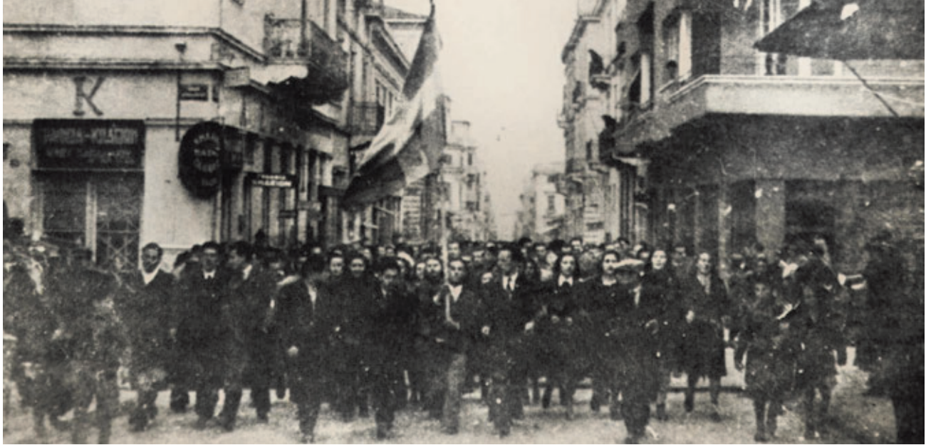
Διαδήλωση ενάντια στην επιστράτευση 24 Φλεβάρη 1943.

νας θα ήταν η συνισταμένη συνεχών λαϊκών διεκδικήσεων.