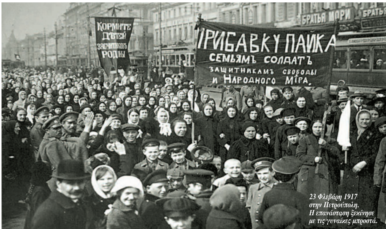
23 Φλεβάρη 1917 στην Πετρούπολη. Η επανάσταση ξεκίνησε με τις γυναίκες μπροστά.