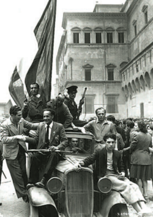
Η Μπολόνια απελευθερώνεται, 1944.