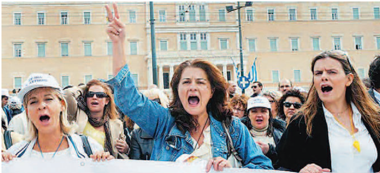
Απεργιακό συλλαλητήριο στο Σύνταγμα ενάντια στις απολύσεις.

νέα δικαιώματα και κατακτήσεις, έσβησαν από τον χάρτη ανισότητες χιλιετιών που κυριαρχούσαν και καθόριζαν τη ζωή των γυναικών.