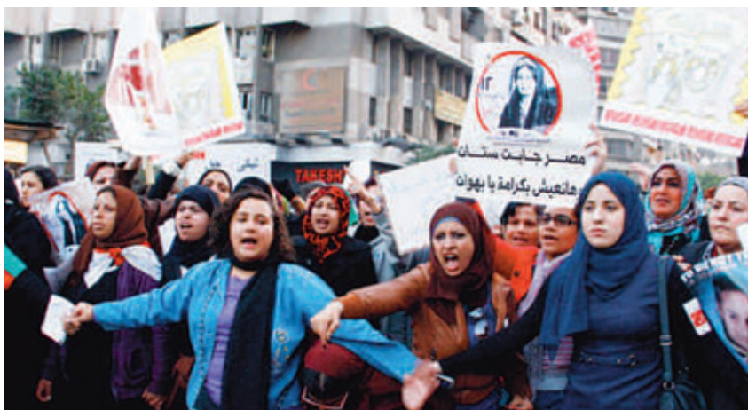
Διαδήλωση γυναικών στην Αίγυπτο.

Στις πρώτες ο καταμερισμός εργασίας ήταν μικρότερος απ' ό,τι στις δεύτερες που οι άντρες συνέχισαν να ασχολούνται με το κυνήγι και οι γυναίκες με τη βοσκή και με την καλλιέργεια. Η κατονομή δεν σήμαινε και κατώτερη θέση της γυναίκας στην κοινωνία. Η οικογένεια ήταν πολυγαμική (ομαδικοί γάμοι ανάμεσα σε δυο γένη). Η καταγωγή των παιδιών από τη μάνα. Όχι λόγω μητριαρχίας (αυτό αμφισβητείται) αλλά διότι έτσι μπορούσε κανένας να ξέρει την καταγωγή των παιδιών. Η ανατροφή των παιδιών και των γερόντων ήταν ομαδική μέσα στα πλαίσια της διευρυμέ-