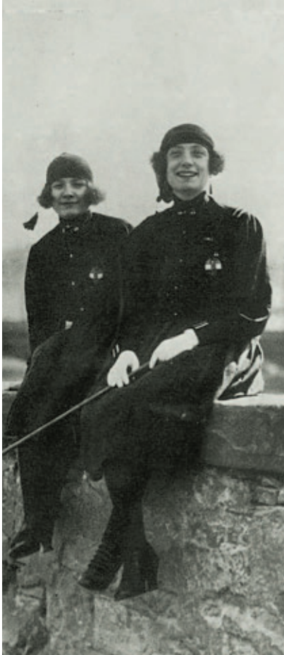
Μελανοχιτώνισσες στην Ιταλία (έτσι ονομάζονταν οι φασίστες λόγω των μαύρων στολών που φορούσαν).

1910 στην Κοπεγχάγη, επιβεβαίωσε την απόφαση για «την ψήφο σε όλες τις γυναίκες» και αποφάσισε να γίνει η 8 Μάρτη Διεθνής Μέρα για τις Γυναίκες. Η ημερομηνία και η ιδέα προήλθε από τη διαδήλωση που οργάνωσαν οι σοσιαλιστικές γυναίκες στη Νέα Υόρκη το 1908.